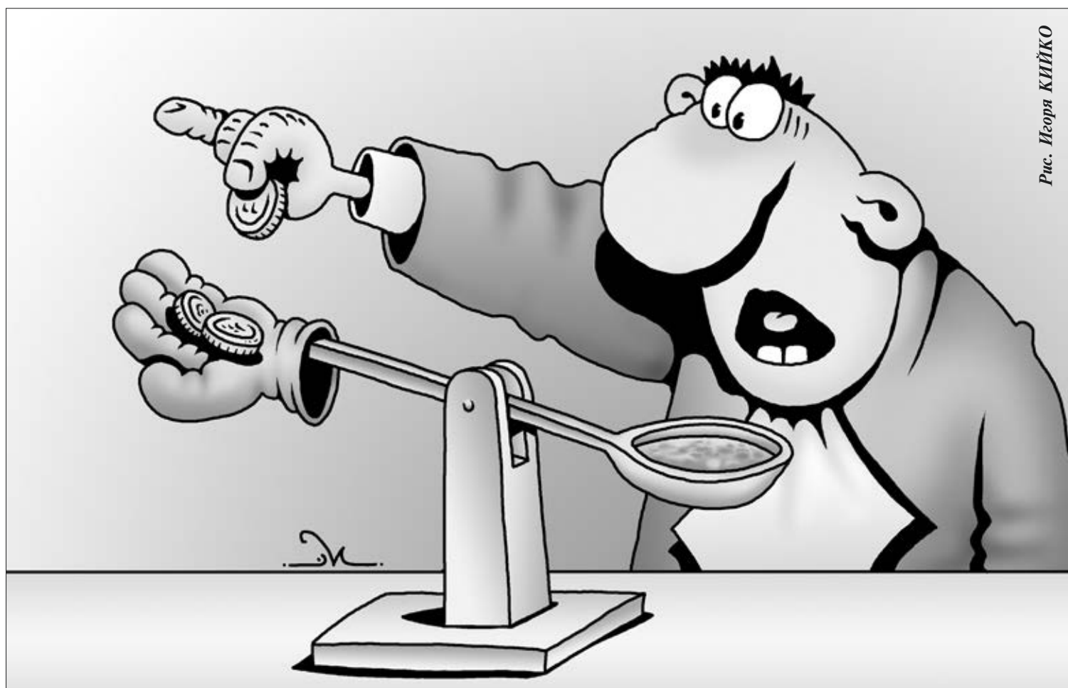
Рис. Игоря КЛИКО

В августе 2014 года в ответ на санкции, которые применили западные страны и США в отношении России, у нас ввели эмбарго на импорт из этих государств. Был объявлен курс на импортозамещение по целому ряду жизненно необходимых товаров, а это в первую очередь про-