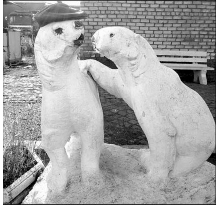
Многим биробиджанцам более памятен также канувший в Лету медвытрезвитель на Текстильной улице, носивший ласковое прозвище «Два медведя».

субъектов учреждения, которые будут выполнять названные функции. Нам ещё предстоит принимать свой, региональный закон — и прокуратура, конечно, будет участвовать в этом процессе, вносить предложения. Разработкой займется один из комитетов нашего Законодательного собрания. Необходимо определить порядок осуществления такой деятельности с учетом полномочий субъекта. В федеральном законе предусмотрена возможность привлечения к работе заинтересованных предпринимателей. Возможно, это будет государственно-частное партнерство. Вероятнее всего, оказываемые услуги будут платными.