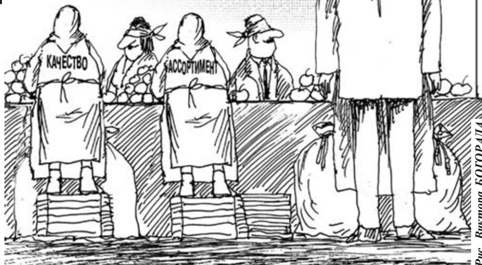
Рис. Виктора БОГОРАДА

Т ема роста цен на продукты питания сейчас едва ли не самая животрепещущая. Заходишь в магазин — и кажется, что дорожает всё. Особенно заметно — овощи и фрукты, о чём я писал в материале «Золотые помидоры» («Ди Вох» № 7 от 18 февраля 2021 г.).