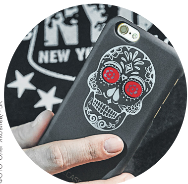
Новая модель «умного» чехла Cult