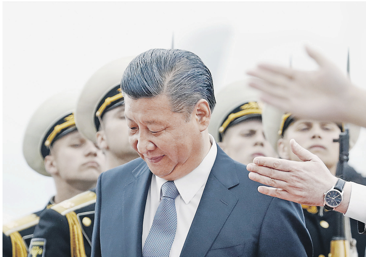
По итогам визита китайского лидера в Москву Владимир Путин и Си Цзиньпин (на фото) подписали два заявления: о дальнейшем стратегическом взаимодействии и о текущей ситуации в мире