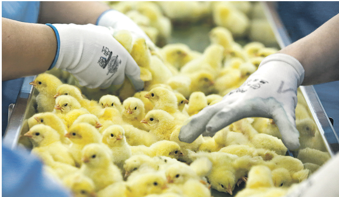
Самое большое число ИП и малых предприятий, получивших господдержку, работает в секторе сельского хозяйства. На него приходится около 51% всех получателей помощи властей