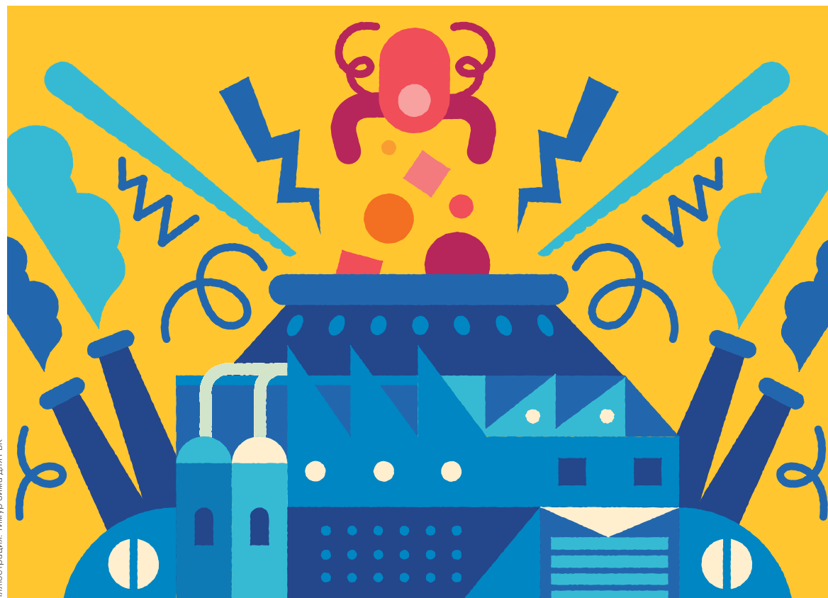
Иллюстрация: Тимур Зима для РБК

Рост цен на популярные промышленные металлы продолжится, считают аналитики. А своего пика