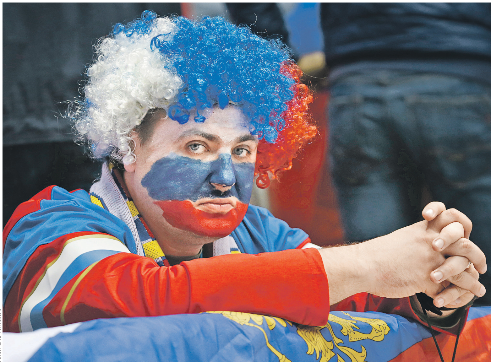
В России отстранение сборной от Олимпиады и участие в Играх спортсменов под нейтральным флагом посчитали «унизительным и неприемлемым»