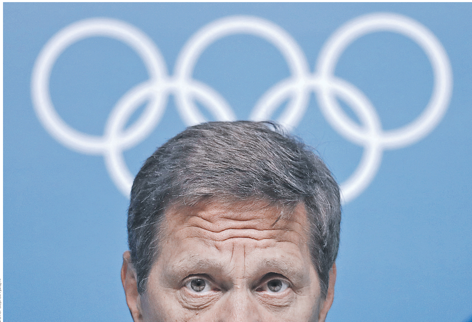
МОК приостановил членство в организации президента Олимпийского комитета России Александра Жукова

Перед оглашением вердикта обсуждались четыре базовых сценария дальнейшего развития событий — два радикальных и два компромиссных. Радикальные — допуск к играм российской сборной