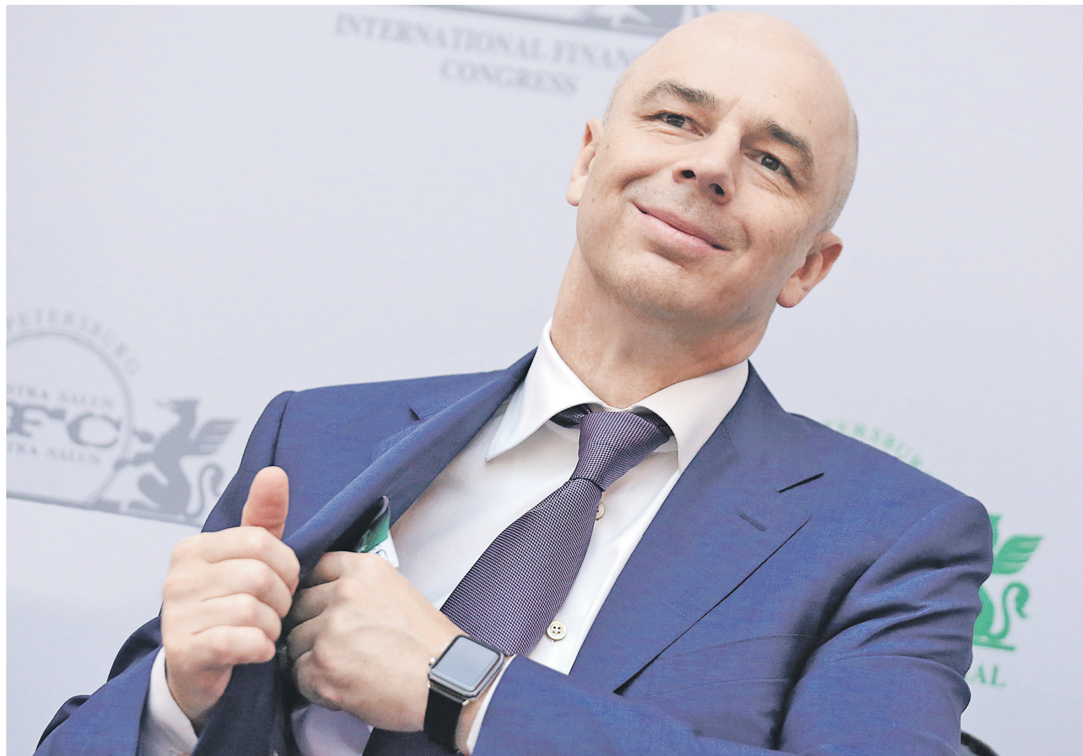
С 7 по 28 декабря 2017 года Минфином на покупку иностранной валюты на внутреннем валютном рынке будет в совокупности направлено 203,9 млрд руб. Ежедневный объем закупок составит 12,7 млрд руб. На фото: министр финансов Антон Силуанов

В декабре выплаты по внешнему долгу России (госсектор и компании) составят $18,13 млрд, сле-