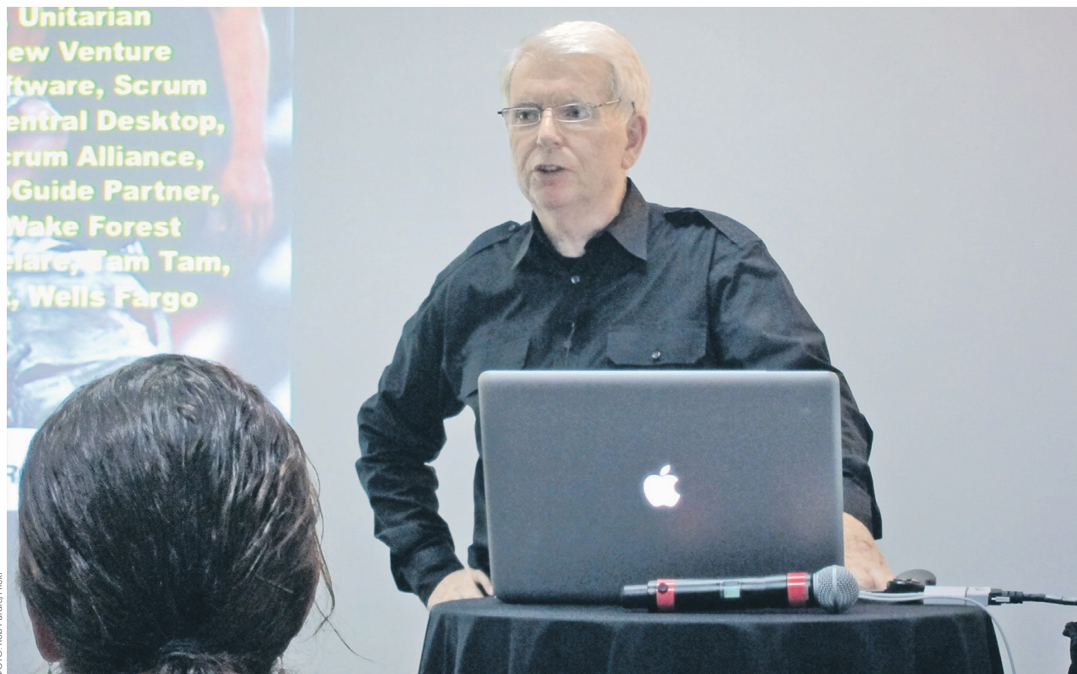
Один из создателей технологии гибкой разработки продуктов Scrum Джефф Сазерленд полагает, что компании сейчас нуждаются не в назначенных сверху менеджерах, а в неформальных лидерах, способных сплотить сотрудников вокруг идеи