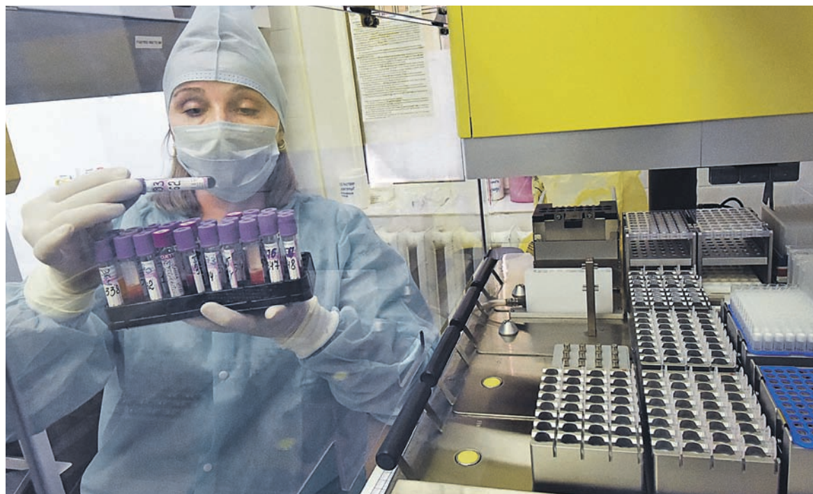
Жалобы населения на нехватку лекарств против ВИЧ в субъектах страны участились после передачи закупок медикаментов против инфекции с регионального уровня на федеральный

«Силами Росздравнадзора мы провели проверку остатков лекарственных препаратов в субъектах. Действительно, в двух десятках регионов есть дефектура [недостаток] по трем-пяти наименованиям — это объем менее месячной потребности», — рассказала РБК директор департамента по обращению лекарств и медицин-