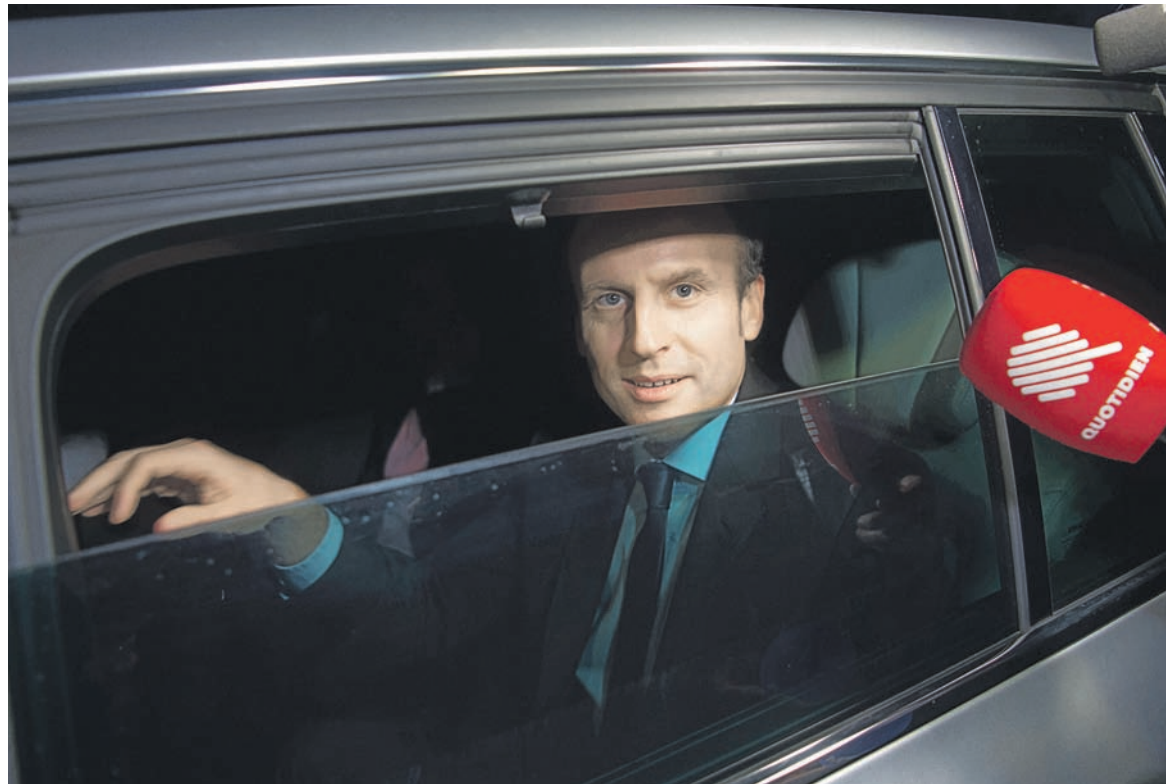
Именно умеренная проевропейская позиция одного из лидеров президентской гонки Эммануэля Макрона делает его мишенью для пропаганды Москвы, считает его соратник

В основном материалы являются новостными заметками, однако было опубликовано и несколько статей. Так, 3 февраля RT сообщил со ссылкой на газету «Известия», что основатель WikiLeaks Джулиан Ассанж имеет в распоряжении «компрометирующую переписку» Макрона с экс-кандидатом в президенты США Хиллари Клинтон. 9 февраля RT рассказал о связях Макрона с руководством медиа-концерна SFR Presse и телекоммуникационного гиганта Altice, что могло обеспечить ему хорошую прессу. 13 февраля на Sputnik вышла критическая колонка экономиста Жака Сапира, который