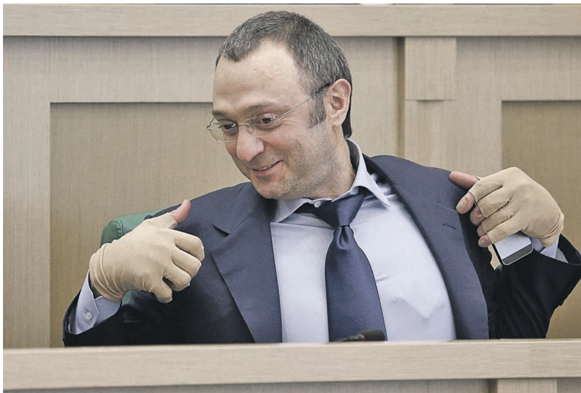
По итогам 2016 года состояние члена Совета Федерации Сулеймана Керимова оценивается в $1,6 млрд (совокупная стоимость «Полюса» и «Синема Парк») без учета аэропорта

Акционерное общество «Международный аэропорт «Махачкала» стало оператором аэропорта в 2014 году, следует из сообщения на сайте аэропорта. До этого им владела компания «Авиалинии Дагестана», которую в декабре 2011 года Росавиация лишила ли-