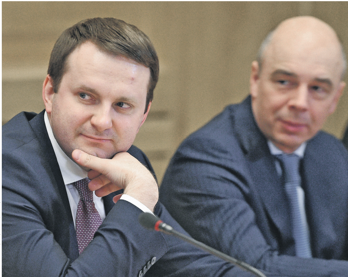
Налоговый маневр по схеме «21 на 21» предполагает снижение общей ставки страховых взносов до 21% с компенсирующим повышением ставки НДС до 21%. На фото: глава Минэкономразвития Максим Орешкин (слева) и глава Минфина Антон Силуанов

Официальный представитель Минэкономразвития не подтвердил эти параметры, сказав, что «такой информации нет». Представитель Минфина не ответил на запрос РБК.