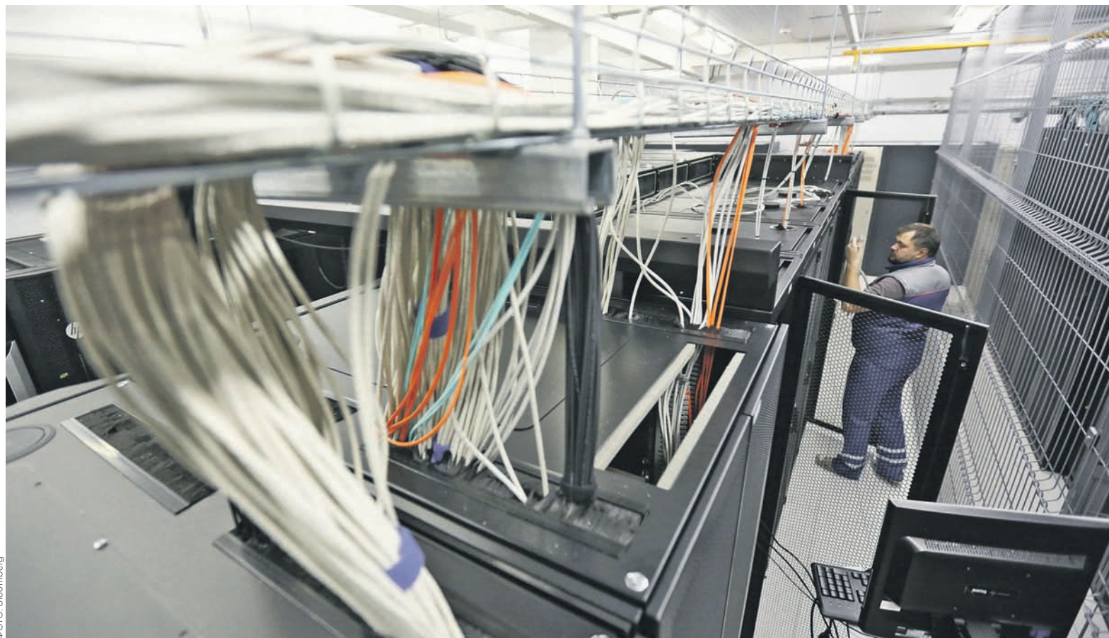
Формально операторы связи, храня объекты интеллектуальной собственности в составе сообщений, осуществляют их использование, а на это требуется согласие правообладателя

«С формальной точки зрения операторы связи, храня объекты интеллектуальной собственности в составе сообщений, осуществляют их использование, что требует получения согласия правообладателя», — сообщила РБК советник юридической фирмы Dentons Татьяна Никифорова. Она сомневается, что идея требовать от операторов заключения лицензионных договоров на хранение