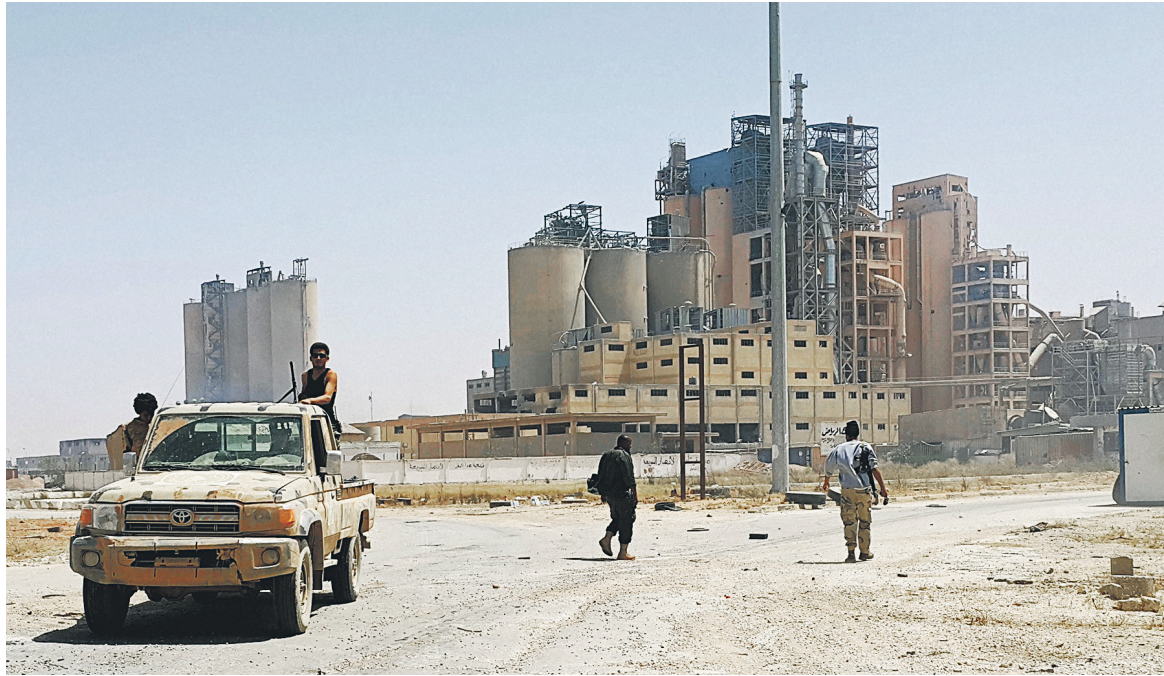
Изначально разминированием хотела заниматься британская компания, объявив за работу по $50 за 1 кв. м. Однако ливийцев предложенная британцами цена не устроила