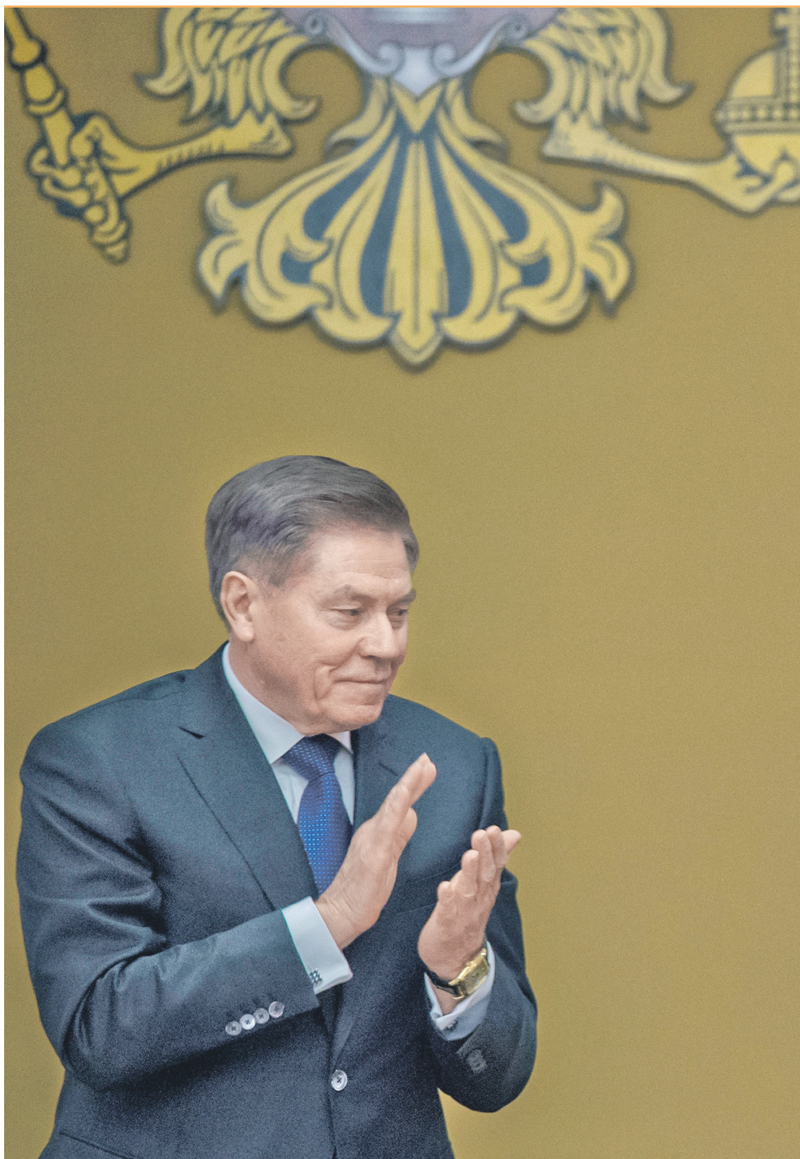
Верховный суд предлагает создать девять кассационных и пять апелляционных судов. На фото: председатель ВС Вячеслав Лебедев