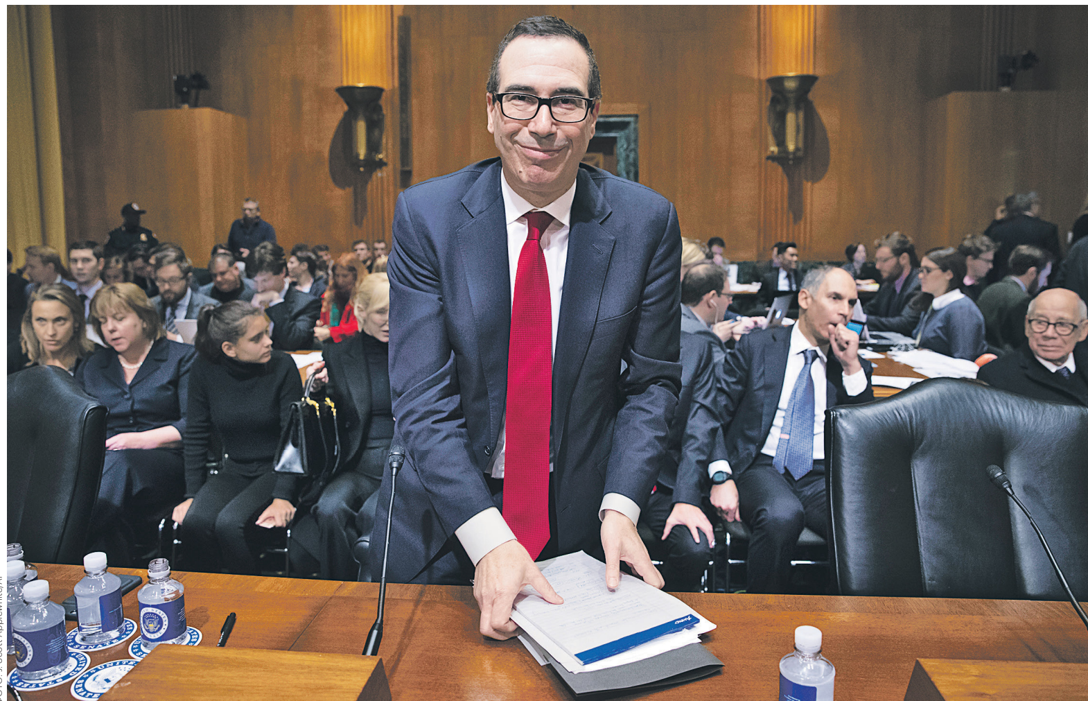
Включение российских «олигархов» в список, который подготовил Минфин США для конгресса, не означает для его фигурантов автоматического попадания под санкции, однако делает риск такого развития событий существенным. На фото: глава Минфина США Стивен Мнучин