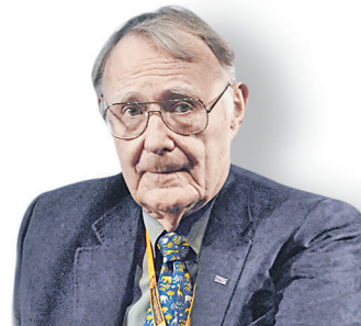
Ингвар Кампрад, основатель IKEA

ЕЖЕДНЕВНАЯ ДЕЛОВАЯ ГАЗЕТА 29 января 2018 Понедельник № 15 (2739)