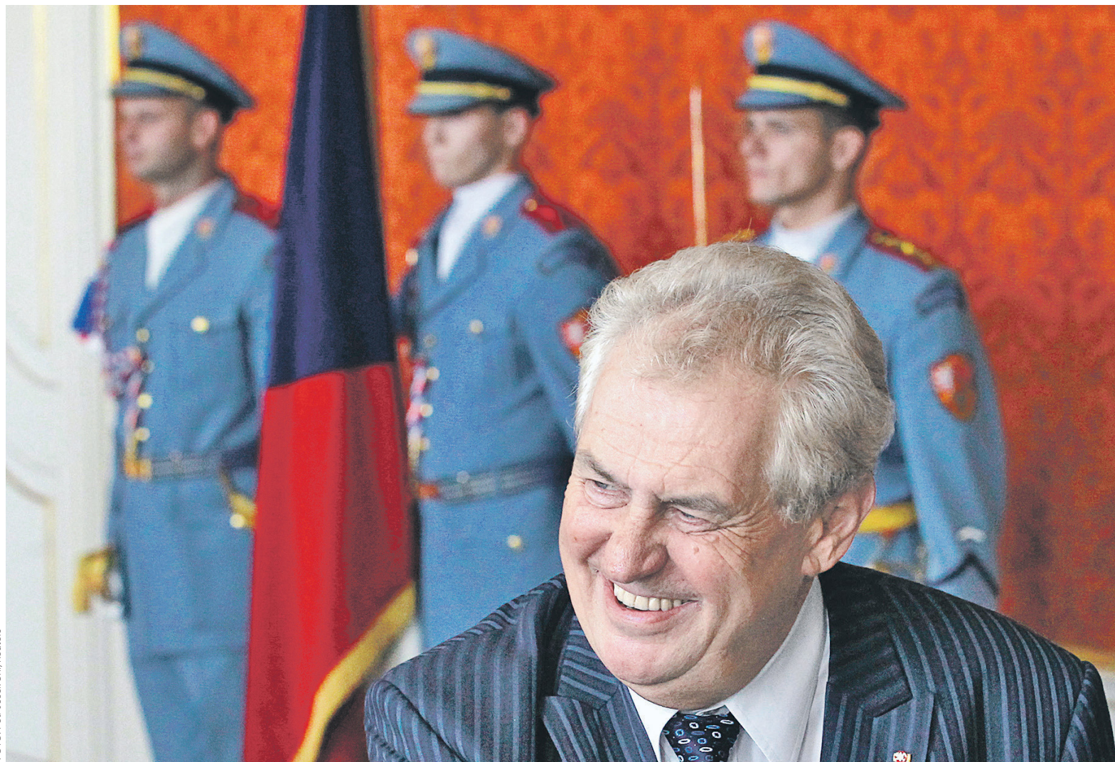
Полномочия 73-летнего президента Чехии Милоша Земана во внутренней политике страны ограничены. Однако он активно оказывает влияние на ее внешнюю политику