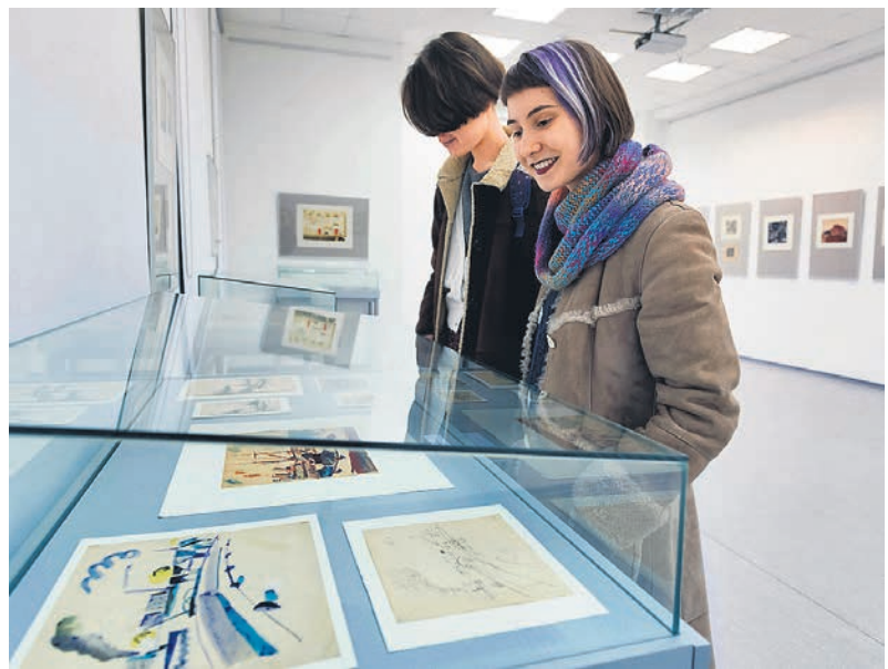
Цельное, но грустное искусство Юрия Сырнева создает мир, который не нуждается в людях как действующих лицах