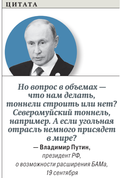
— Владимир Путин, президент РФ, о возможности расширения БАМа, 19 сентября

В письме говорится, что поступило «обращение от пользователя услуг о возможности первоочередности предоставления гарантий по провозным способностям железной дороги на условиях повышенных платежей».