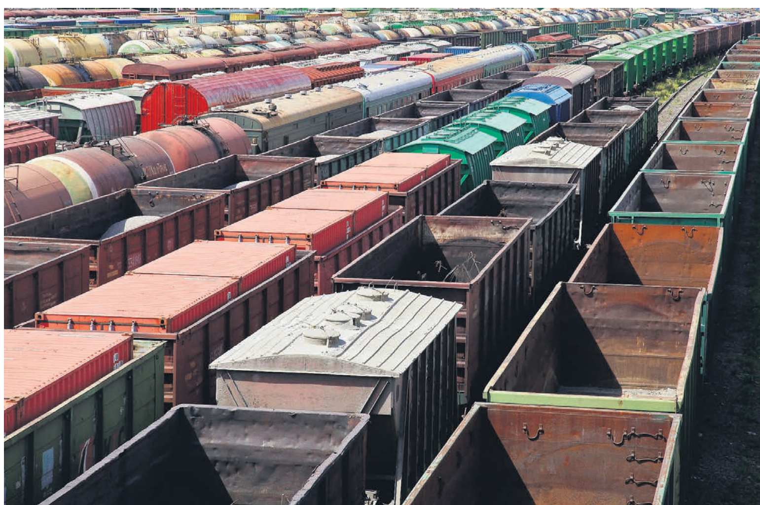
Правительство ищет способ закрыть дефицит в размере почти 300 млрд руб. в инвестиционной программе ОАО РЖД на 2022 год

Для закрытия дефицита в 2022 году, помимо мер, связанных с повышением тарифов на перевозку контейнеров, отмены или прео-