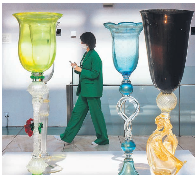
Привычные предметы по случаю выставки обрели неожиданные размеры