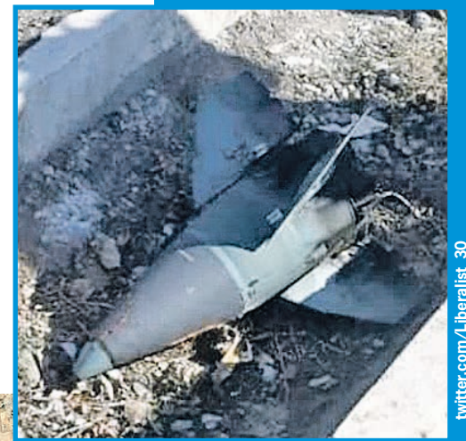
Головной обтекатель боевой части ракеты, поразившей «Боинг».

В итоге, несмотря на всю взаимную неприязнь, и Запад, и Иран неожиданно сходятся в одном: запуск той роковой ракеты «земля - воздух» произошел по ошибке. Похоже, это объяснение и можно считать наиболее близким к правде?