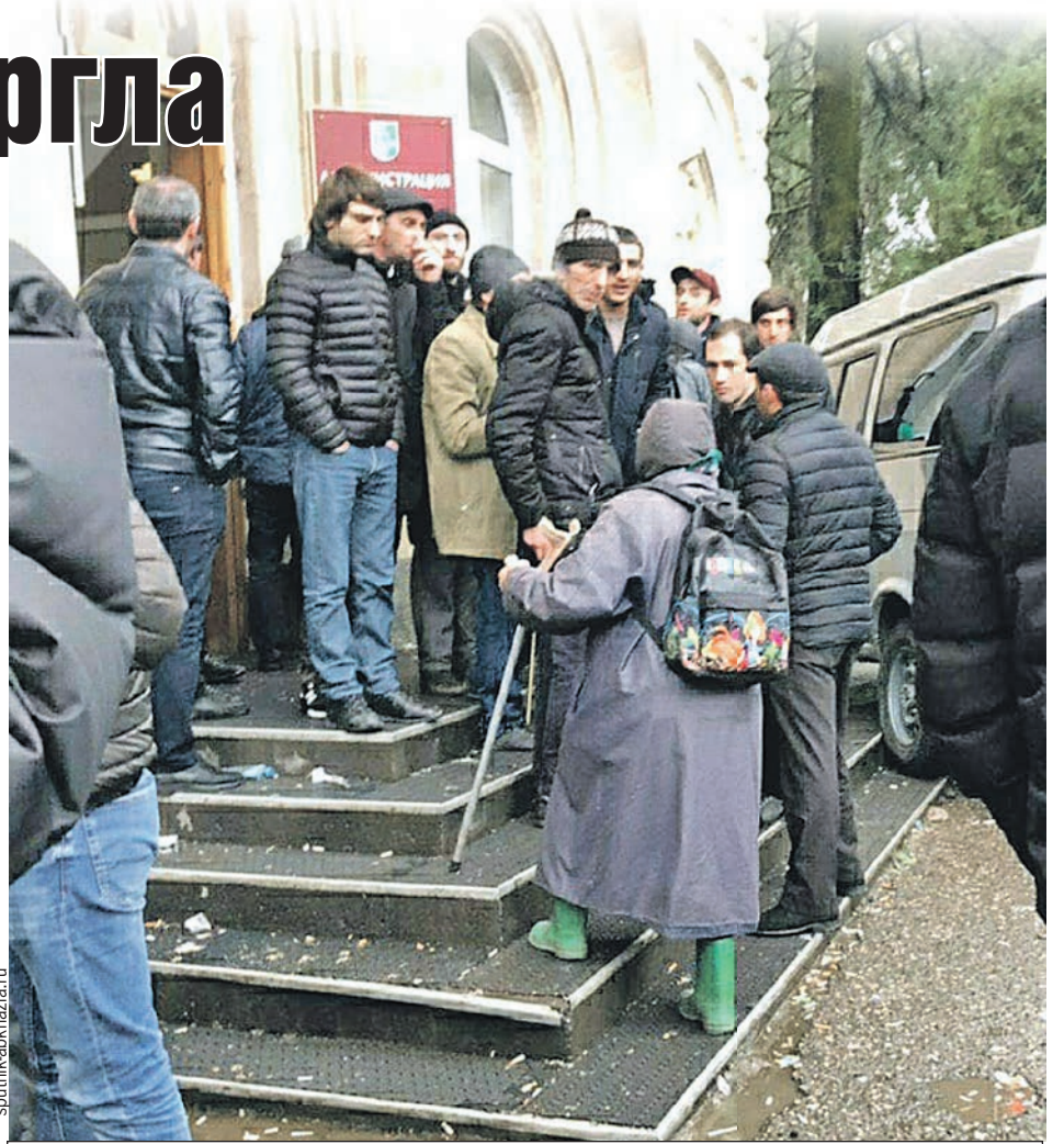
Бабушка пришла в Сухум ко дворцу за пенсией - а тут опять революция!

Хаджимба не захотел (или не смог) защитить даже своего вице-президента, которого побили какие-то влиятельные люди. Не