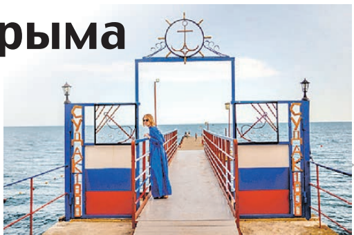
Виктор Гусейнов/«КП» - Москва