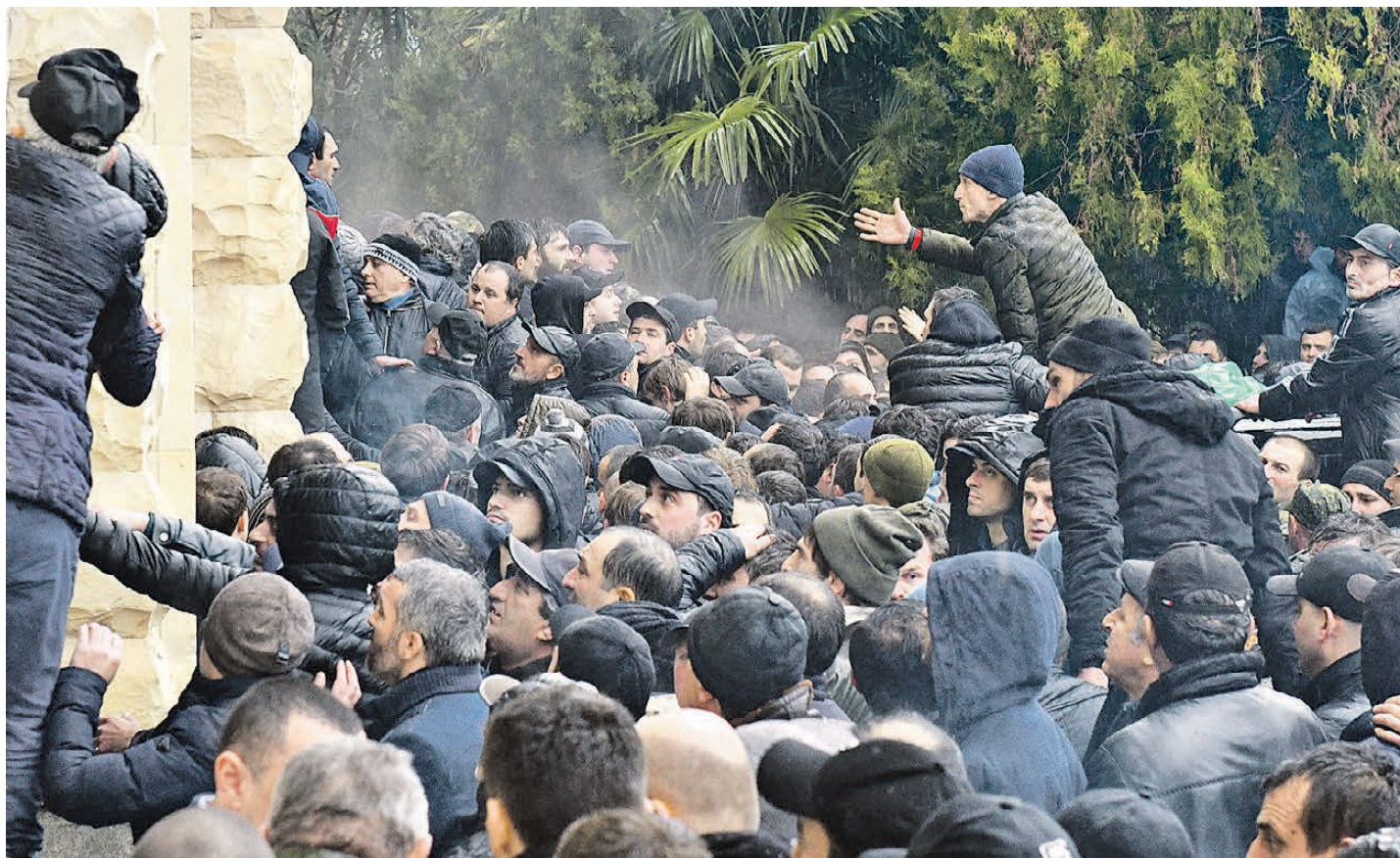
Борис Кудрявов/Экспресс газета