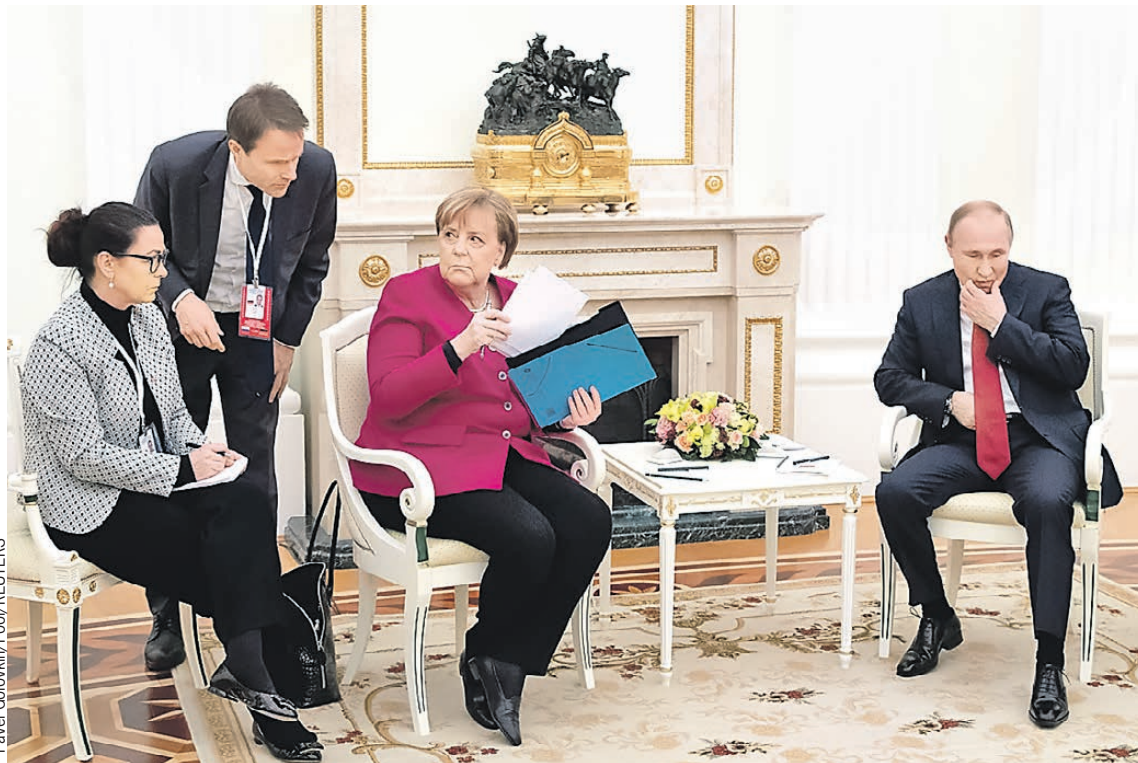
Канцлер Ангела Меркель прилетела в Москву, чтобы подтвердить президенту Владимиру Путину свою решимость сделать все ради получения газа из России напрямую.

стоятельно, без привлечения иностранных партнеров, - подтвердил Путин. - Вопрос в сроках. Это единственный вопрос, который встанет в этой связи. Окончание строительства будет отодвинуто на несколько месяцев.