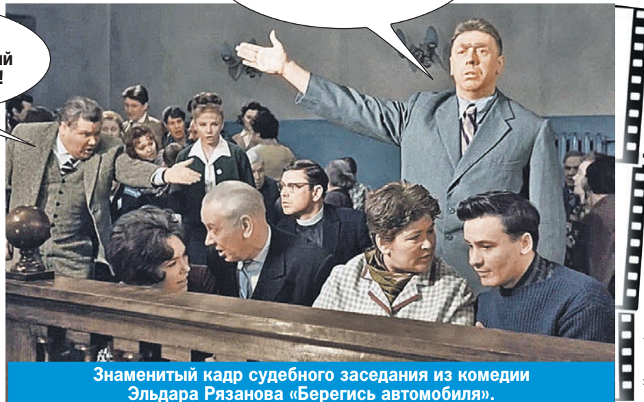
Знаменитый кадр судебного заседания из комедии Эльдара Рязанова «Берегись автомобиля».

- Для нас, элиты, должен быть особый Уголовный кодекс!