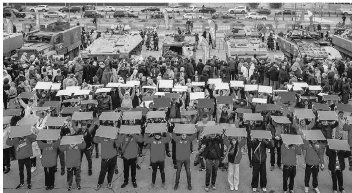
В Ханты-Мансийске жители выстроились в форме живого флага России.