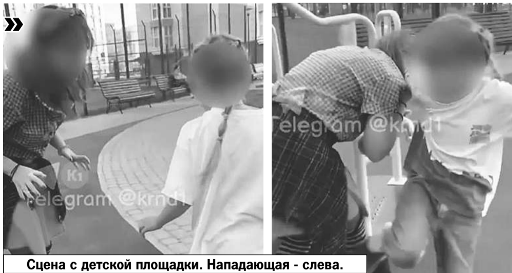
Сцена с детской площадки. Нападающая - слева.