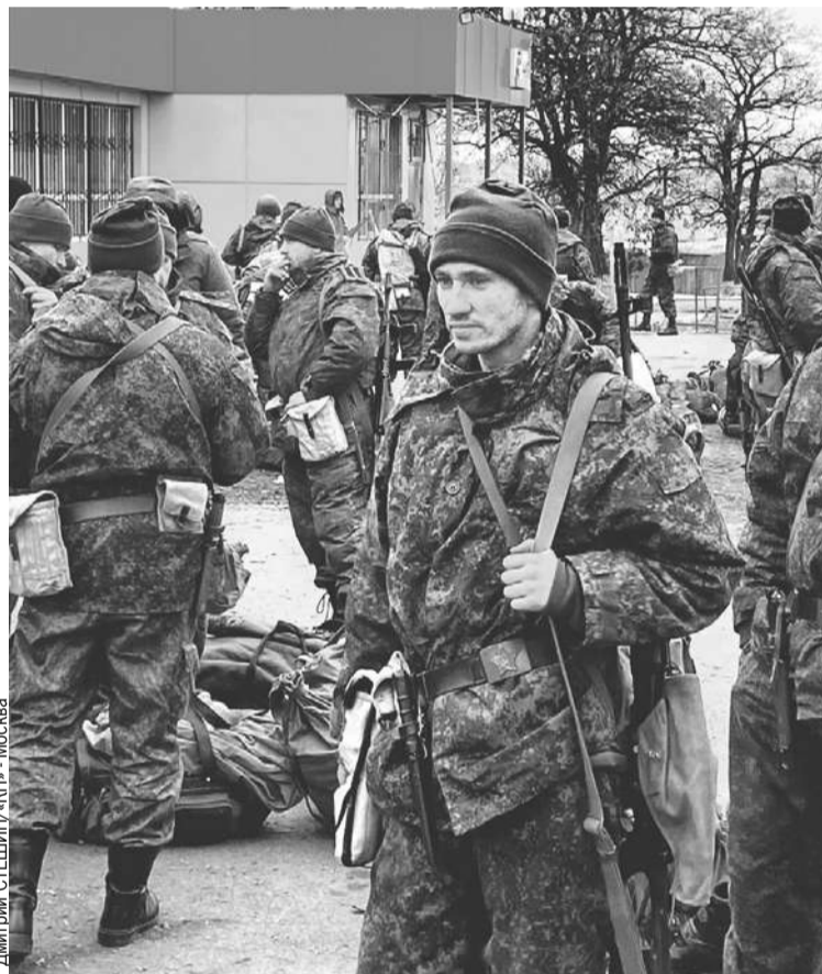
Дмитрий СТЕШИН, «КП» - Москва

Эти фотографии военкор «КП» Дима Штешин сделал в марте 2022-го. Мобилизованный в Донецке солдатик в дедовской каске времен Великой Отечественной перед штурмом Мариуполя. А справа - сбор резервистов, которые идут штурмовать Волноваху. Выжившие потом сыграют в кино самих себя.