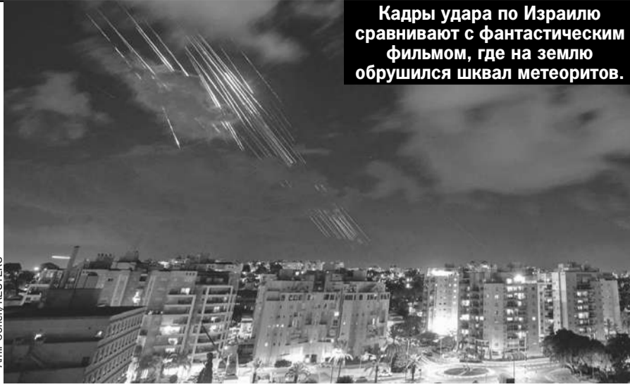
Кадры удара по Израилю сравнивают с фантастическим фильмом, где на землю обрушился шквал метеоритов.

Армия Ливана в мирный период насчитывала 60 тысяч человек. Сейчас - 80 тысяч. По суммарному боевому потенциалу она примерно в 8 - 10 раз слабее израильской. В мировом рейтинге боевой мощи они на разных