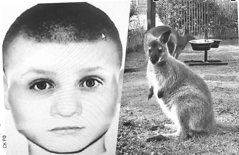
По такому фотороботу искали проникшего в зоопарки вора.

Большая сумка, с такими в 90-е ездили за границу челноки. Полицейский открывает молнию, внутри - комочек, только глаза блестят. Мордочка испуганная, шерсть свалялась. Нашелся! Три дня назад этот кенгуренок был похищен из калужского мини-зоопарка. Еще два парой дней ранее - из ярославского.