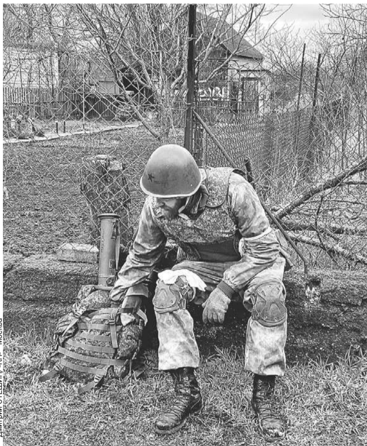
Дмитрий СТЕШИН, «КП» - Москва

Вы можете представить себе такую икебану смыслов в одной точке? Это не икебана, это лазерный меч, и он проткнул ветхую ткань «массовой культурки». Второго октября в рейтинге российских сериалов «Резервисты» вдруг оказались уже на пятом месте. На самой платформе оценка сериала - небывалые до сих пор 10,0 балла. Их ставят зрители, их не обманешь. Мне кажется, это Знак, перемены добрались до самой парадоксально-окостенелой сферы нашей жизни - кинематографа. Ему теперь не отсидеться в тылу.