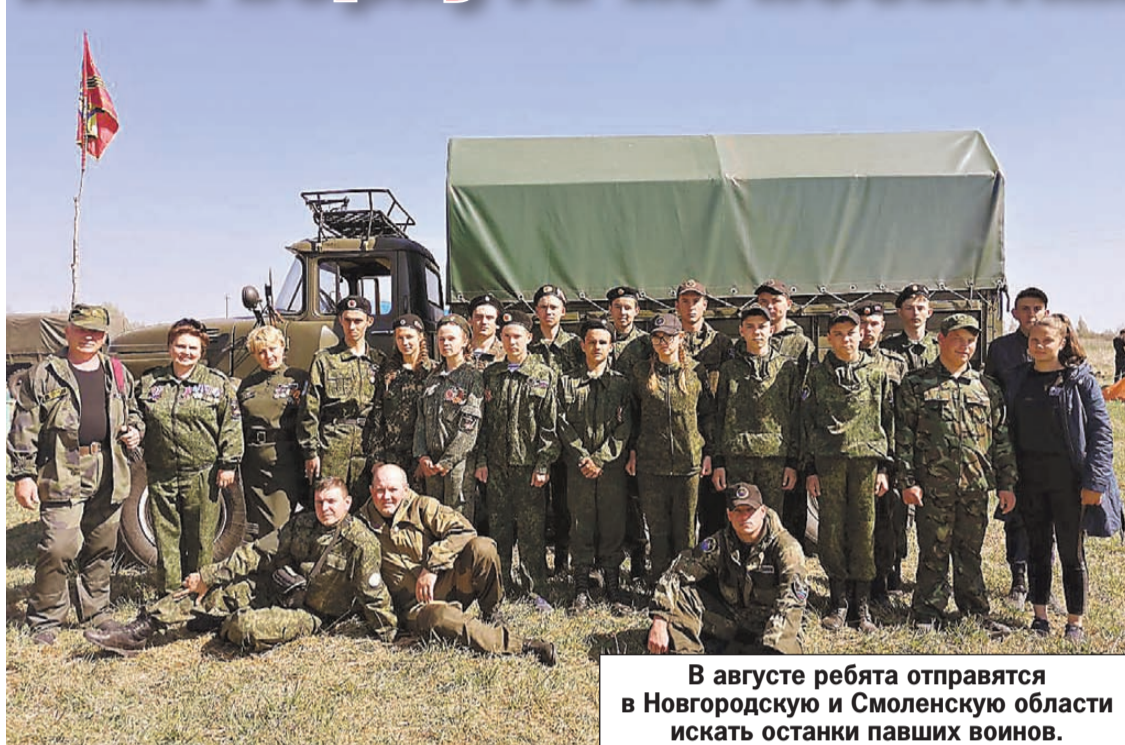
В августе ребята отправятся в Новгородскую и Смоленскую области искать останки павших воинов.