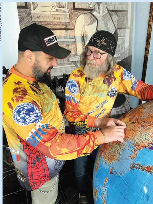
Все приготовления к поездке завершены.