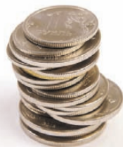
Иван МАКЕЕВ/ «КТ» - Москва

Автобус № 80 курсирует по маршруту: Областная больница - Студгородок - Ж/д вокзал - Аэропорт - ул. Пискунова - ул. Байкальская - Студгородок - Областная больница.