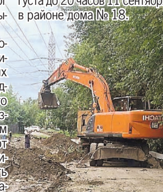
пресс-служба администрации Иркутска

сов 28 августа в районе дома № 3. А также с 8 часов 29 августа до 20 часов 11 сентября в районе дома № 18.