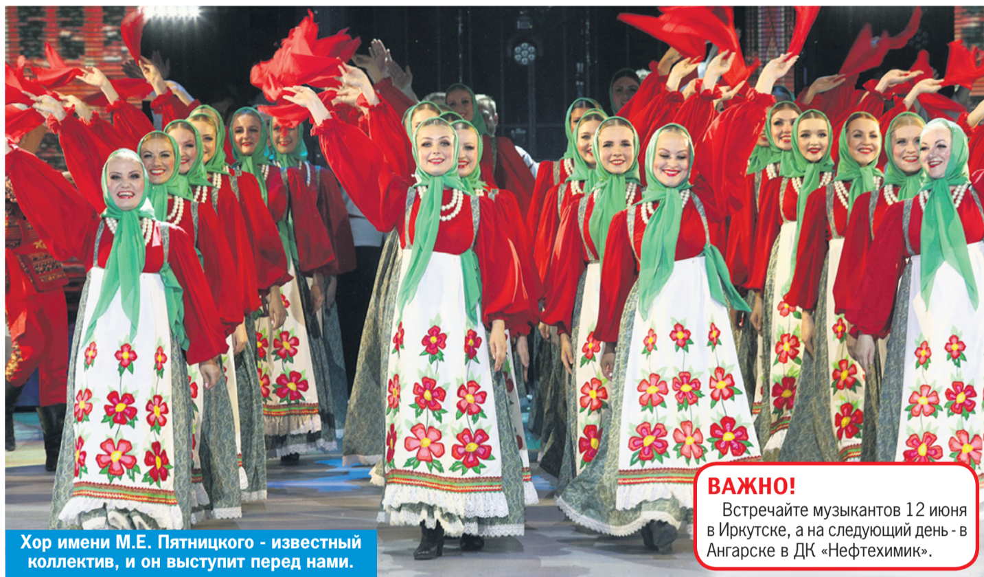
Хор имени М.Е. Пятницкого - известный коллектив, и он выступит перед нами.

Один из участников концерта - народный фольклорный ансамбль «Оберег» Иркутского областного Дома народного творчества. В его составе энтузиасты своего дела, влюбленные в русскую традиционную культуру. Все они, люди абсолютно разных профессий. Есть архитектор, дизайнер, бухгалтер, хореограф, менеджер, энер-