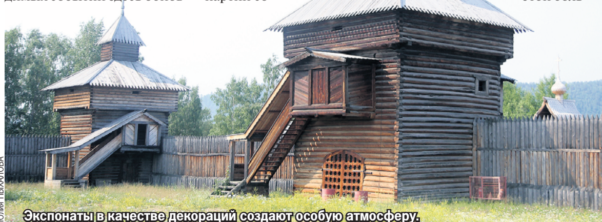
Экспонаты в качестве декораций создают особую атмосферу.

Первый фестиваль русской оперы состоялся в августе 2019 года, в рамках которого были исполнены увертюры к операм «Князь Игорь» и «Пиковая дама». В 2022-м зрителям были представлены три постановки великого русского композитора Николая Римского-Корсакова - «Царская невеста», «Моцарт и Сальери» и «Кощей бессмертный». В 2023 году отмечалось 150-летие со дня рождения Сергея Рахманинова. В честь этой даты в «Тальцах» показали постановку оперы «Алеко».