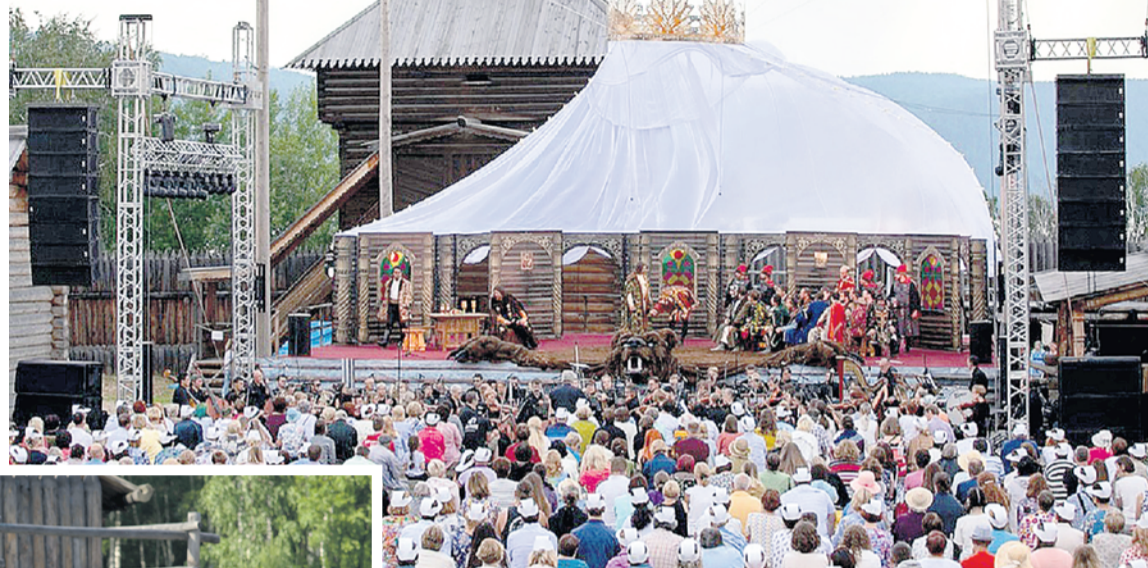
Правительство Иркутской области

Именно в оперном варианте «Евгения Онегина» ставил Иркутский музыкальный. Премьера состоялась в 2010-м. Был даже эксперимент на радость публике с приглашением на главные партии со-