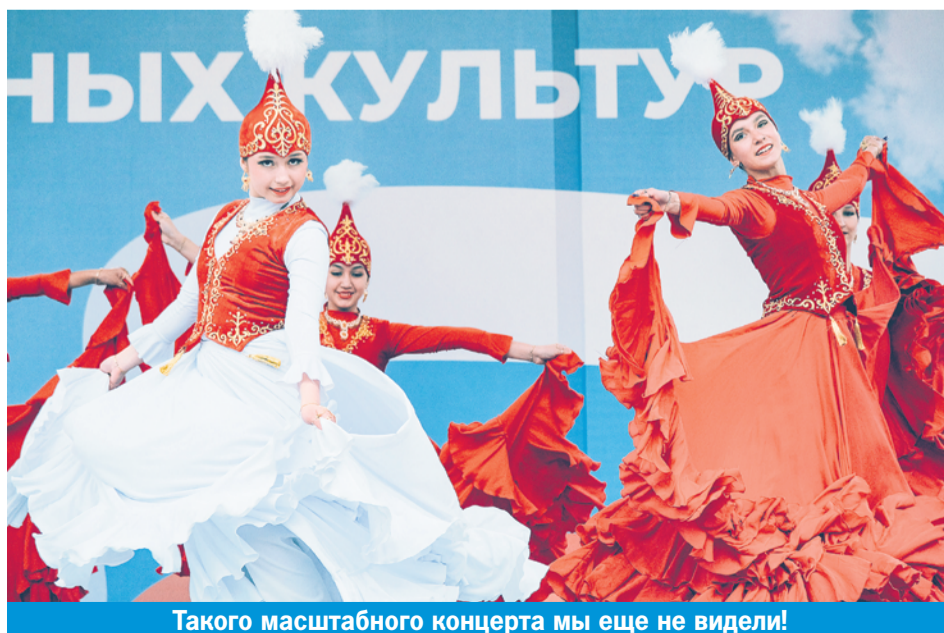
Такого масштабного концерта мы еще не видели!