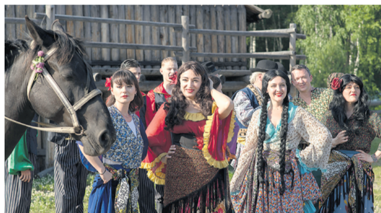
Лучше 1 раз увидеть, чем 100 раз услышать.

Этот год юбилейный для «солнца русской поэзии» - отмечается 225-летие со дня