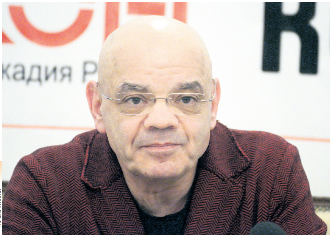
Константин Райкин сам выйдет на сцену.

«Спектакль своей жизни» - так художественный руководитель «Сатирикона» говорит о второй постановке, которую увидят иркутяне. В обновленную версию программы «Константин Райкин. Своим голосом» входят выбранные артистом стихи Александра Пушкина и Давида Самойлова, воспоминания и размышления о судьбе, об искусстве, о времени. В том, что нужно исполнять поэзию, знаменитого се-