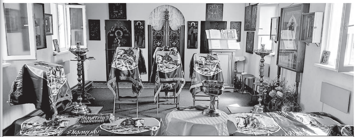
Освящение знамен в Августовском храме Санкт-Петербурга.