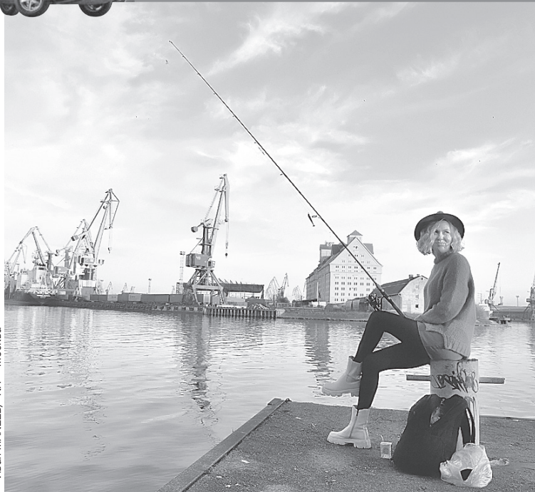
А еще в Калининграде вот такие романтичные рыбачки.

- Отметелят. И все на этом кончится, - зевнул один.