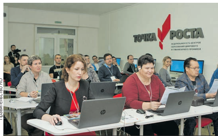
Учителя познакомились с основами дешифрирования космических снимков.

Это обучение стало продолжением курса повышения квалификации по направлению «Беспилотные авиационные системы», на котором педагоги тренировались управлять дронами. Теперь они научатся обрабатывать информацию, полученную на основе результатов