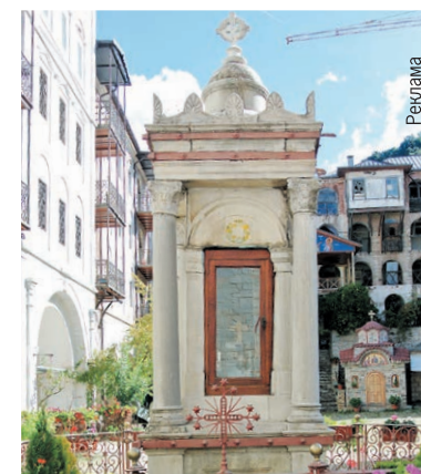
Памятник 26 зографским мученикам, сожженным католиками на территории Афонского монастыря.

Безусловно, большинство адекватных представителей духовенства поддерживают реализацию масштабного проекта. Комментируя действия отдельных личностей, священники напоминают о связях этих личностей с Ватиканом и папой Римским. И проводят недвусмысленную параллель, напоминая о том, что Ватикан и папа Римский еще со времен Византии и Александра Невского вели захватнические войны и крестовые походы на православие. Показателен пример преподобномучеников зографских, которые были сожжены римокатоликами за отказ принять унию и сослужить с ними. По преданиям, Богородица уже в то время называла их врагами сына своего - Иисуса Христа.