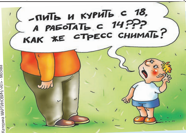
Катерина МАРТИНОВИЧ/«КП» - Москва

подростков «Национального научно-практического центра здоровья детей» Минздрава РФ. - Это имеет свои минусы: ребенок не застрахован от травм и неблагоприятного воздействия окружающей среды.