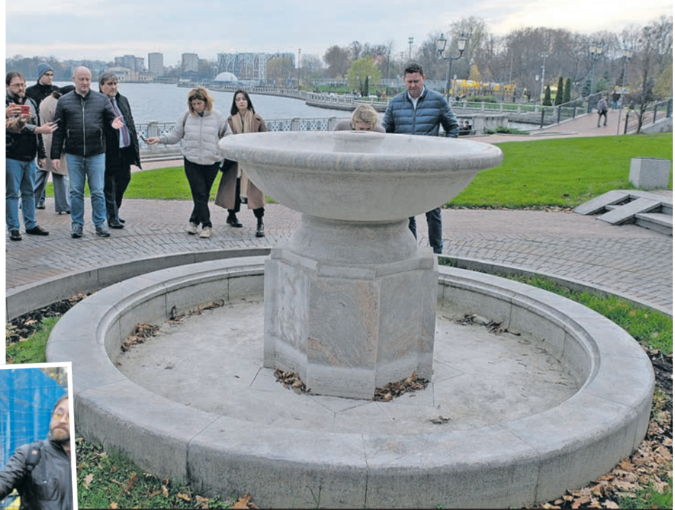
Вокруг фонтана «Тихий сквер» уберут кольцо травы, чтобы выливающаяся вода не разводила грязь.

- Заставить калининградцев ходить там, где им неудобно - невозможно. Надо просто внимательно наблюдать и обустраивать дорожки там, где