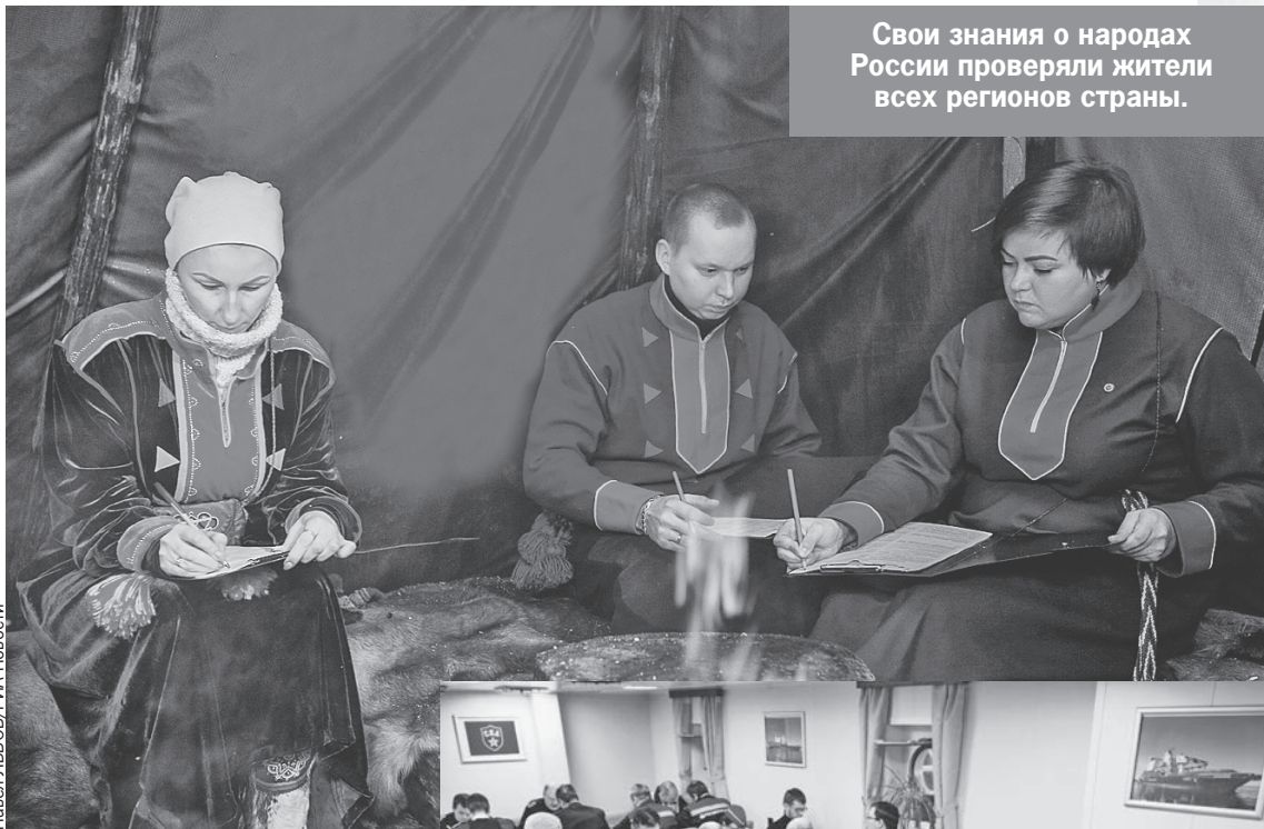
Свои знания о народах России проверяли жители всех регионов страны.

В Москве главной площадкой Этнодиктанта стал конгресс-холл Центра международной торговли, где в эти дни шли пленарные заседания и сессии форума «Народы России». Зал был полон. На