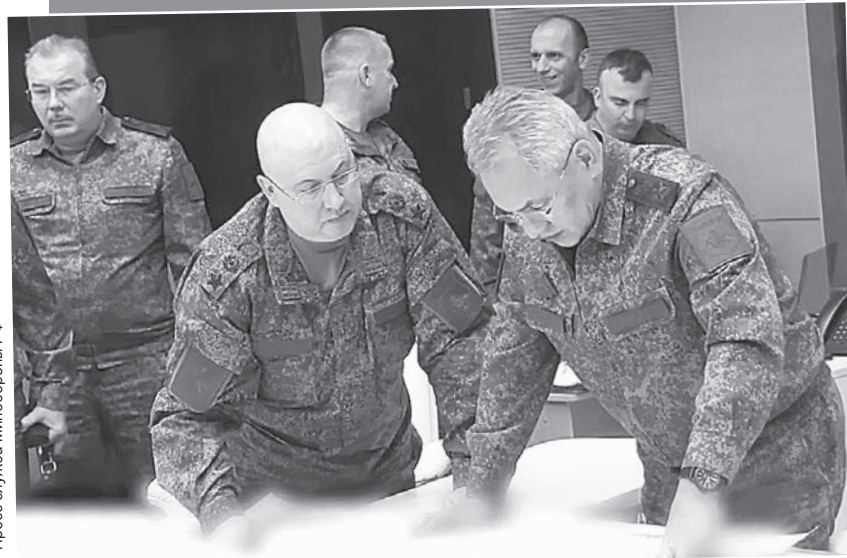
Пресс-служба Минобороны РФ

Суровикин отметил, что все желающие жители Хер-