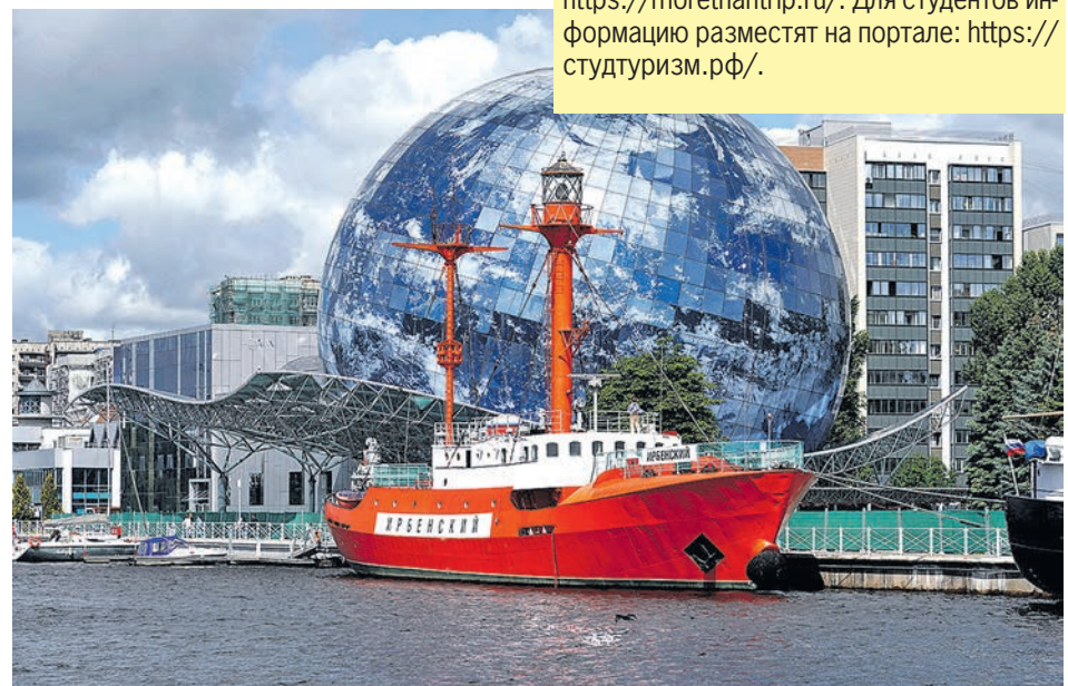
Участники программы научно-популярного туризма пройдут квест на территории Музея Мирового океана.

Помимо Калининградской области в десятку пилотных регионов, где россияне могут познакомиться с деятельностью отечественных исследователей и научной инфраструктурой, вошли Москва и Московская область, Санкт-Петербург, Краснодарский край, Амурская, Иркутская,