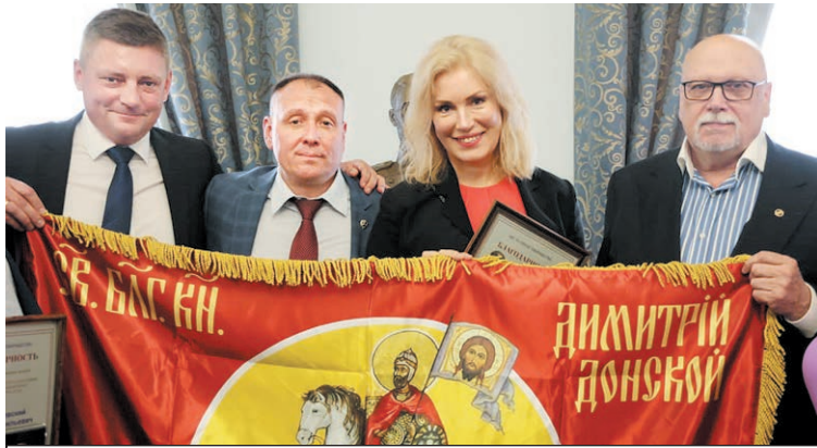
Отправку знамен осуществляют БФ «Под покровом Царицы Небесной» и «СИЛЬНАЯ РОССИЯ».