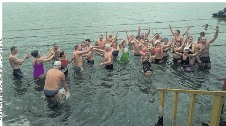
Калининградские моржи не только заражают здоровым образом жизни, но и следят за порядком на озере Шенфлиз.