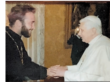
Контакты с Ватиканом должны быть только официальные.

К слову, малое освящение Успенского храма проводили монахи из Соловецкого монастыря. Они же отслужили там Божественную литургию на Успение Богородицы.