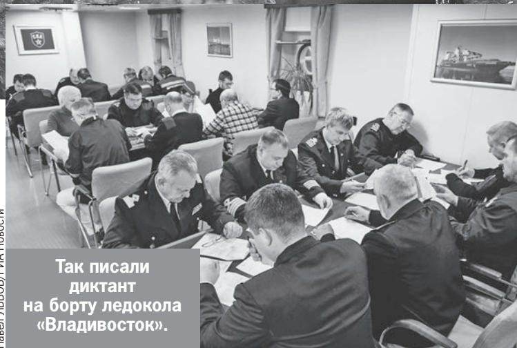
Так писали диктант на борту ледокола «Владивосток».

диктант приехали представители ФАДН России, Дома народов России, органов власти, национальных организаций, а также киберволонтеры из московской школы № 1363. Кстати, киберволонтерство - новый образовательный проект Дома народов России, поддержанный Федеральным агентством по делам национальностей. Ребята знакомят с национальной политикой, учат освещать проекты на национальную тематику, работать с социальными сетями, сайты, формировать интересные рубрики. Работа на форуме и диктанте стала их профессиональным крещением.