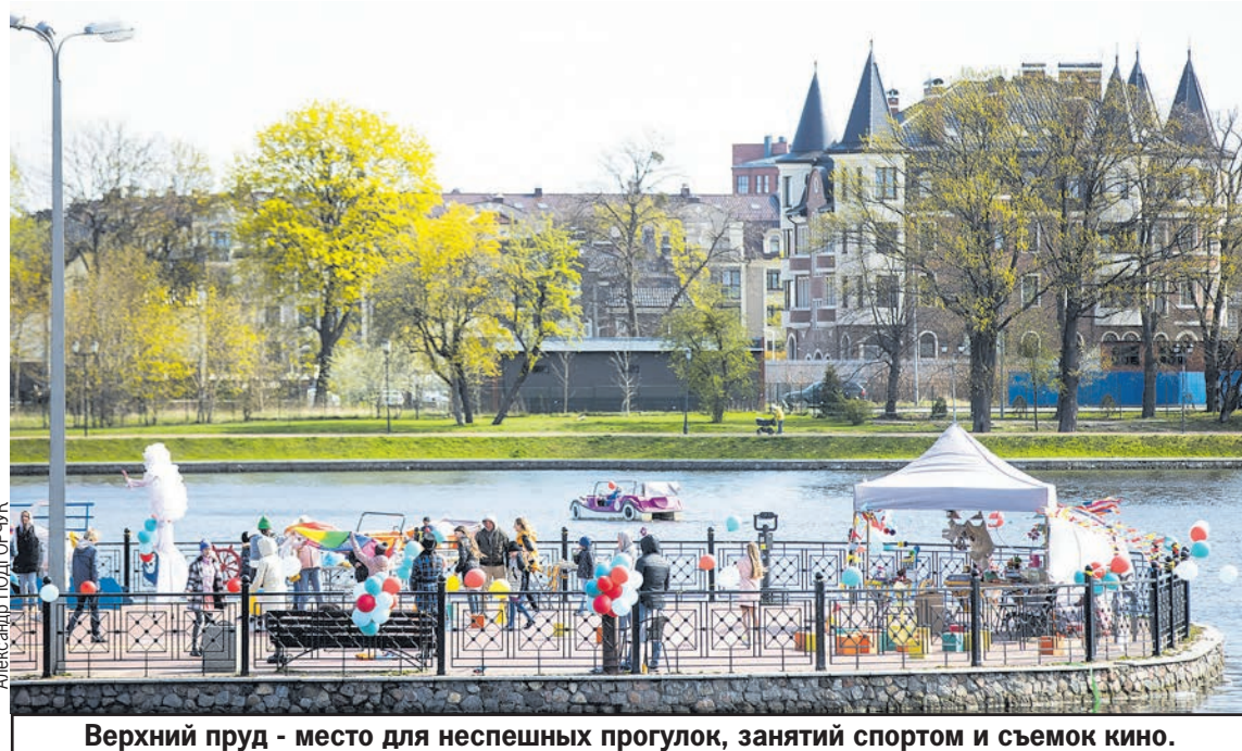
Верхний пруд - место для неспешных прогулок, занятий спортом и съемок кино.

Примерно к XIX веку, хотя, может, и раньше, Замковый пруд окончательно утрачивает свою изначальную, то есть «рыбную» функцию и приобретает другую. Территория вокруг пруда активно застраивается. Здесь, в частности, появляется «офис» главной в Кёнигсберге мasonicской ложи - «Три короны», а на другом берегу вырастает роскошная гостиница «Бельвю» (ее реплику в виде «ажурного» жилого комплекса мы можем видеть