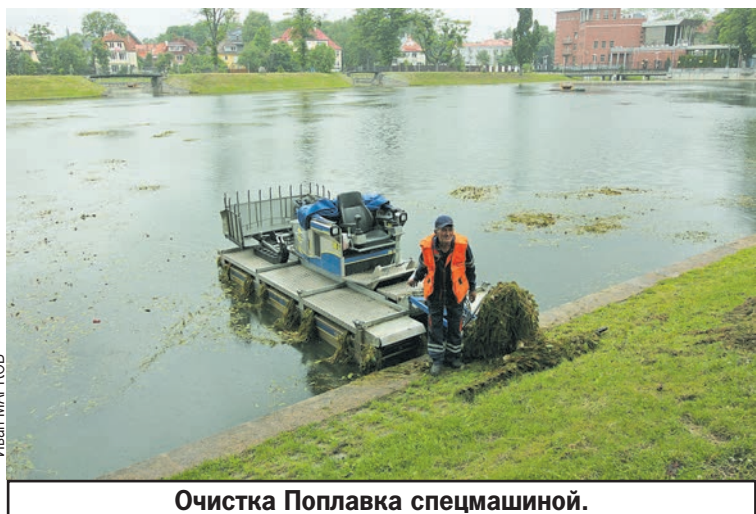
Очистка Поплавка спецмашиной.

Все изменилось, когда пришли они - «Янтарные моржи». Адепты здорового образа жизни взяли шефство над водоемом. В результате благодаря моржам Шенфлиз был очищен, на пляж завезен песок, в водоем выпущены мальки ценных пород: форели, толстолобика, карпа и других. Экосистема озера пришла в норму. И сегодня, если бы не случившийся периодически смог от проезжающих неподалеку вагонов с углем, цены бы не было этому Шенфлизу.