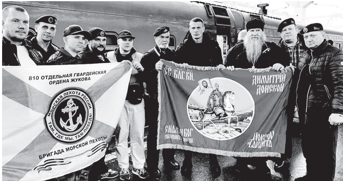
Передача знамени морским пехотинцам на Московском вокзале.

Любопытно, что с обратной стороны знамени будет образ Божией Матери «Умиление». Это Локотская икона, явленная в поселке Локоть Брянской области. Ее история заслуживает отдельного материала, а сейчас достаточно упомянуть, что именно здесь, в поселке Локоть, находилась усадьба Михаила Романова.