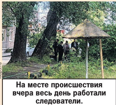
На месте происшествия вчера весь день работали следователи.

- Утром 24 июля в правоохранительные органы поступило сообщение о том, что во дворе одного из домов по улице Киевской в Калининграде жителями обнаружено тело новорожденного ребенка мужского пола. По