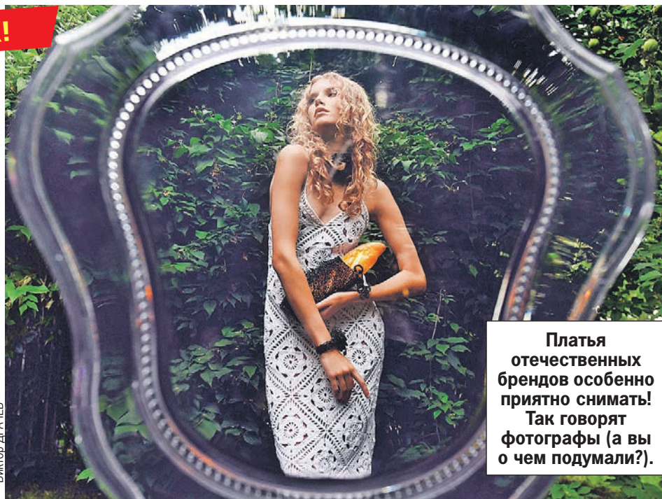
Платья отечественных брендов особенно приятно снимать! Так говорят фотографы (а вы о чем подумали?).