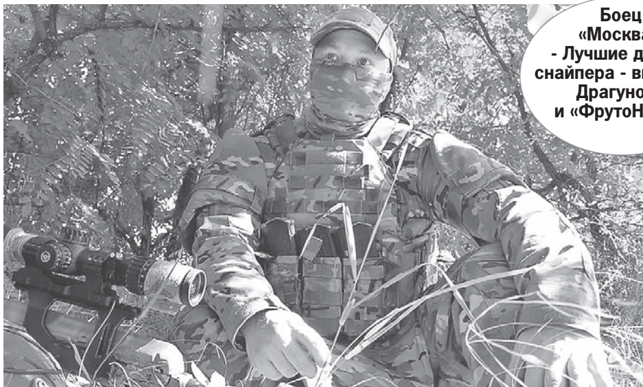
Боец «Москва»: - Лучшие друзья снайпера - винтовка Драгунова и «ФрутоНяня».

Когда я подъехал, снайпер с позывным «Москва» уже был с ног до головы в «упаковке». Судя по СВД (снайперская винтовка Драгунова. - Ред.), он собирался не на охоту. Для охоты у него другое устройство калибра 12,7 и длиной метра три. Я угадал: