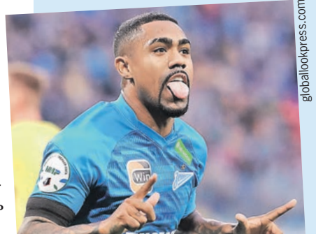
Малкому предложили трехлетний контракт с зарплатой 18 млн евро в год.

Кстати, эта сделка «Зенита» с саудитами войдет в топ-10 самых дорогих трансферов этого лета. Лидером списка является Деклан Райс , перешедший из «Вест Хэма Юнайтед» в «Арсенал» за 116 млн евро.