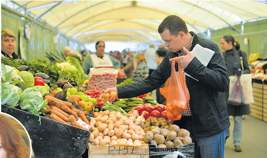
В последнее время отмечается растущий спрос на фермерскую продукцию.

Глава ведомства отметила, что рынок розничной торговли постоянно меняется.