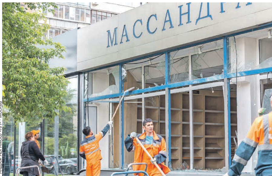
Бригады коммунальных служб приехали и устранили последствия ЧП.

Подробности, вся обновляемая информация - на KP.RU