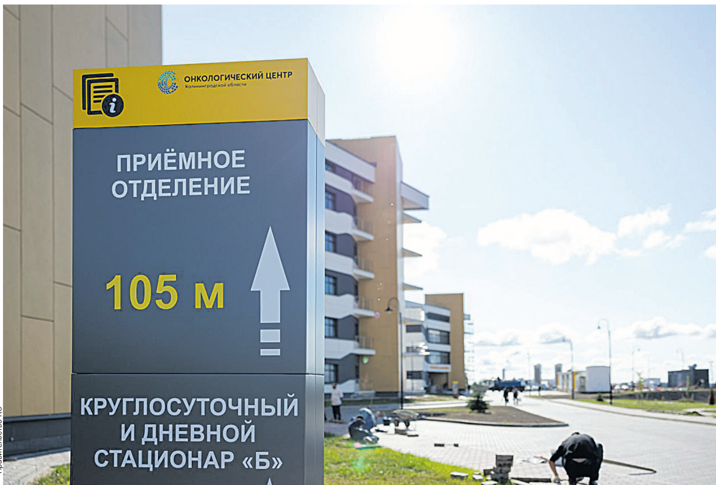
Глава региона отчитался: фасад здания завершен, лишь осталось 20 метров участков под козырьки.