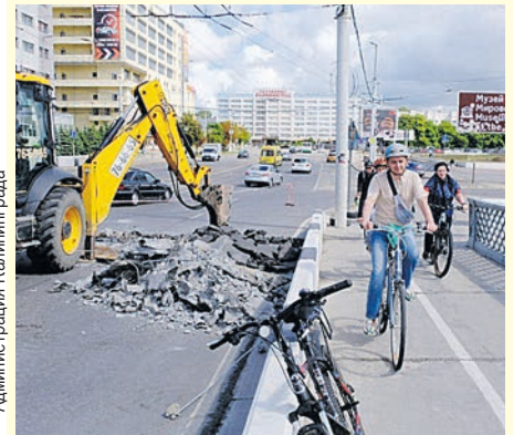
Маршрут от площади Победы до улицы Судостроительной оказался непростым.