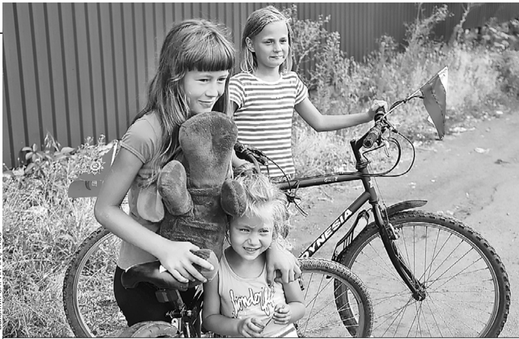
А это дети Мариуполя. Весной здесь гремели бои, а теперь лето и почти Россия.

- Ты можешь сравнить противника в 2014-м и в 2022-м. Что изменилось?