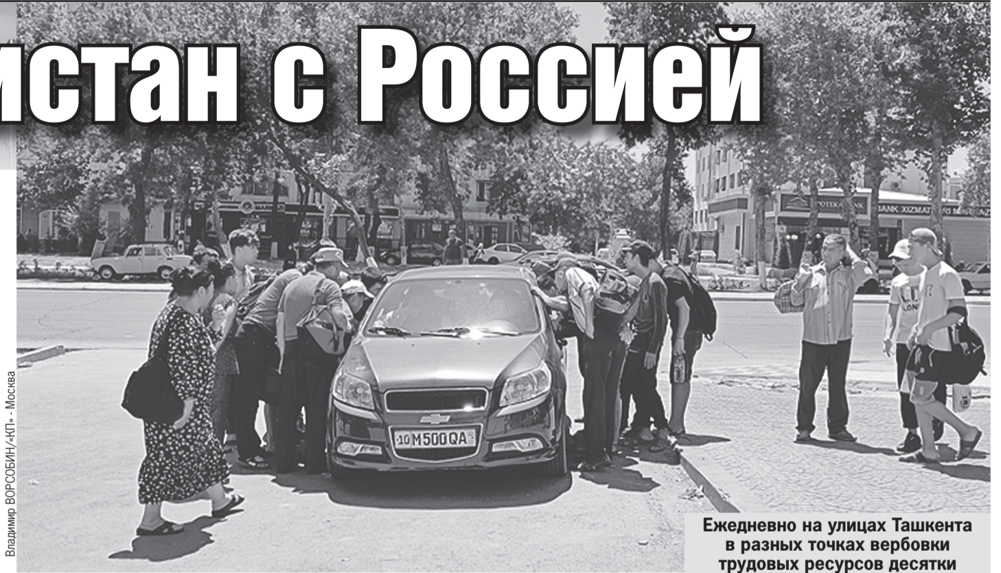
Владимир ВОРСОВИН/«КП» - Москва