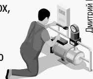
Дмитрий ПОЛУХИН/Комсомольская правда