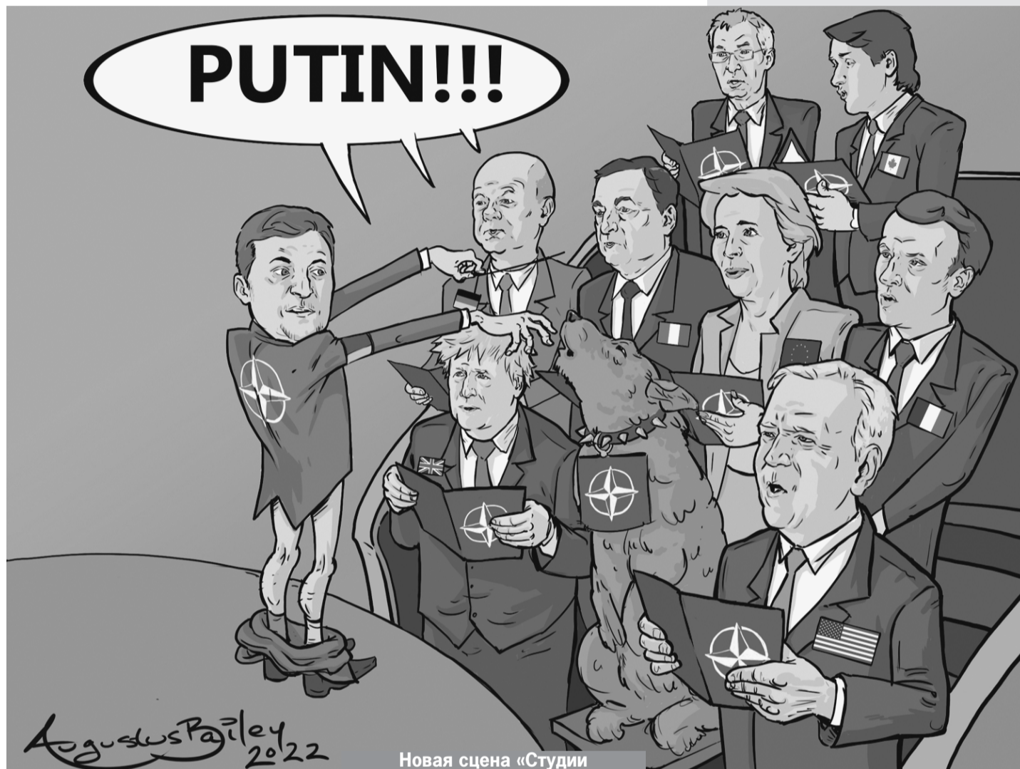
Новая сцена «Студии Квартал-95».

- Украина - последняя катастрофа тех, кто втянул нас в эту трясиину, когда они заявили, что США должны доминировать в мире и противостоять растущим региональным державам, которые могут когда-нибудь бросить вызов глобальному или региональному превосходству США.