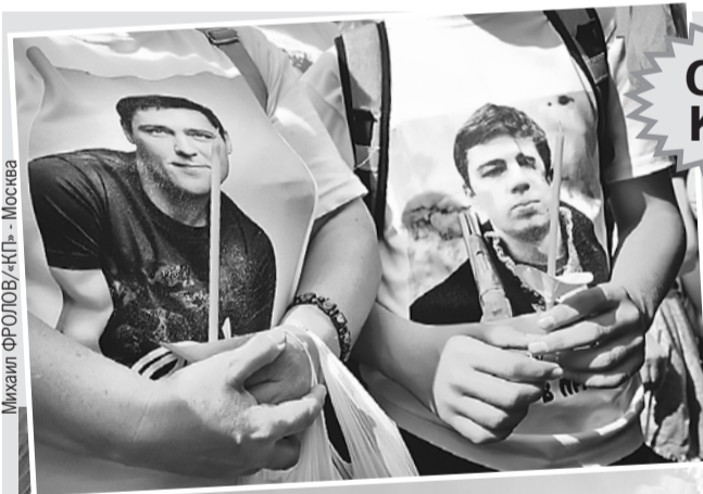
Михаил ФРОЛОВ/«КП» - Москва

Вчера в Москве на Троекуровском кладбище поклонники Юрия Шатунова отметили печальную дату - 40 дней с момента ухода кумира. Пришедшие, среди которых, кстати, были и фанаты других безвременно ушедших артистов, организовали красивый ритуал: в небо одновременно выпустили 10 белых голубей со словами «Царствие небесное новопреставленному Георгию» (именно под таким именем был крещен Шатунов).