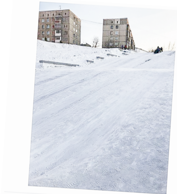
Нравится 273 Поделиться 3 Ещё 39 комментариев

Впрочем, меньше чем через сутки горка вновь стала лестницей: об этом позаботились сотрудники кемеровской Госавтоинспекции и «Зелен-