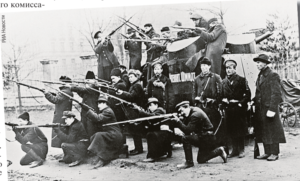
Большевики не планировали никаких карательных органов. Они считали, что оборону от внешних врагов и борьбу с внутренними будут вести вооруженные рабочие. На фото - боевая дружина Путиловского завода.

А контрразведку ВЧК Дзержинскому удалось создать только с четвертой попытки.