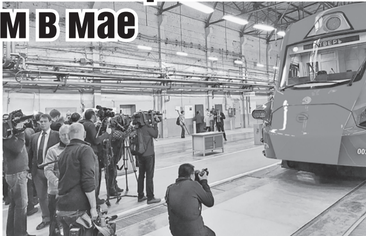
Увидев такую толпу иностранных акул пера и микрофона, на Тверском вагонзаводе, похоже, удивились: они что, нашу «Иволгу» (поезд на фото) с космической ракетой перепутали?

- Посмотрел вашу новую продукцию - супер! Просто класс! - сказал он рабочим вагонзавода. - Лучшее мирового уровня! И вас это