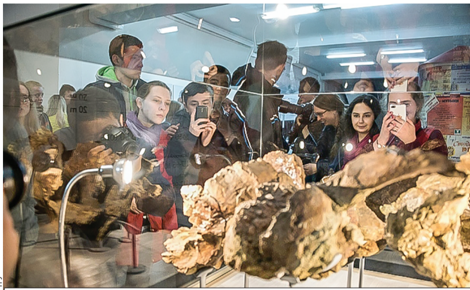
Шестаковский динозавр был настоящим гигантом, он мог достигать в длину 20 метров и весить 50 тонн.