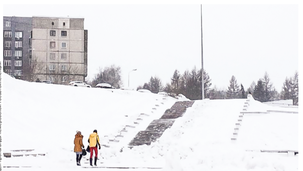
Такой лестница стала после того, как ее почистили от снега и наледи.

К слову, глава города Илья Середюк также отреагировал на обращение горожан и поручил контролировать состояние этого участка территориальному управлению Центрального района.