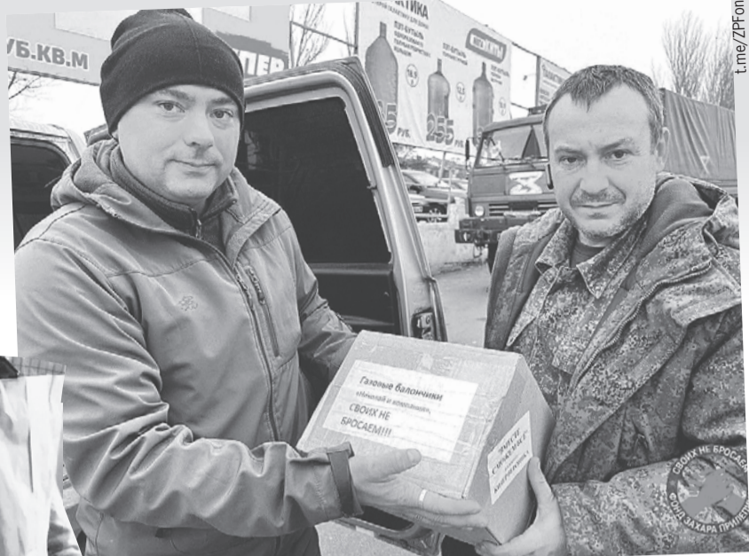
Гуманитарка из фонда Прилепина идет, конечно, не только на фронт. Но и простым жителям Донбасса.