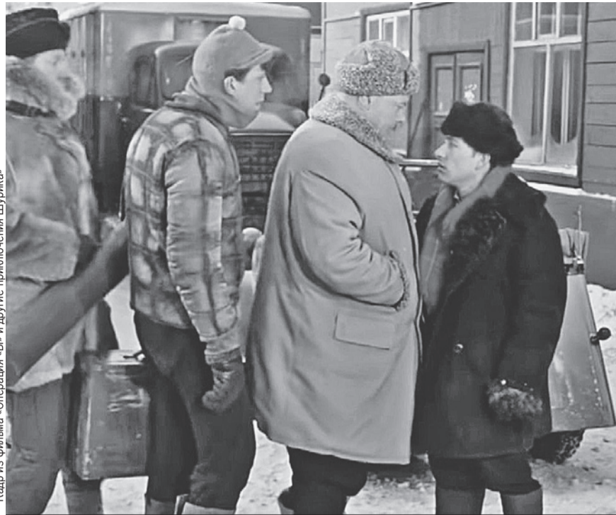
Кадр из фильма «Операция «Б» и другие приключения Шурика»

Мнение эксперта: «На последний вопрос ответ прост - бояться народного гнева. Такие предложения тоже были, но правительство их завернуло. Сработает ли история с наказанием за повторное нарушение? Вероятно. Но стимулировать людей надо не только штрафами. Надо снижать тарифы по ОСАГО и пересматривать систему выплат».