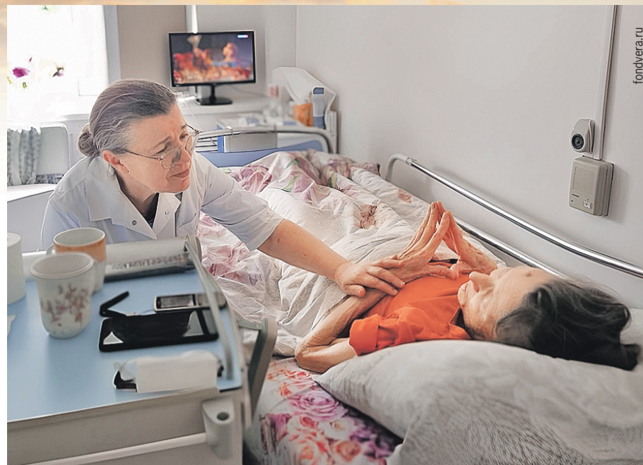
В Москве НЕТ платной паллиативной помощи - об этом напоминают те настоящие врачи, кто облегчает последние дни безнадежно больных.

- Да. Это сильно повлияло на репутацию клиники, в мой адрес поступали угрозы. А юрист одного из сайтов предложила составить претензию. Оказалось, чтобы затянуть процесс - к моменту подачи претензии там сменили название и юрист прекратил общение со мной. Отзывы удалили. Но мне до сих пор звонят пострадавшие.