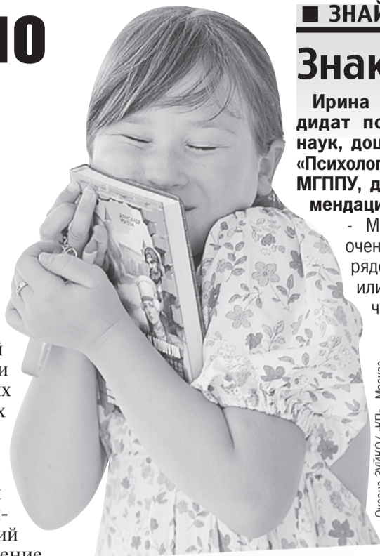
Оксана ЗИЙКО / «КП» - Москва

- Совместное чтение книг укрепит отношения с ребенком и будет способствовать развитию мозга вашего малыша, - считает врач. - Плюс это заложит в ребенке основу для здорового социально-эмоционального, познавательного и языкового развития, сделает задел для обучения в школе.