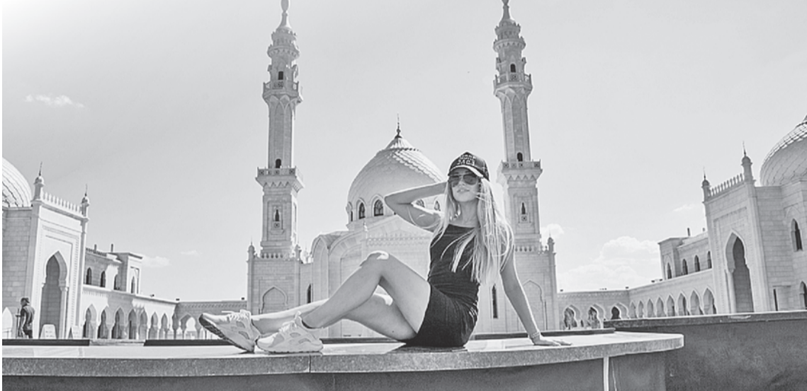
А еще говорят, что раскованные девушки в мини-юбках только у христианских храмов делают селфи, - нет, прогресс не стоит на месте!