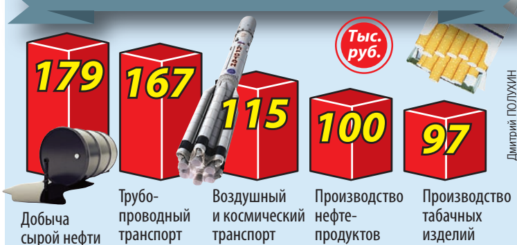
Данные Росстата, средняя зарплата за май 2018 г.