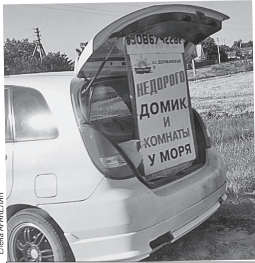
Приличных баз отдыха мало - процветает частный сектор.

- Не только в Турции дешевле, но и в Болгарии, Грузии, Черногории, - констатирует сам хозяин. - А что делать? Коммуникаций нет, - перечисляет затраты бизнесмен. - Электричество хреновое, приборы постоянно горят. Вода - с перебоями. Канализацию надо делать самим. Холдильники, кондиционеры, плиты - держим свои ремонтные бригады, из гарантийного ремонта в Краснодаре к нам за 270 км никто ехать не хочет. Еще нас постоянно проверяют. Пытались вот оштрафовать на 200 тысяч за несогласованное нахождение в 500-метровой зоне от моря объектов, которые вообще-то были