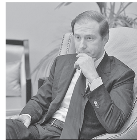
Денис Мантуров знает, как поддержать нашего производителя.

года - уже 11,5%, а в I полугодии 2018-го - 9,4%.