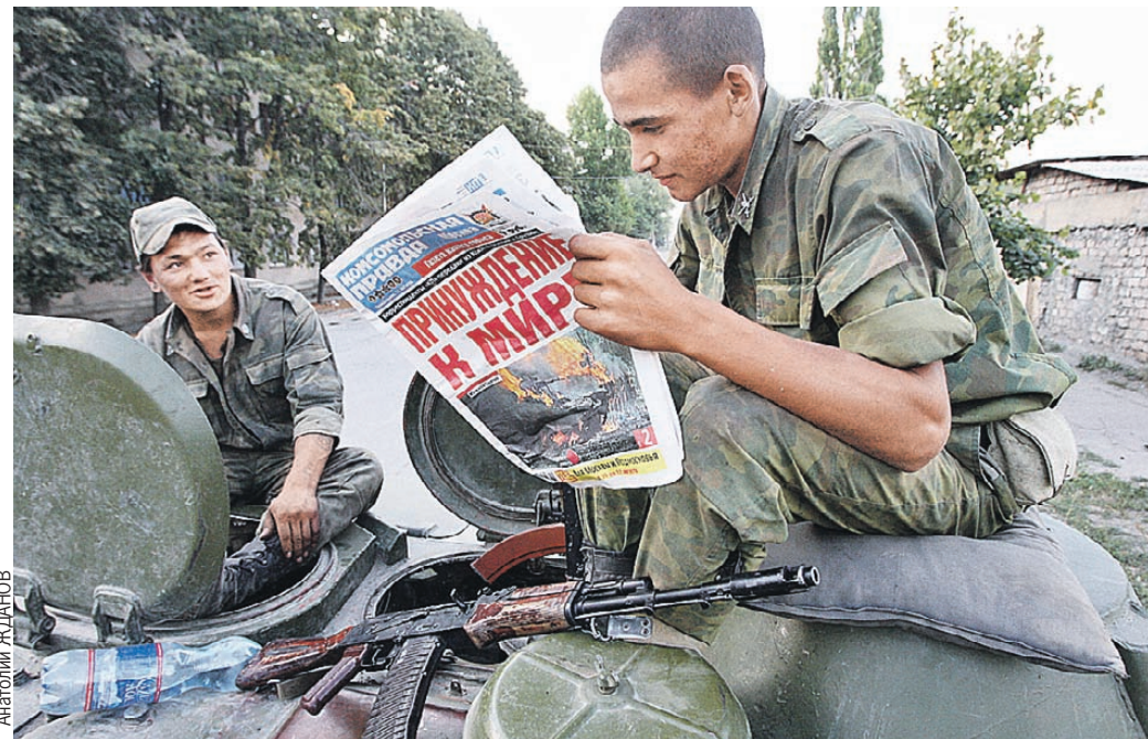
Август 2008-го, Цхинвал. Бойцы читают репортажи военкоров «КП», которые в те дни работали по обе стороны фронта.

А о том, какая доза алкоголя стимулирует творчество, - на > стр. 12.