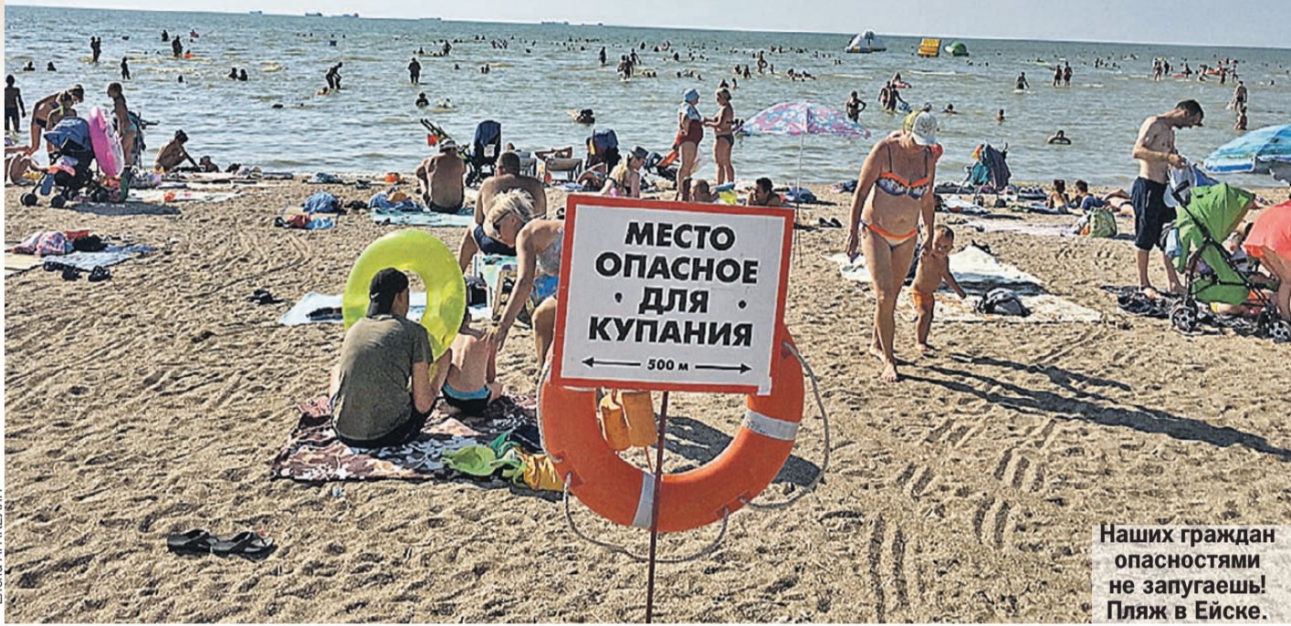
Наших граждан опасностями не запугаешь! Пляж в Ейске.

С десяток «живых» баз, в основном оставшихся с советских времен, первым делом знакомят с расценками на парковку: 100 - 200 руб. Заранее изучила условия местного отдыха: услуги - «умывальник, холодильник и мебель в номере». Зато всего от 800 руб. за ночь. В паре современных баз, где удобства не совковые, цены в июле начинались от 3500 руб. за двухместный номер. Парковка - 300 руб. за ночь (буржуйский вариант, когда гостям отеля стоянка предоставляется бесплатно, явно не наш путь).