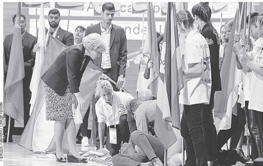
Ольга Голодец (на фото - слева) одной из первых бросилась помогать упавшей девушке.

Отметим, что у Голодец нет медицинского образования. Она кандидат экономических наук.