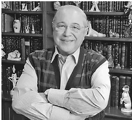
Похоже, что за пятнадцать лет, в которые 72-летнего Евгения Петросяна и 65-летнюю Елену Степаненко связывало лишь творчество, они оба нашли замену друг другу в личной жизни.

риканская система правосудия, где порядок раздела имущества зависит от того, по чьей вине брак распался. Здесь иск достаточно сухой, формальный.