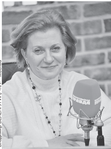
Анна Попова на Радио «Комсомольская правда» (fm.kp.ru).