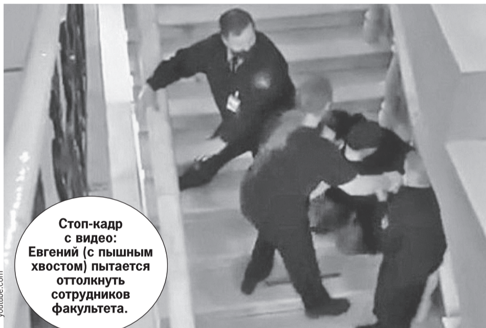
Стоп-кадр с видео: Евгений (с пышным хвостом) пытается оттолкнуть сотрудников факультета.