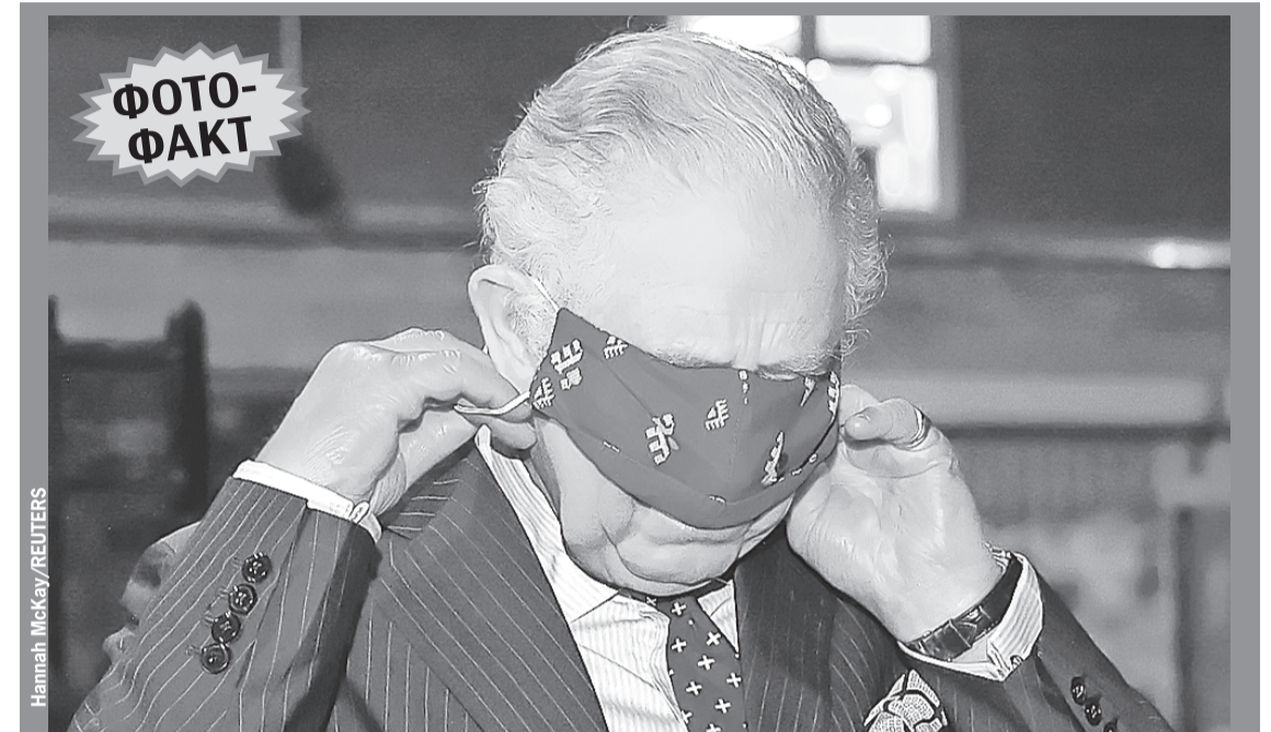
Вам, конечно, трудно будет сразу узнать этого человека. Без подсказки тут не обойтись. Это британский принц Чарльз, надевающий стильную антивирусную маску перед посещением центра вакцинации против COVID-19 в Лондоне. В Великобритании сейчас пик заболевания коронавирусом.

- Это российские граждане, которые по собственной инициативе отправились отдыхать в ЮАР. Там их и застало сообщение, что Южно-Африканская Респуб-