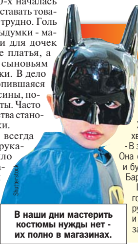
В наши дни мастерить костюмы нужды нет - их полно в магазинах.

Перечислять категории новых костюмов к 2020-м годам стало трудно, праздничные одежки охватили русские и зарубежные мультики, русский фольклор и сказки. Впрочем, без старых добрых снежинок и зайчиков праздники не обходятся до сих пор.