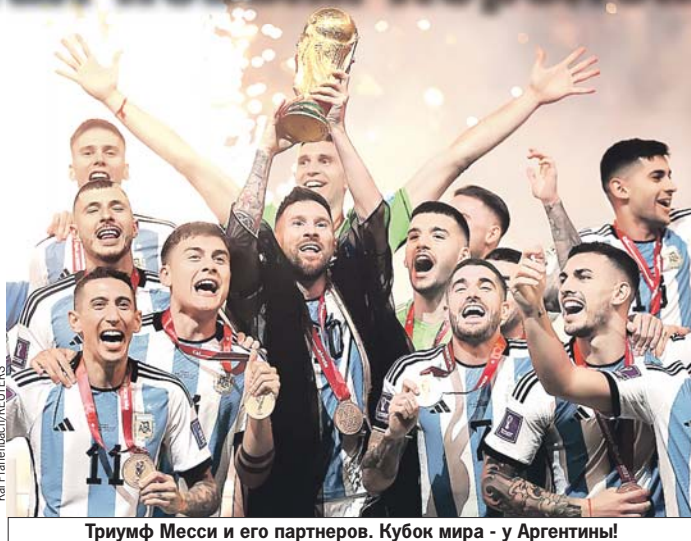
Триумф Месси и его партнеров. Кубок мира - у Аргентины!

Почти всегда он был лучшим. Он забивал самые важные голы и раздавал гениальные передачи. Он рычал на голландцев и утешал проигравшего хорвата Модрича. К финалу Лионель подошел феноменальным результатом - 5 голов, 3 голевых паса, самое большое количество передач под удар, самое большое количество ударов. Именно так и надо сражаться за свою мечту.