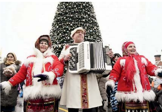
В Казани главные мероприятия пройдут на двух площадках.

желающих откроются аттракционы: «Крестики-нолики», «Точный гол», «Дартс-мяч», «Баскетбол», «Гигантский боулинг», – а также площадки для активностей «Лабиринт» и «Лазертаг».