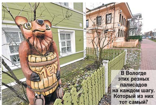
В Вологде этих резных палисадов на каждом шагу. Который из них тот самый?

Зател, дескать, государь сделать Вологду столицей России, да купцы местные сообразили - невыгодно. Логика известная - придут москвичи, отожмут бизнес. И устроили вологодские царю, как сейчас сказали бы, теракт. В строящемся храме