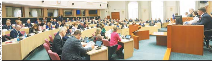
Бурные дискуссии в областном парламенте шли весь год.

Закон дал возможность выдавать жилищные сертификаты детям-сиротам и детям, оставшимся без попечения родителей старше 23 лет. По сертификату можно купить жилье в любом городе или селе, можно использовать также собственные средства и мат-