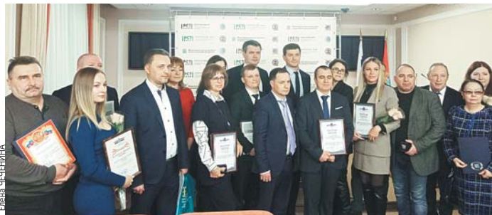
Товары и услуги предприятий Самарской области уже 25 лет входят в число лучших в России.

Наш регион - один из самых промышленно развитых и мощных индустриальных центров. Самарская об-