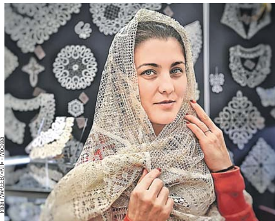
Главный плюс автостопа через всю страну - в каждом городе можно обзавестись сувениром. В Вологде - кружева. Теплые, красивые.