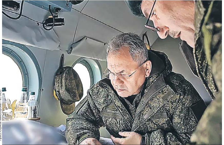
Сергей Шойгу облетел группировку войск в районах проведения СВО, проверив передовые позиции российских подразделений.

Минобороны подчеркнуло, что самое пристальное внимание главы военного ведомства России во время этой инспекции было уделено всестороннему обеспечению военной группировки. Сергей Кужугетович смог увидеть, в каких условиях несет службу личный состав, участвующий в боях. Министр увидел, насколько обеспечены бойцы всем необходимым. И насколько отлажена работа медицинской помощи и тыловых подразделений. И сделал соответствующие выводы.