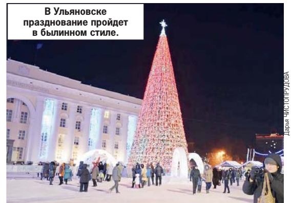
В Ульяновске празднование пройдет в былинном стиле.

Подготовили: Юлия ВАСИЛИШИНА («КП» - Нижний Новгород), Васса РАССАДИНА («КП» - Ульяновск), Алена ОБЧИННИКОВА («КП» - Пермь).