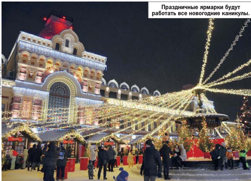
Праздничные ярмарки будут работать все новогодние каникулы.