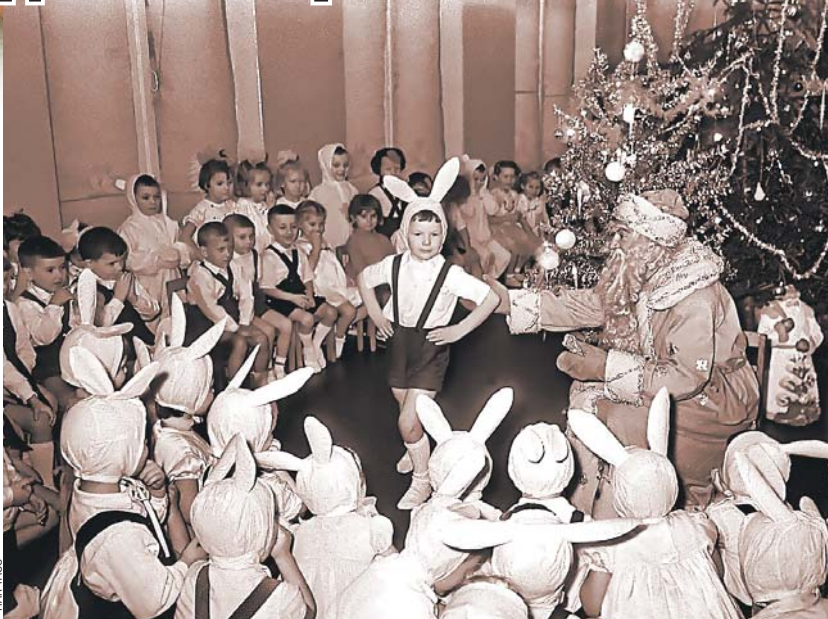
Мальчики-зайчики и девочки-снежинки - неизменная классика детской новогодней моды.

- Я ходил в садик в начале 60-х. Был в семье единственным ребенком, а вокруг меня тогда были родители, бабушки, прабабушка. Конечно, им всегда хотелось сделать для меня лучший праздник, поэтому они мастерили костюмы сами. Когда я в садик ходил, мой костюм позволил мне встать на табуретку и спеть Деду Морозу песню: «Я Петрушка маленький, малень-