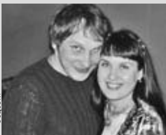
Киллер в бегах женился, завел детишек - тут-то его и вычислили.