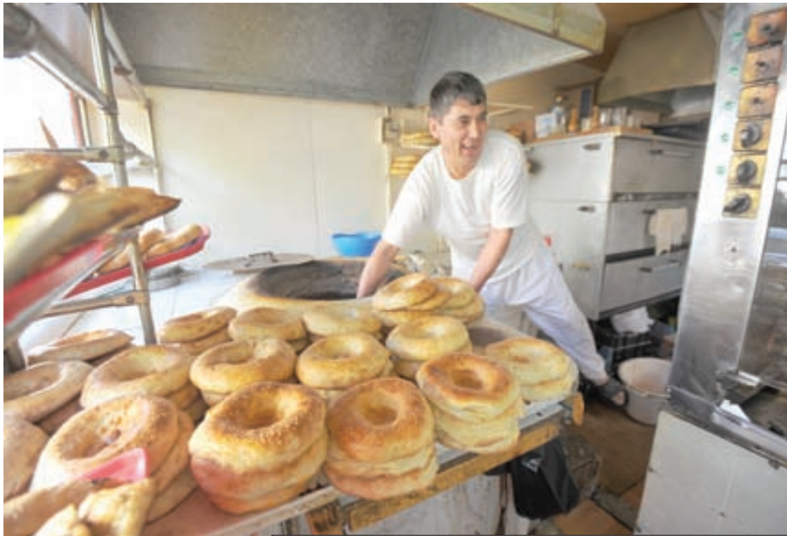
Предприятий малого и среднего бизнеса в Саратовской области огромное количество.

ятия приоритетные функции и регистрируют их как отдельные фирмы. При этом государство выступает лишь в роли арбитра, защищая законные права и интересы всех участников рынка. Вот к такой модели мы стремимся.