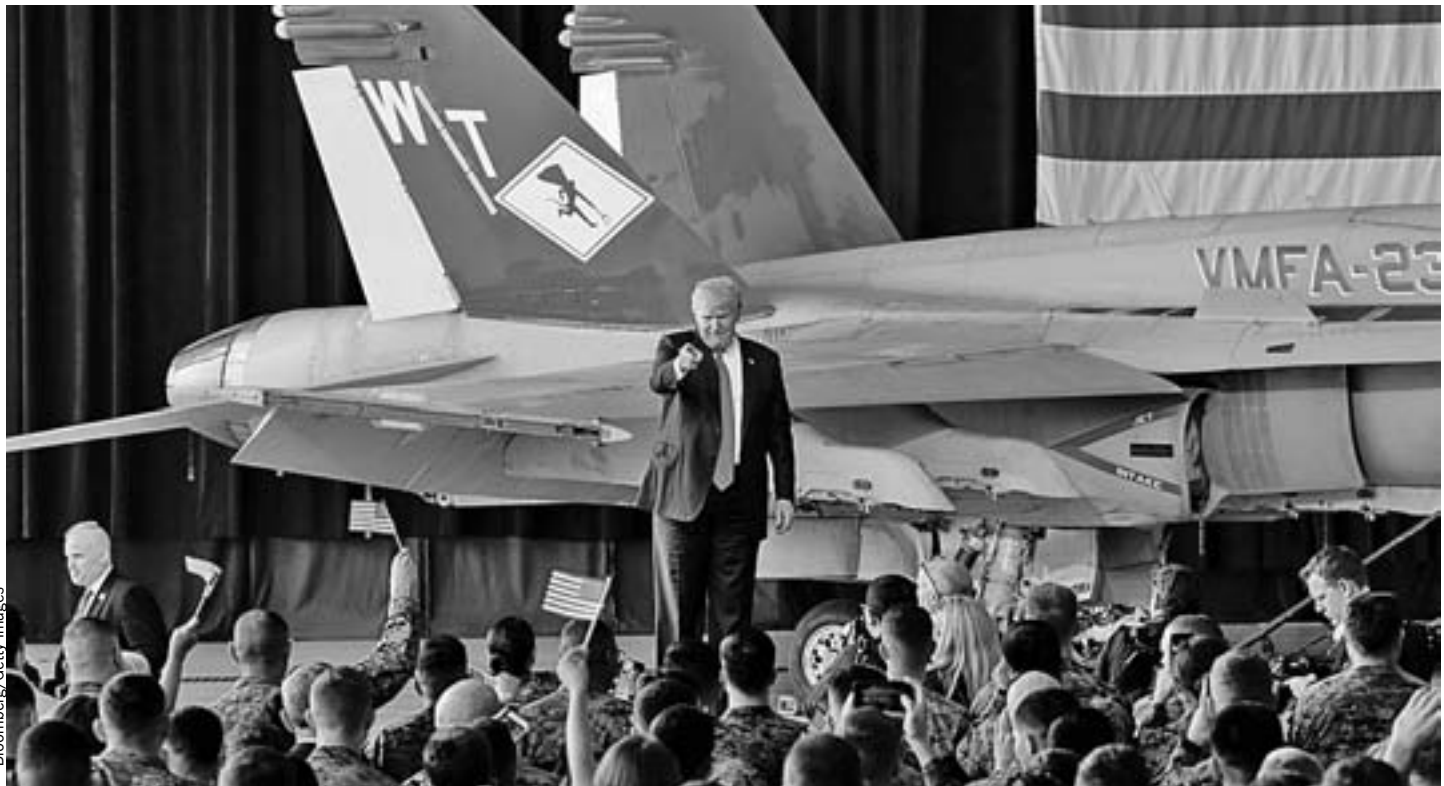
Президент Америки Дональд Трамп превратил утверждение военного бюджета страны в настоящее шоу. Важнейший документ страны он подписал на базе ВВС под рукопожатия военных. Это будут рекордные траты на войну. Зачем?

На военную помощь Украине заложено $250 млн. (против нынешних 200