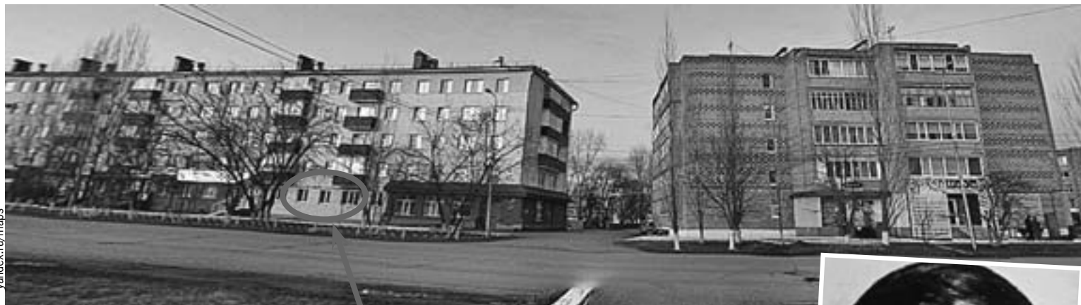
В квартире на первом этаже этой хрущевки и скрывался беглец.