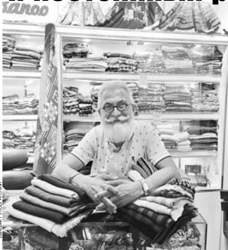
Фото сделано на одном из рынков Тегерана. Главный базар столицы Ирана две недели назад был закрыт из-за постоянного роста цен. Но маленькие базарчики вполне себе хорошо работали.

Банковская система Ирана - замкнутый круг. Есть банкоматы, отделения банков, пластиковые карточки, терминалы в магазинах, которые их принимают. То есть в магазине ты спокойно можешь расплачиваться картой - но только иранской. Пластиком