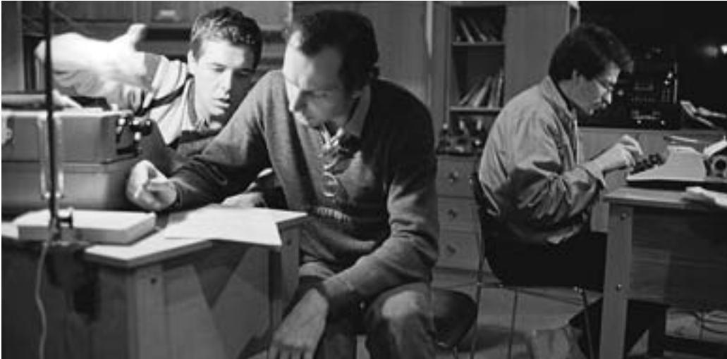
Дмитрий Захаров (в центре) работал с Владом Листьевым (справа) в перестроечной программе «Взгляд». Слева на фото - еще один взглядовец, Александр Любимов.