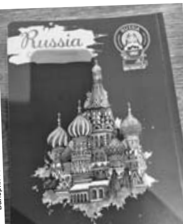
В Тегеране очень хорошо относятся к России. В центре города даже есть кафе имени нашей страны.

На госуровне Ирана такие операции тоже под запретом Запада - повелителем долла-