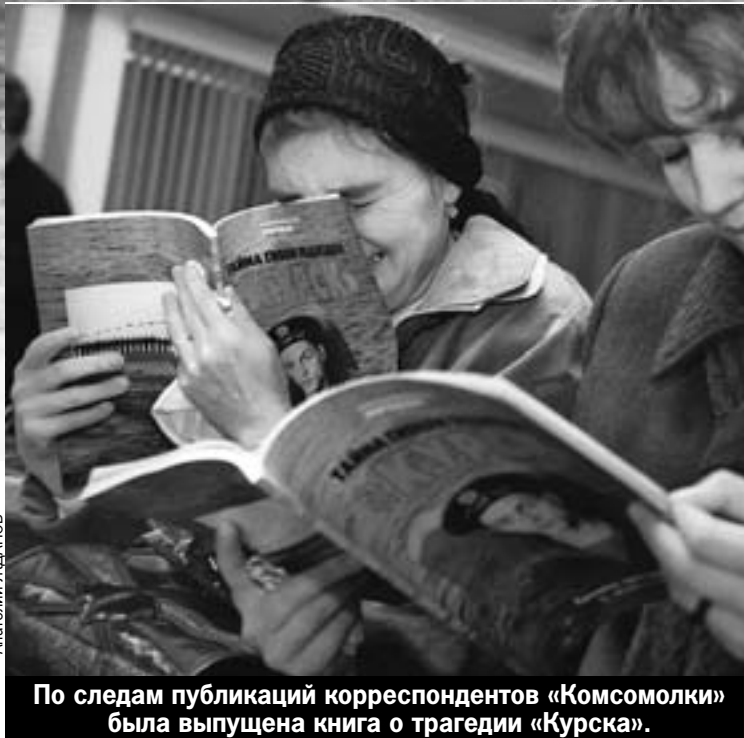
По следам публикаций корреспондентов «Комсомолки» была выпущена книга о трагедии «Курска».