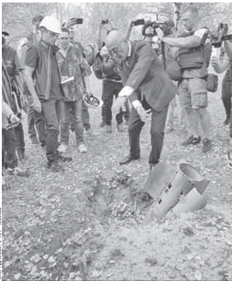
Глава МАГАТЭ Рафаэль Гросси (на фото слева в белой каске) и представитель «Росатома» Ренат Карчаа (в центре) рассматривают остатки украинской ракеты.

Зато нам показали результаты обстрелов. Первое попадание ракеты пришлось совсем недалеко от проходной. В земляном валу около хранилища какого-то технического масла осталась здоровая воронка. Водопроводные трубы рядом, идущие в сторону первого реактора (всего их на Запорожской АЭС шесть), порядком посколо. Основные повреждения уже починили, но вода продолжает подтекать до сих пор. Окна в соседнем корпусе просто повыбивало.