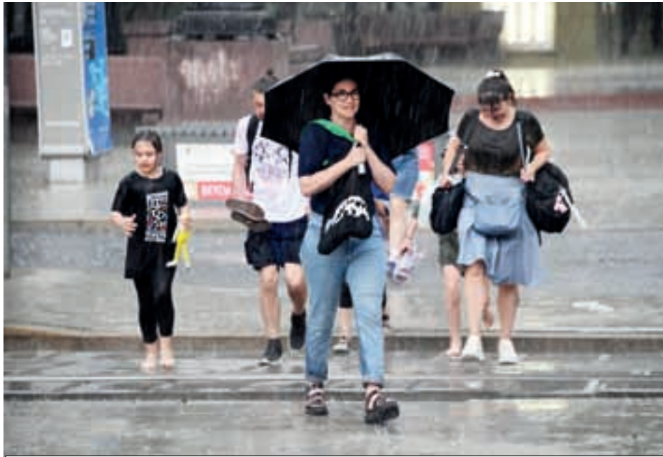
Погода в ближайшее время будет осенней: дожди и ветер.