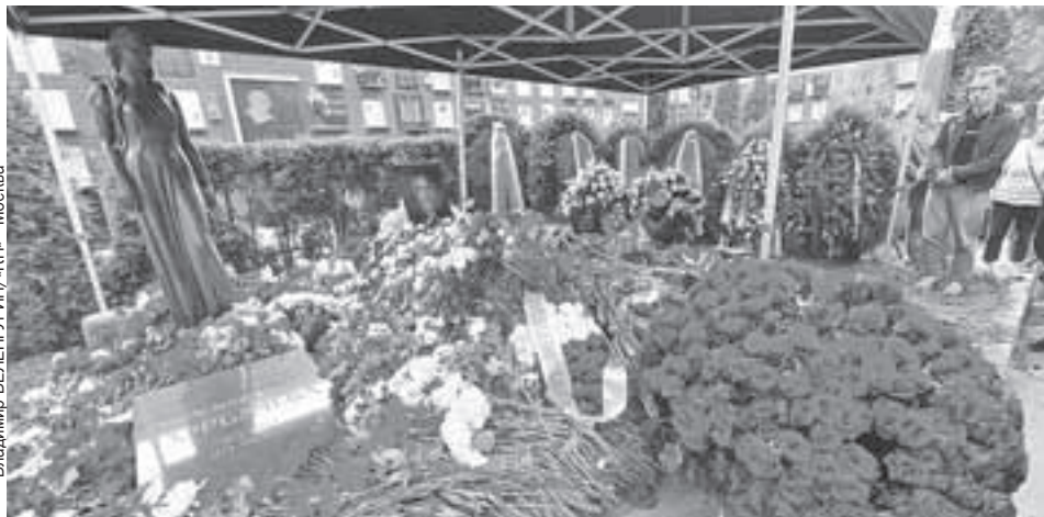
Михаила Горбачева похоронили рядом с женой, слева - памятник ей.