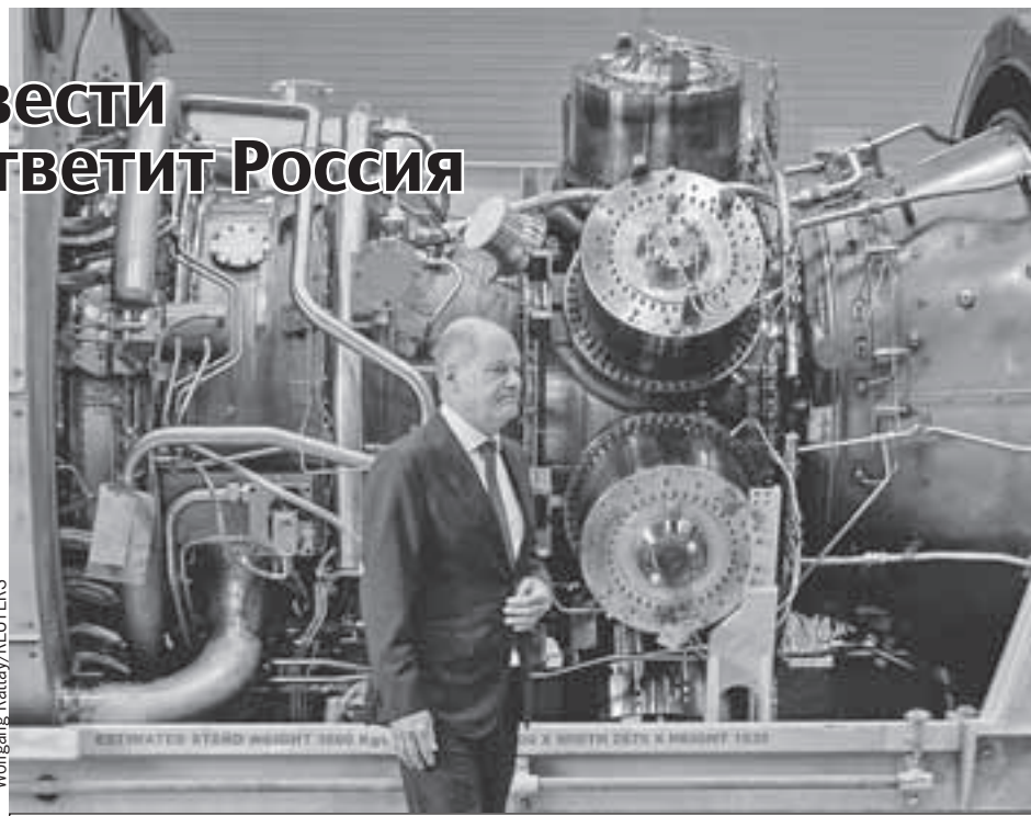
Канцлер Германии Олаф Шольц на фоне одной из тех турбин, которые должны были обеспечить подачу газа по «Северному потоку».

Наиболее вероятный ответ России, который озвучил вице-премьер Александр Новак : Россия откажется продавать нефть тем, кто потребует ограничения цены. Это приведет к тому, что страны из зоны влияния «большой семерки» просто не получат нефть. Хотя для России это тоже может стать болезненным ударом, ведь значительную часть доходов страны составляют средства от продажи черного золота. Но если Россия не будет продавать нефть и ее станет на рынке меньше, то возрастет и цена. Об этом «КП» рассказал ведущий эксперт Фонда национальной энергетической безопасности и Финансового университета при правительстве РФ Станислав Митрохович . Это отчасти