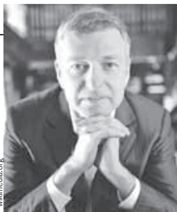
Дмитрия Рыболовлева называют одним из самых влиятельных людей в Монако.

В портфолио Дарьи Строкоус десятки обложек модных журналов по всему миру.