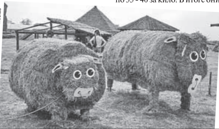
Соломенные скульптуры агропарка видны с трассы. Люди останавливаются, фотографируются, и редко кто уезжает без арбуза.