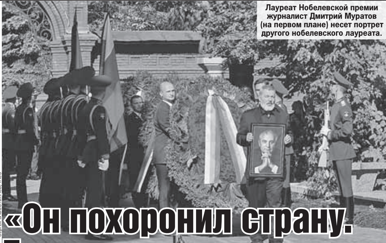
Лауреат Нобелевской премии журналист Дмитрий Муратов (на первом плане) несет портрет другого нобелевского лауреата.

- Мы с коллегами специально прилетели из Омска попрощать-