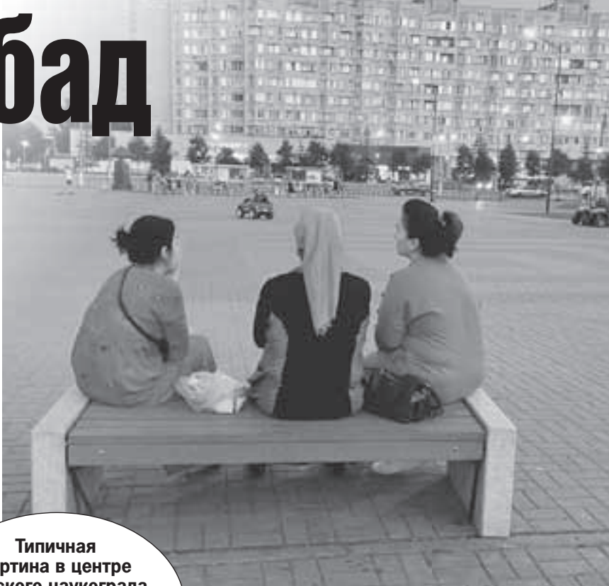
Типичная картина в центре русского наукограда Обнинска - советские многоэтажки и восточные женщины с детьми.

Пока мы с Аллой болтали, в контору зашли двое. Оба таджики, только один уже россиянин, второй оформляется.