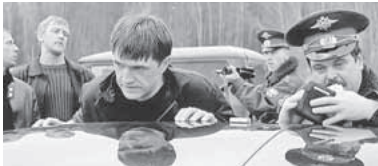
За роль в «Бумере» Владимир Вдовиченков получил целую сумку долларов.

Что касается певцов, то топовые исполнители зарабатывают примерно столько же: так, за выступление на корпоративе рэперы Моргенштерн и Баста просят порядка $100 тыс. - те же 6 млн рублей.