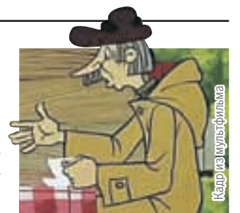
Кадр из мультфильма

По мнению экспертов, если бы появился закон, раз-