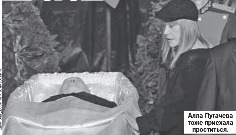
Алла Пугачева тоже приехала проститься.

- А вот скажи, - вступает в диалог с бабушкиным внуком член КПСС с 1982 года. - Какое слово первое приходит в голову, когда слышишь «Горбачев»?