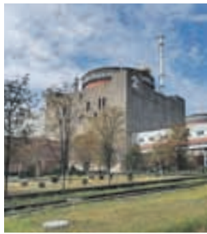
Олег АДАМОВИЧ/«КП» - Москва