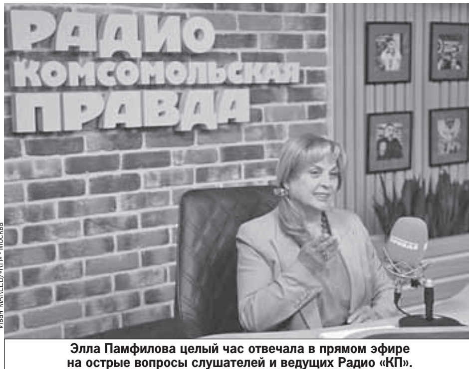
Элла Памфилова целый час отвечала в прямом эфире на острые вопросы слушателей и ведущих Радио «КП».

С другой стороны, и избиркомы проявили доброжелательность. В результате - у нас рекордно низ-