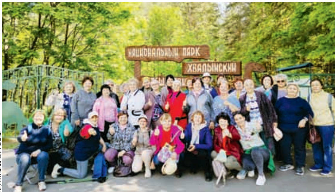
КЦСОН Хвалынского района