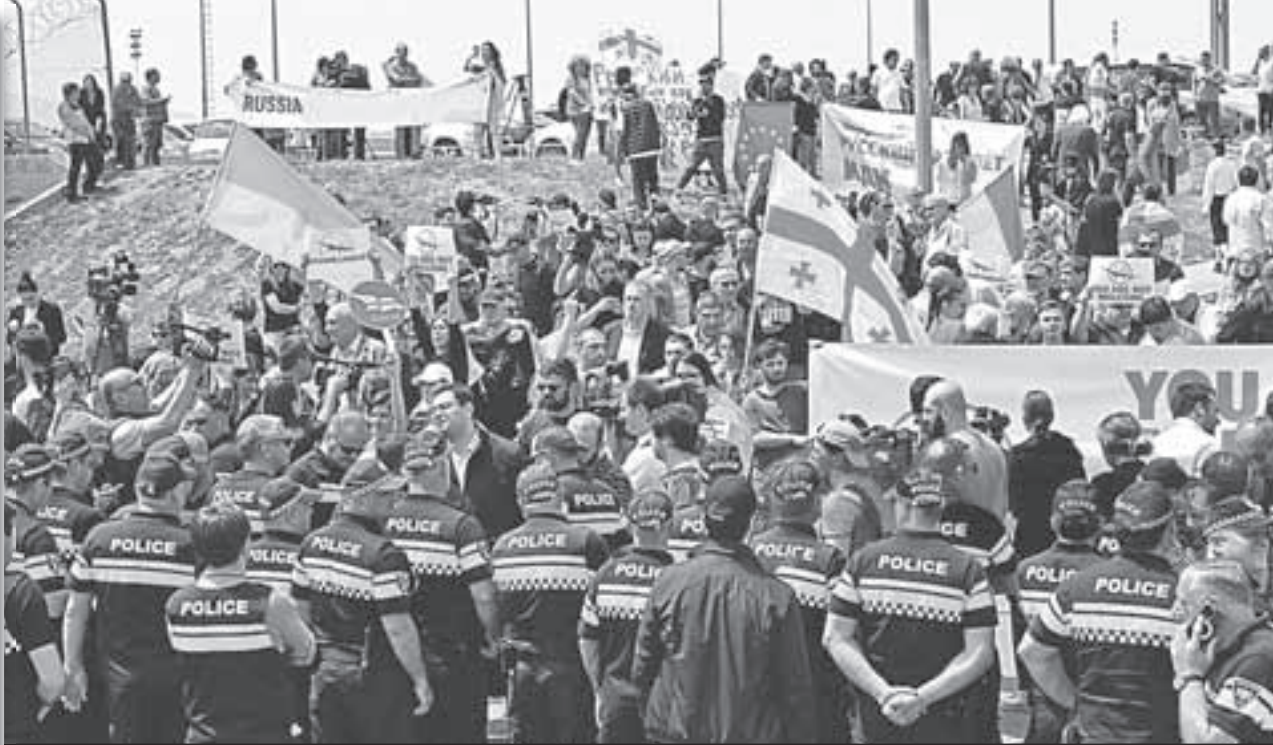
Не более 200 - 300 человек с флагами Грузии, Украины и антироссийскими лозунгами добрались пешком из Тбилиси до аэропорта, в здание которого их не пустила полиция.

Как Грузия встретила первый после 4-летнего перерыва самолет из России. Спецкор «КП» с трудом просочилась в аэропорт Тбилиси, где порадовалась спокойствию полицейских, поразилась за пассажиров и нарвалась на хамство местных журналистов.