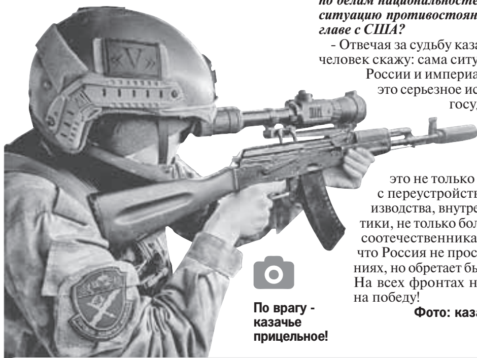
По врагу - казачье прицельное!

Фото: казачий добровольческий отряд «Терек».