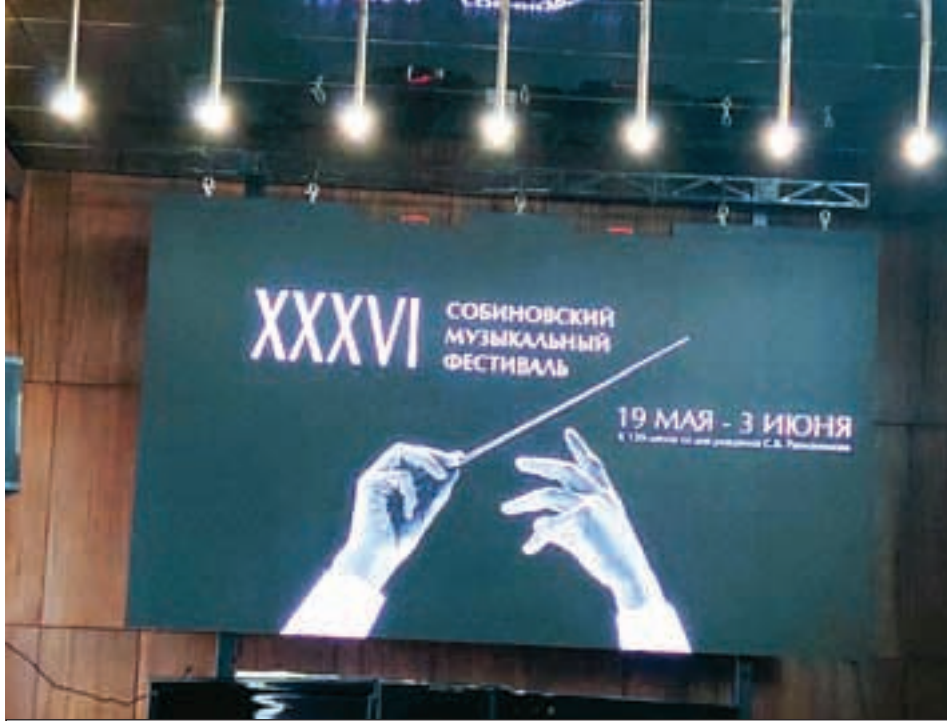
В Саратове продолжается значимое для региона и страны культурное мероприятие.