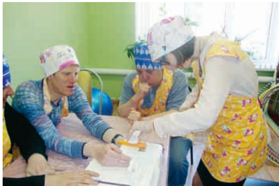
КЦСОН г. Саратова