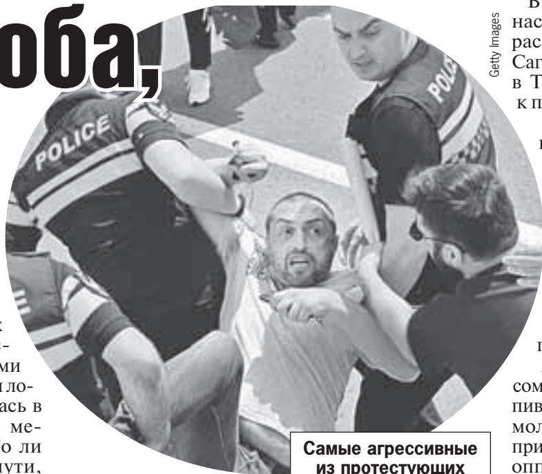
Самые агрессивные из протестующих до аэропорта им. Руставели не добрались.

Те, кто приветствует изменения, тоже были в аэропорту. Но вели себя тихо. А вот противники устроили шоу: хотя автоколонна не доехала, но пешеходы, завернутые в украинские и грузинские флаги, с транспарантами и свистками прибыли аккурат к посадке самолета. Полиция эту группу человека в 200 остановила. Но свист и антирос-