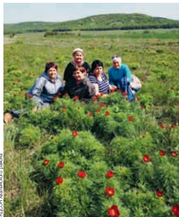
КЦСОН Хвалынского района