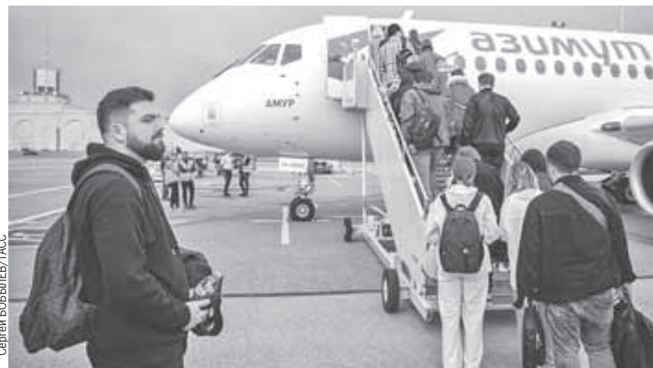
Пассажиры самолета Super Jet 100-95B «Амур» российской компании «Азимут» в Москве не ждали, что в аэропорту Тбилиси не все будут им рады.

- Эти люди относятся к деструктивной части оппозиции, - считает грузинский аналитик Васо Капанадзе . - Ими руководит член парламента Елена Хоштария. Они, как и президент, под диктатом Запада. Но основное большинство правительства и людей приветствует и прямые рейсы, и безвиз.