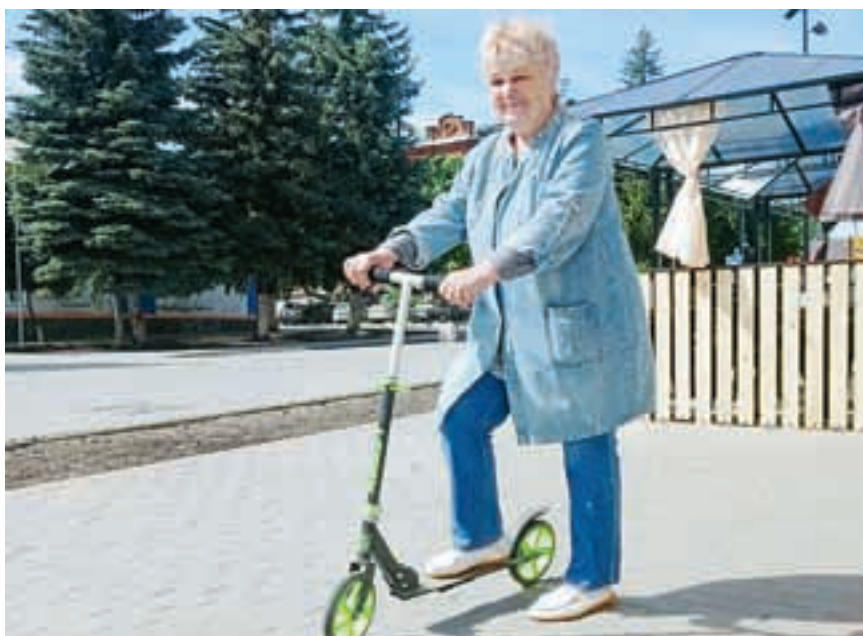
Министерство труда и социальной защиты Саратовской области

В перспективе проект «Активное долголетие» призван увеличить число граждан старшего возраста (женщины 55-79 лет, мужчины 60-79 лет), систематически занимающихся физической