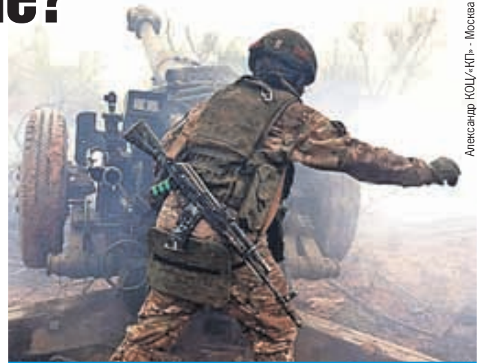
Интенсивность артогня в Артемовске была невероятной.

А пока, в день освобождения Мариуполя, Бахмут опять стал Артемовском.