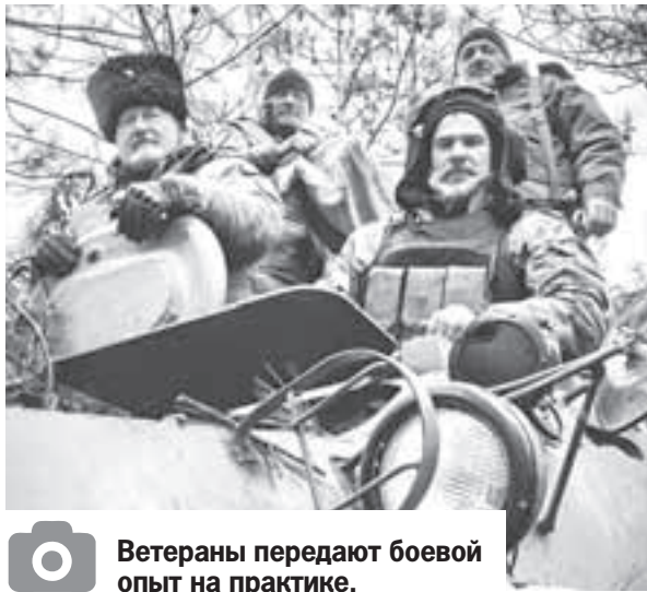
Ветераны передают боевой опыт на практике.

- Претерпели изменение и дополняются в основном пункты Стратегии, связанные с несением казаками государственной и иной службы и патриотическим воспитанием под-