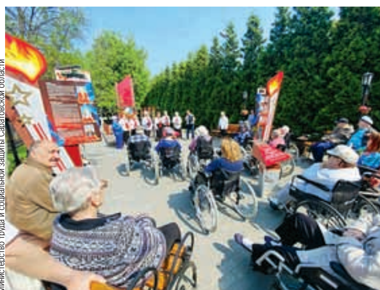
Министерство труда и социальной защиты Саратовской области

Не только материальная поддержка нужна бойцам.