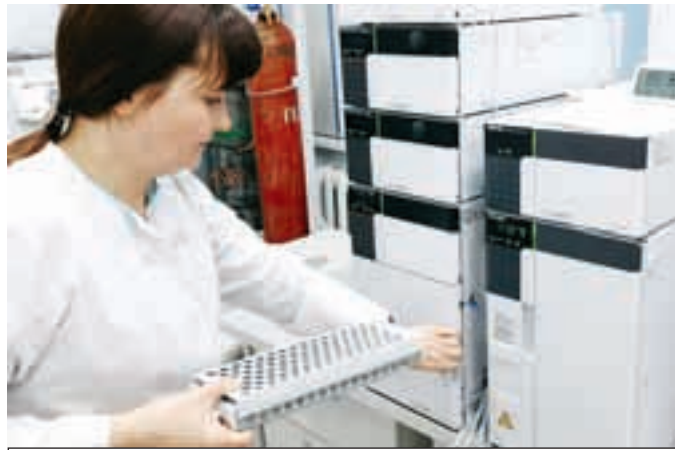
Причину гибели пчел установили специалисты лаборатории.