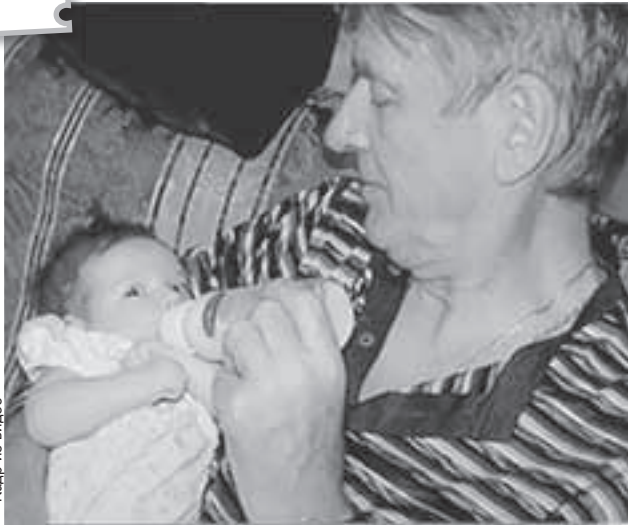
С долгожданной дочкой актер смог побыть всего девять месяцев.

Те, кто общается с семьей, отмечают: Женя очень похожа на отца (раньше чаще говорили о внешней схожести с