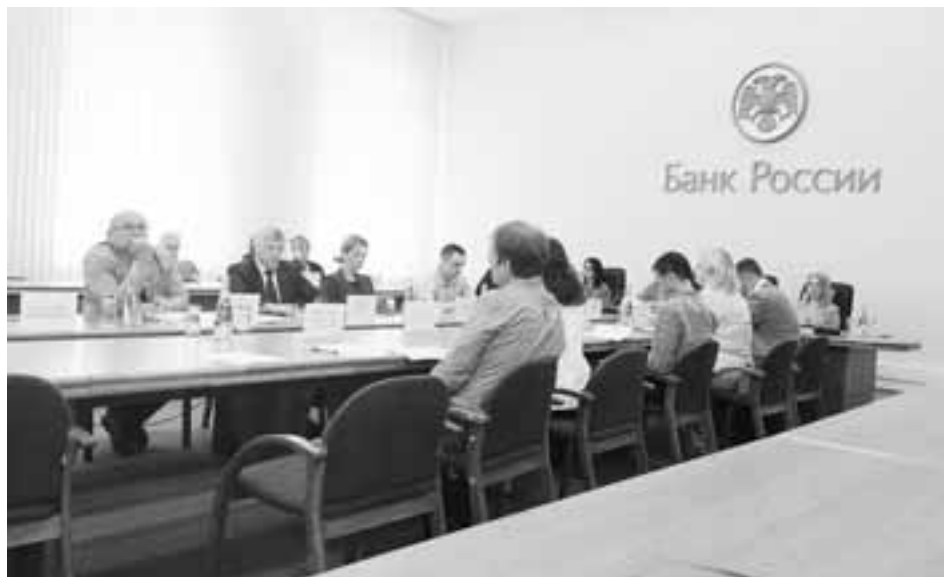
Участники встречи высказали мнения по поводу отдельных выводов доклада Банка России.

Переход к новой стратегии проходил в сложный для страны период. В марте 2015 года годовая инфляция повысилась почти до 17% из-за совокупности факторов. Несмотря на это, Банк России поставил перед собой задачу снизить годовую инфляцию до целевого уровня 4% в 2017 году и поддерживать планку в дальнейшем. Многие сомневались в реалистичности этой задачи, но она была выполнена: годовая инфляция действительно замедлилась до 4% к июлю 2017 года. А