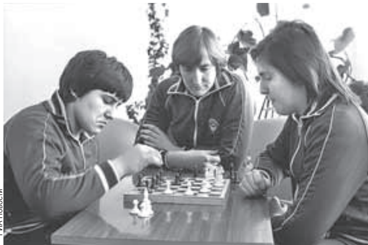
Олимпиада 1980 года подарила не только чемпионов, но и новые слова, например, «олимпийка».

- Накануне соревнований в СССР стали выпускать свитера с молнией, которые окрестили олимпийками. Не расшифруют сейчас и слово «менингитка». Это шапочка: родители пугали, что если ребенок выйдет без нее, то заболеет менингитом.