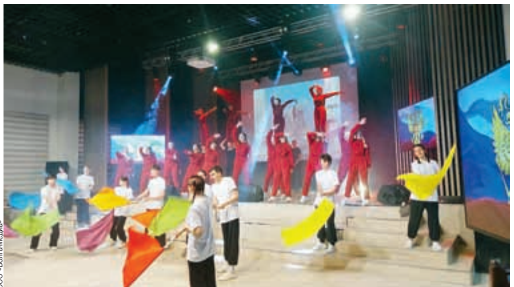
Всероссийский конкурс «Мастер года» проводится в третий раз.