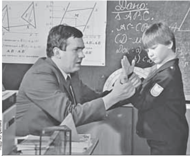
Кажется, кто-то не сдал «контрабанду»...

Некоторые слова исчезли вместе с явлениями. Современные дети не знают про промокашки и чернильницы. Канули в Лету и названия некоторых уроков. Например, чистописания (когда учили писать пером). Или оценки за прилежание (насколько