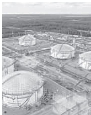
«Транснефть» управляет гигантскими объемами жидкого топлива.

Если масштабировать технологии на целую отрасль, горизонты цифрового интеллекта поражают. Речь идет о транспортировке нефти и ПАО «Транснефть» - крупнейшем операторе нефтепроводов в мире. Новые технологии не только предвосхищают изменения, но и формируют их.