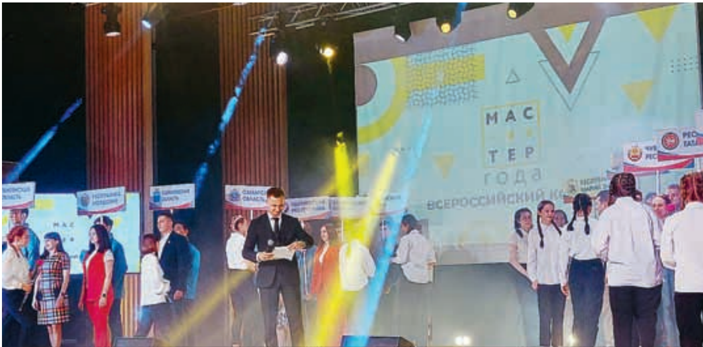
Конкурс призван поощрить педагогических работников и повысить престиж звания педагога.