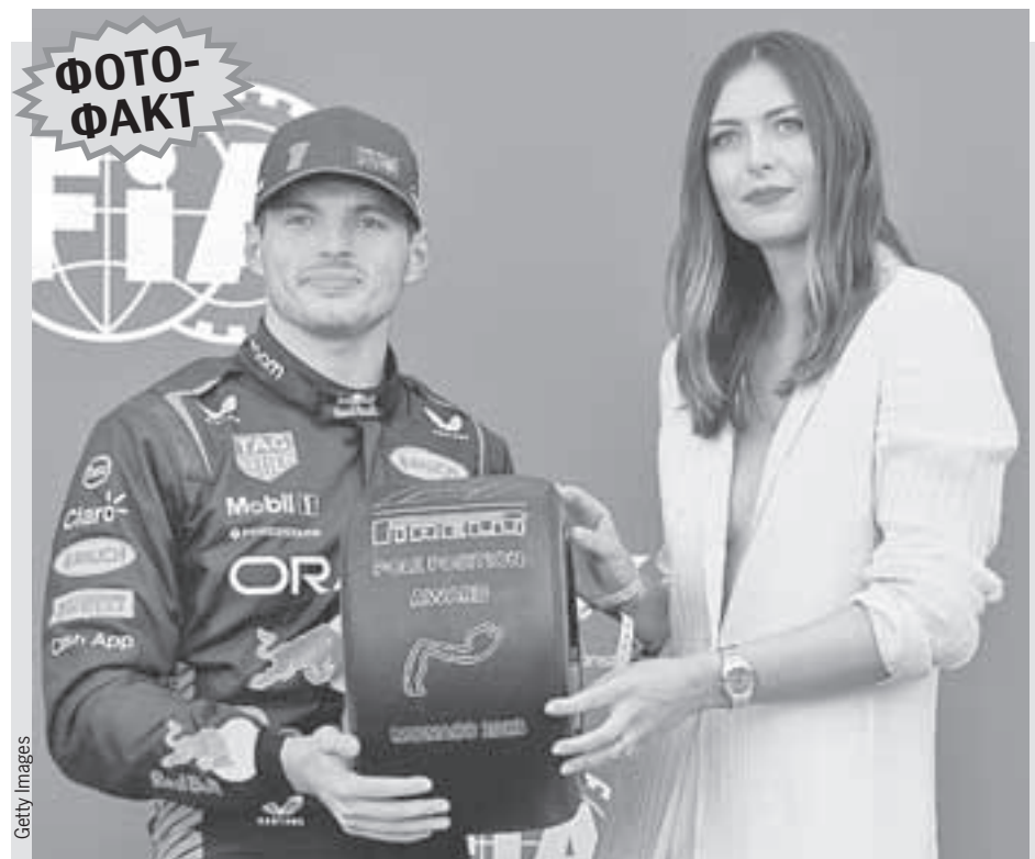
Мария Шарапова в откровенном наряде впервые после родов появилась на спортивных соревнованиях в качестве почетного гостя. Знаменитая теннисистка наградила гонщика «Формулы-1» Макса Ферстаппена за победу на Гран-при Монако.