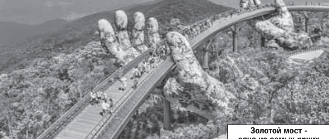
Золотой мост - одна из самых ярких достопримечательностей Вьетнама.