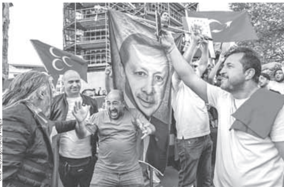
Сторонники Эрдогана празднуют его победу. Турецкий лидер останется на посту президента еще пять лет.

щих турецкое гражданство, - их в Турции достаточно много.