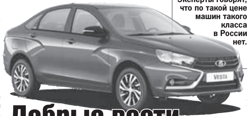
Эксперты говорят, что по такой цене машин такого класса в России нет.

- Lada Vesta выпускалась с 2015 года на вазовском предприятии в Ижевске, но потом производство было полностью перенесено на основную площадку в Тольятти, - рассказал автоэксперт Игорь Моржаретто. - Новая версия была презентована 22 февраля прошлого года, но в силу известных политических и экономических причин производство пришлось