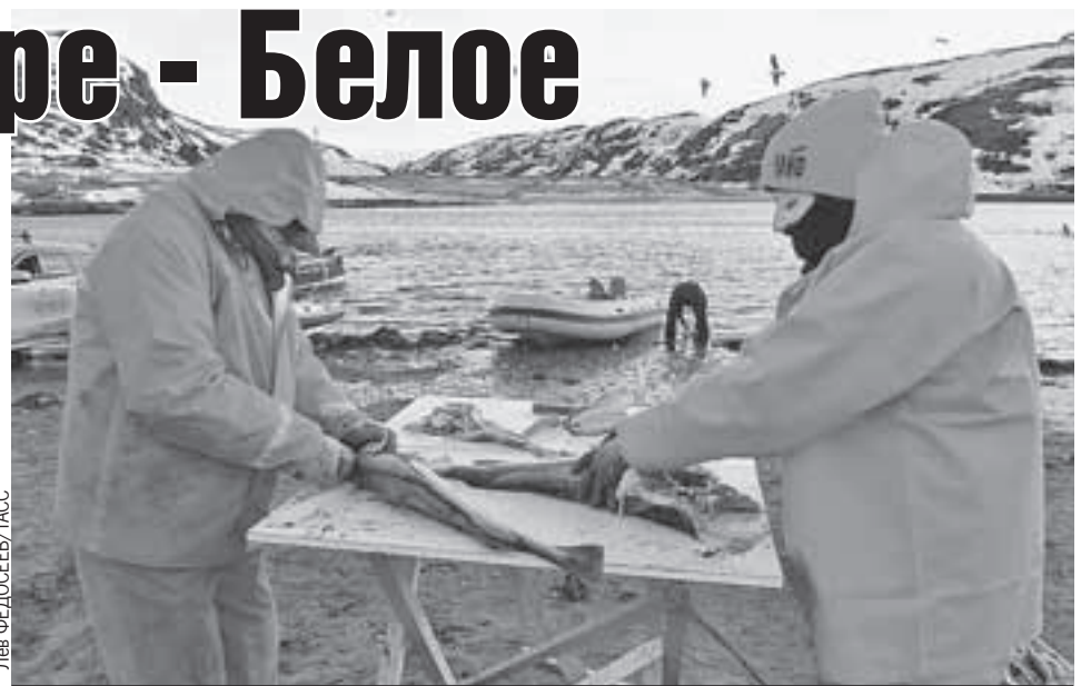
В Терiberке туристы могут отправиться на рыбалку за красной рыбой.

Спросите, зачем ехать не на Черное море, а к Баренцеву и Белому морям? Ну, например, за романтикой. На Терском берегу (считай, юг полуострова) есть своя пустыня в Кузомени, знаменитый табун диких лошадей и аметистовый берег. На ледоколе «50 лет Победы» летом можно отправиться в 12-дневное путешествие к Северному полюсу. Звучит экстремально, но на самом деле это очень комфортная поездка: теплую одежду выдадут, вкусно накормят. Захочется экстрима - можно выйти на льдину и искупаться в Северном Ледовитом океане. Правда, стоимость путешествия кусается: