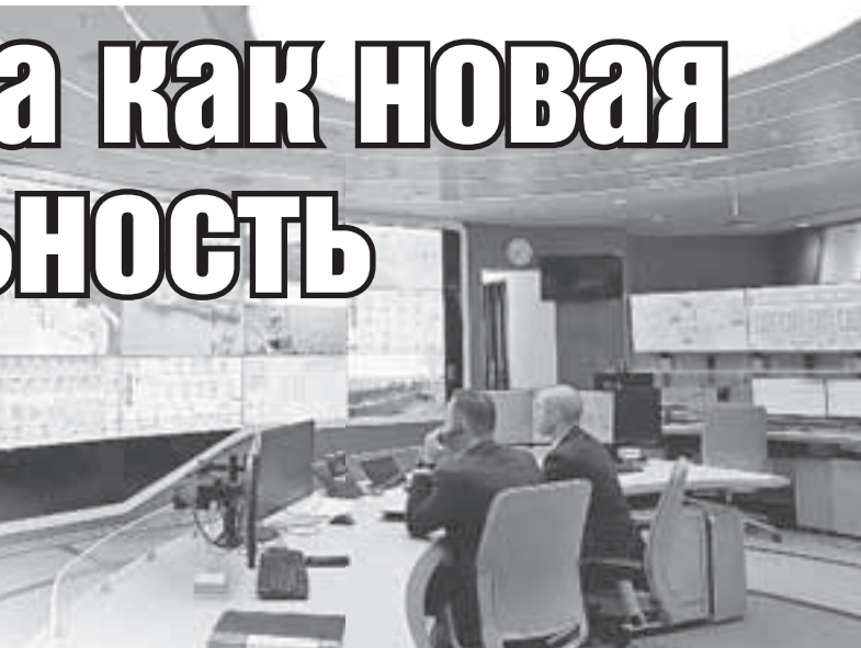
Компания использует революционные технологии управления трубопроводами.