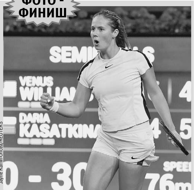
ФОТО - ФИНИШ

Знакомьтесь: первая ракетка России Дарья Касаткина. В воскресенье 20-летняя теннисистка из Тольятти играла в финале крупного турнира в Индиан-Уэллсе, где уступила японке Наоми Осаки счетом 3:6, 2:6. Но до этого было несколько великолепных побед, в том числе над бывшими первыми ракетками мира Анжеликой Кербер и Винус Уильямс. Дарья, перепрыгнув сразу через девять ступенек, поднялась на 11-ю строчку в мировом рейтинге, обойдя всех своих соотечественниц. «Всем спасибо за вашу поддержку, сегодня не получилось, но дальше больше», - написала в соцсетях Дарья Касаткина.