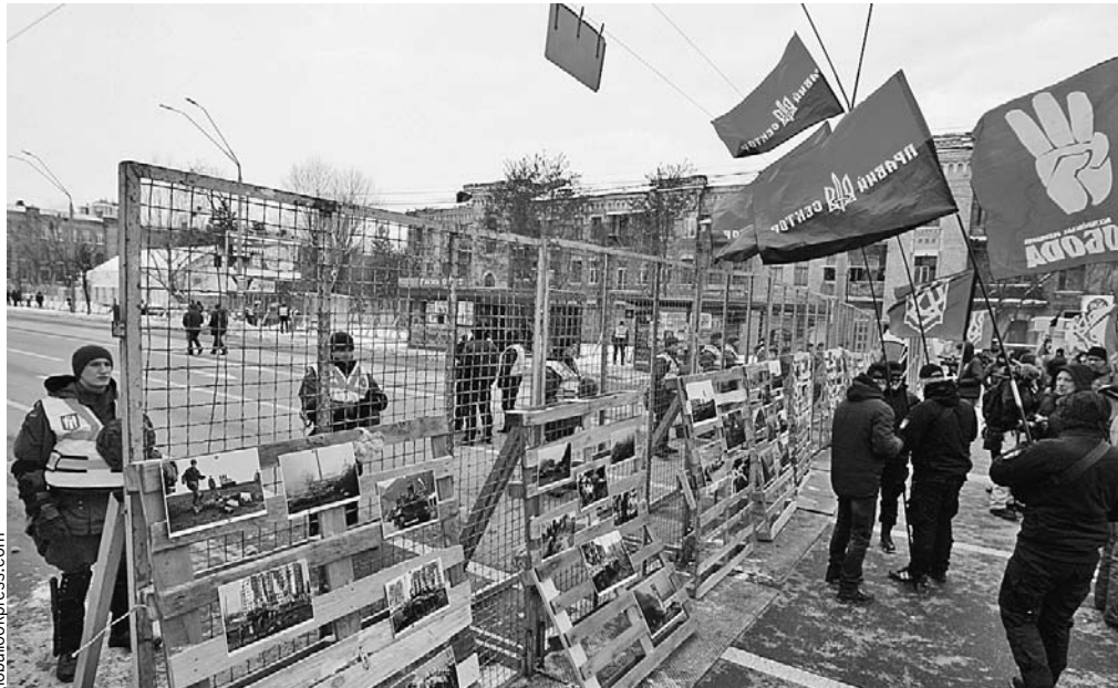
В марте 2018-го активисты запрещенного в России «Правого сектора» вместе с другими националистами собирались у российских дипмиссий коридоры позора для тех, кто хотел проголосовать на выборах Президента РФ.

ровые бомбардировки - подкармливали толпы блогеров, смысленую и активную молодежь. Для закрепления усвоенного материала их вывозили из «русского мира» в «западный мир». На выходе получили полное распродавание «русского мира» на земле, из которой и вышел когда то «русский мир», - вдумайтесь в ужас этого парадокса!