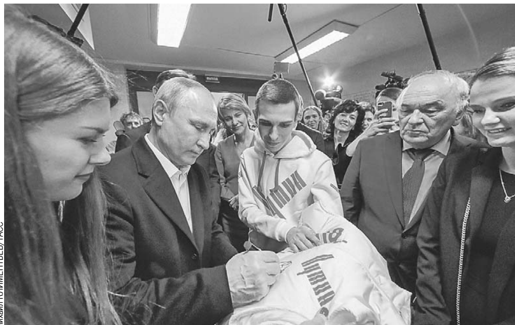
Президент в своем предвыборном штабе сразу после победы. Он расписался на толстовках волонтеров, собиравших голоса в его поддержку. И поговорил с военным обозревателем «КП» Виктором Баранцом (на фото - справа).

- Все течет, все меняется. Мы все меняемся.