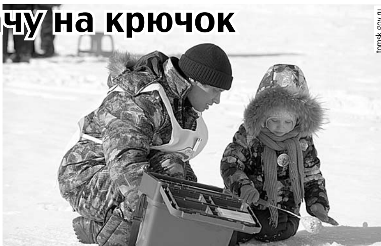
«Народная рыбалка» фестиваль для опытных и юных промысловиков.

объехал фестивальную поляну, покатали юных рыбаков и пообщался с любителями зимней ловли. «Мы с вами встречались здесь год назад, за это время вы, конечно, отточили свое мастерство, - сказал глава региона. - Но не забывайте, что рыбалка - не только промысел, а замечательный отдых всей семьей, увлекательное общение на свежем воздухе. И какая рыбалка без баек!»