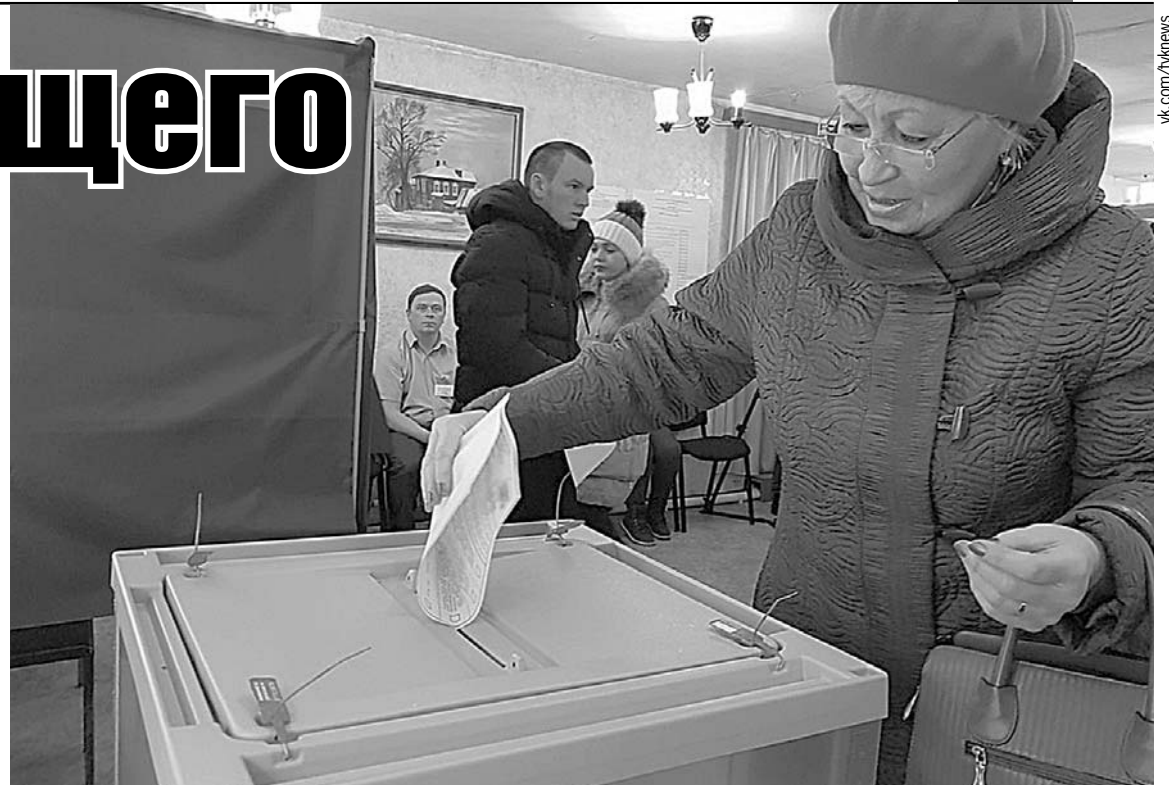
18 марта в Томской области работали почти 800 избирательных участков.

- Камеры были настроены так, чтобы не была видна информация в списках и то, как голосуют избирате-