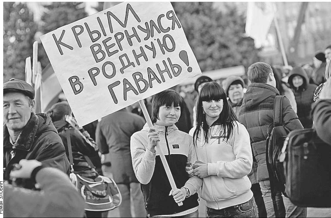
Воссоединению Крыма с Россией радовались не только на самом полуострове, но и по всей стране. На фото - набережная Саратова.

севере полуострова, для них сразу все становится понятно. На жалобы местных на качество дорог горько усмеваются: «У нас вместо них одни направления». Да, если сравнивать цены на продукты, Украина будет немного в выигрыше. Но в Крыму-то и доходы выше. А «коммуналку» и вовсе сравнивать бессмысленно. У них полным