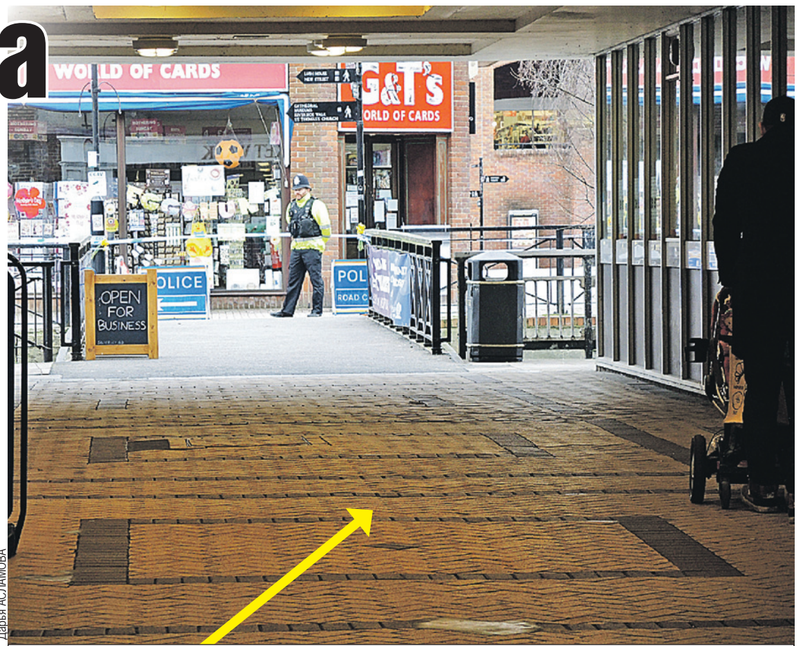
Тот самый переход между рестораном и парком. Место безлюдное, очень удобное для нападения. По крайней мере все местные так считают.

- Точно. Они там посидели, выпили. Традиция тут такая по воскресеньям. Отлично себя чувствовали. Потом дошли до ресторана «Зиззи», там победили. И вот потом свернули в этот роковой проход между