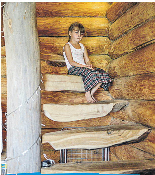
В новых деревнях новых сельских русских все экологично - даже ступеньки в доме.

по-прежнему любят выпить, но не с утра. Идет процесс протрезвления, но медленнее, чем в городе. Но он отслеживается и в деревне - там, где есть работа.