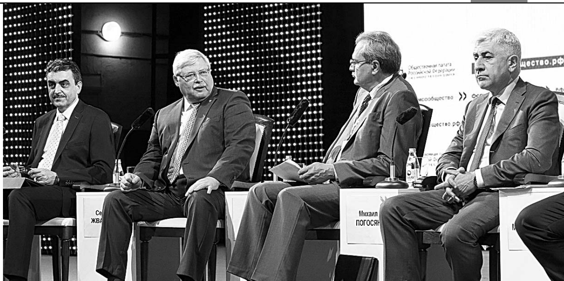
Губернатор Томской области Сергей Жвачкин рассказал о том, как региону удалось создать одну из сильнейших инновационных систем в России.

Сергей Жвачкин выразил надежду, что эти и другие томские инициативы будут обсуждены на итоговом форуме «Сообщество», который пройдет в ноябре в Москве.