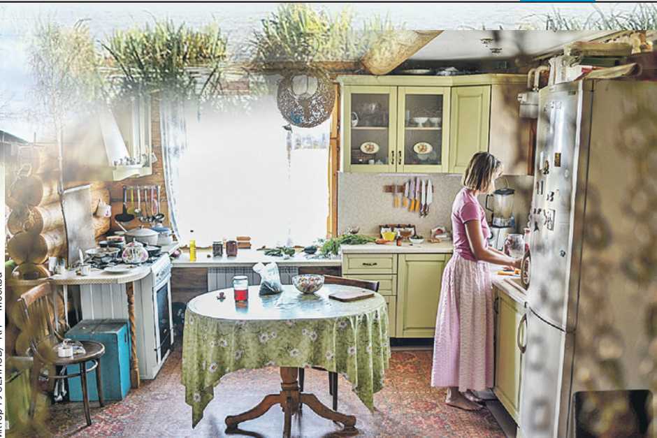
Переехавшие из мегаполисов устраивают свой деревенский быт не по сельским обычаям - по городским, чтобы не только красиво было, но и быт облегчалось...

людей умерло. Умирили одиночки-алкоголики, умирали и сгорали в своих домах целыми пьющими семьями. А статистика говорит, что употребление алкоголя стало снижаться только в последние годы. Руководители сельхозпредприятий так мне и говорят: «В брежневские времена квасили все, начиная с руководителей районов». Люди