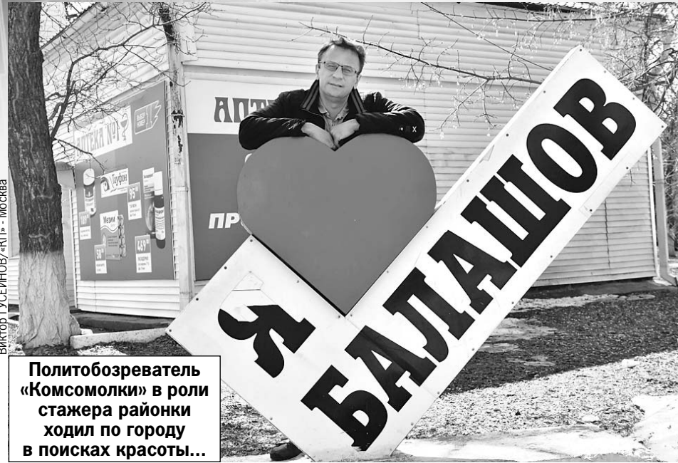
Политобозреватель «Комсомолки» в роли стажера районки ходил по городу в поисках красоты...