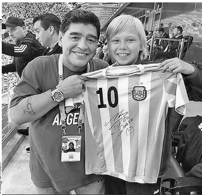
Не каждому поклоннику футбола выпадает такое счастье, чтобы тебя обнял сам Марадона.

Но Марадона сам заметил в толпе светловолосого