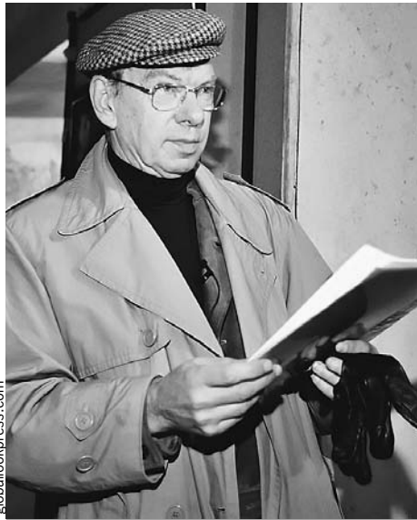
Алексея Баталова не стало 15 июня 2017 года. Народному артисту СССР было 88 лет.