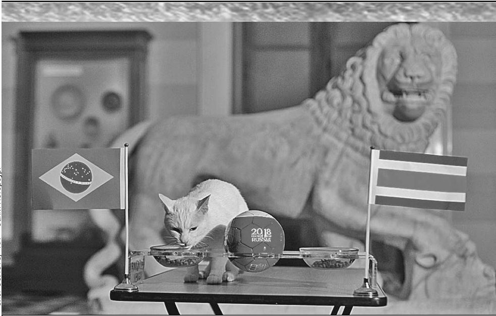
Кот-оракул Ахилл предсказал победу сборной Бразилии над Коста-Рикой. Пентакампионы выиграли 2:0, забив два мяча в самом конце игры.