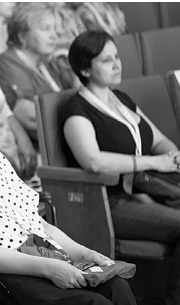
В работе форума Общественной палаты РФ «Сообщество» приняли участие представители всех регионов Сибирского федерального округа.