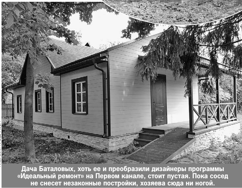
Дача Баталовых, хоть ее и преобразили дизайнеры программы «Идеальный ремонт» на Первом канале, стоит пустая. Пока сосед не снесет незаконные постройки, хозяева сюда ни ногой.