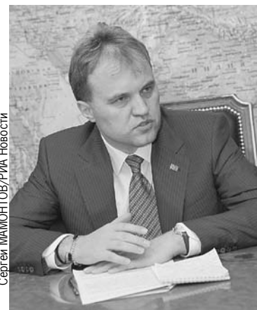
Евгений Шевчук несколько лет возглавлял Приднестровье.

- Большинство граждан всегда выступали против вывода российских миротворцев. Российские войска - в зоне разделения между вооруженными силами Молдавии и Приднестровья они являются сдерживающим фактором. Чтобы противоречия в экономической и политической плоскости не перетекали в агрессивную форму.