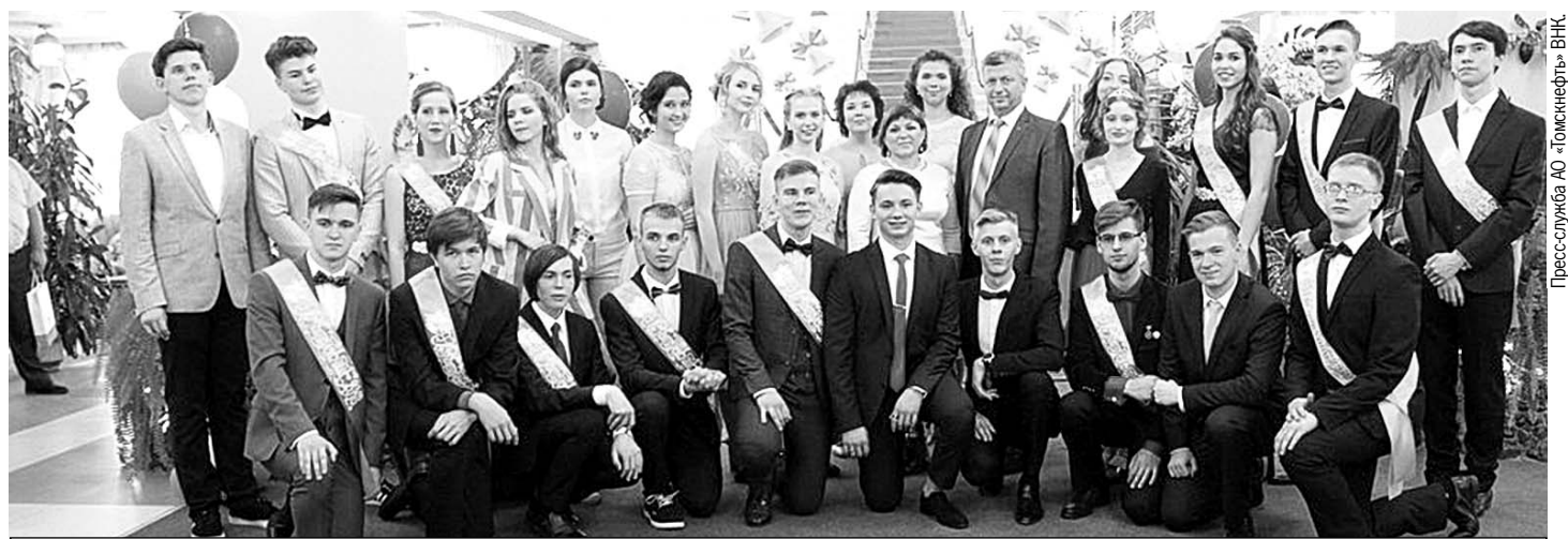
Выпускники «Роснефть-класса» получили поздравления, подарки от градообразующего предприятия и напутствия в «большую жизнь».

За время действия проекта, с 2010-го по 2017 год, «РН-классы» в школах №4