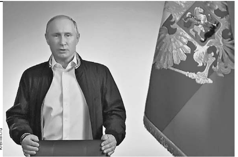
Владимир Путин поздравил выпускников школ 2018 года в соцсети, которая сегодня наиболее популярна у тинейджеров.

- Вы быстро осваиваете новые технологии, уже многое знаете и умеете. В этом ваша заслуга - и искренняя благодарность вашим родителям, учителям, наставникам за труд, мудрость и терпение.