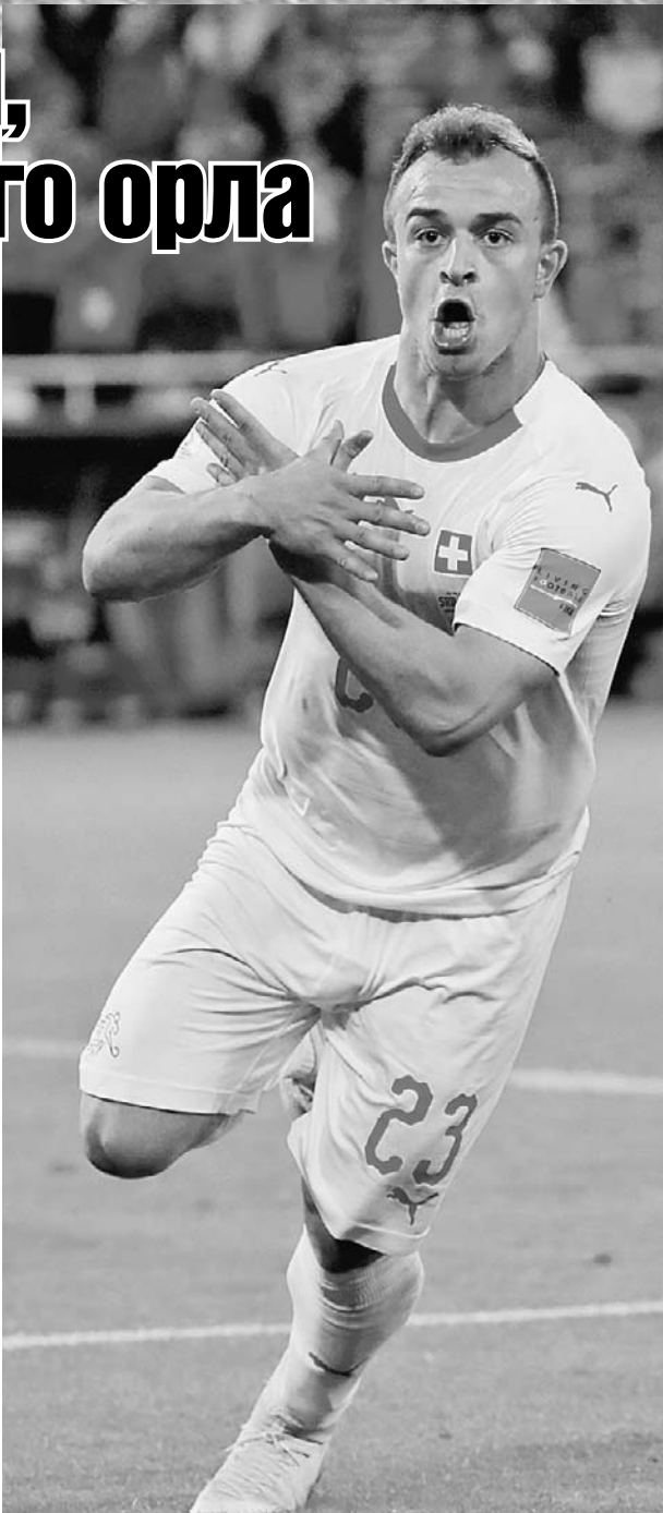
Джердан Шакири умудрился на поле спровоцировать международный конфликт.

Сербия негодуют, говорят о двойных стандартах и о том, что чиновники пытаются спустить весь этот скандал на тормозах. Словом, Шакири, похоже, отделался желтой карточкой, которую он получил за то, что после забитого гола снял майку. Тут же посыпались комментарии, что у Шакири оказалась слишком развитая для футболиста мускулатура и надо бы еще проверить его на анаболики.