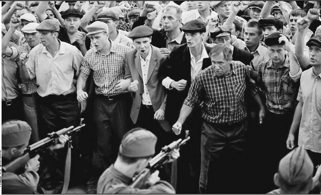
Картина Кончаловского посвящена печально известному новочеркасскому расстрелу 1962 года.

В начале фильма она предстает отоваривающей спецпаек в обход очереди голодных новочеркасских рабочих. Встать на сторону тех, кому понизили зарплату на фоне увеличения цен, она не хочет и не может. В разгуле народной стихии Семина склонна винить амнистированных политзаключенных - по ее мнению, именно они, как сейчас либералы, сеют смуту среди трудящихся. Недолго думая, героиня призывает расстреливать зачинщиков и участников массовых акций.