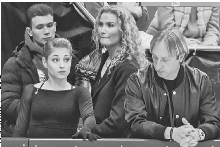
Алена Косторная (слева) и Евгений Плющенко (справа) нажили себе врага в лице бескомпромиссной Этери Тутберидзе (в центре).

Каково вам было находиться в эпицентре скандала после того, как вы перешли от Тутберидзе к Плющенко?