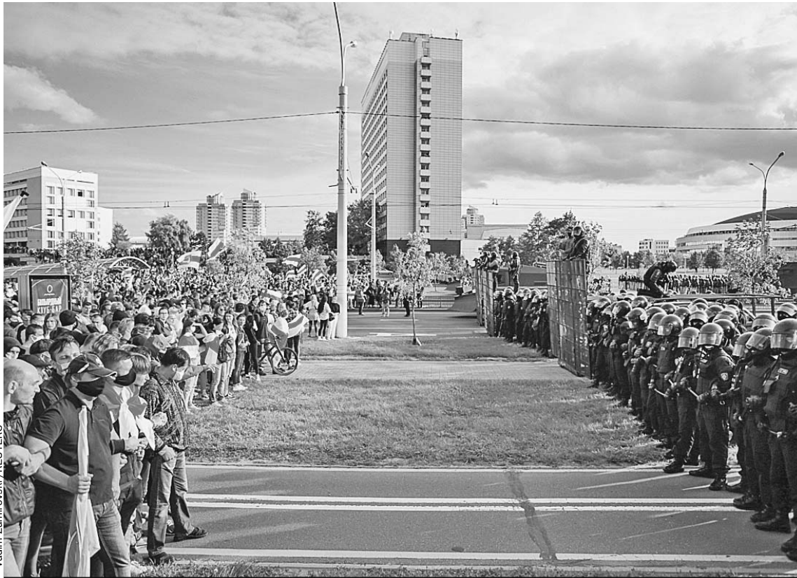
На пути демонстрантов к поселку белорусских чиновников выстроился ОМОН. Стояв в пяти метрах от стены силовиков почти час, протестующие развернулись и ушли...