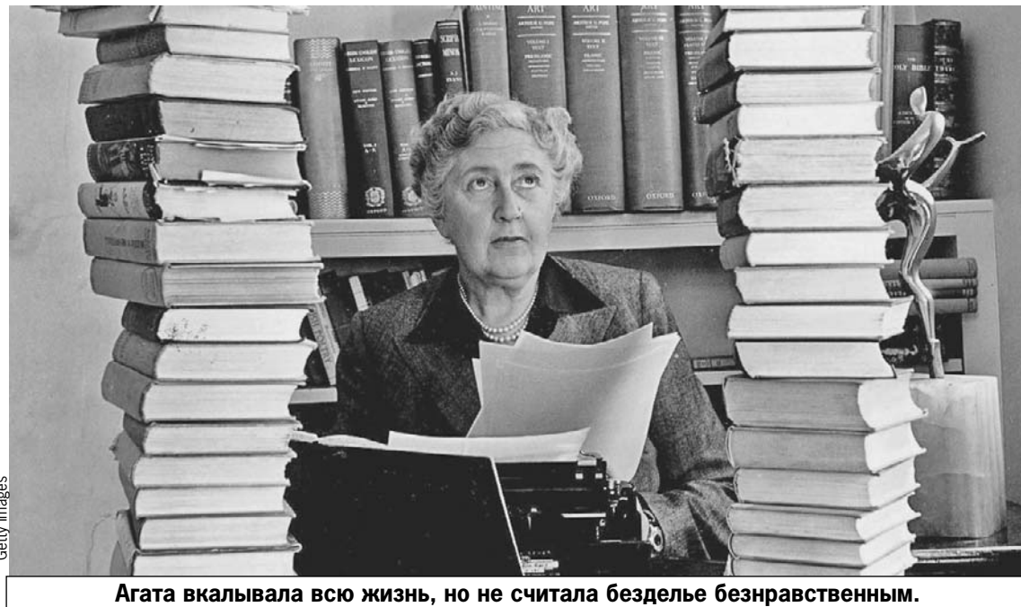
Агата вкалывала всю жизнь, но не считала безделье безнравственным.

4. Интерес к детективной литературе в Агате пробудили Артур Конан Дойл и Уилки Коллинз . Первый свой детектив «Таинственное происшествие