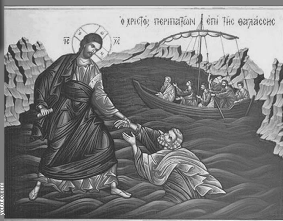
Из-за тектонических процессов место, где Иисус ходил по воде, теперь располагается в 3 километрах от береговой линии.

Археологи утверждают, что нашли руины римского храма, посвященного Юлии, жене императора, в честь которой и был переименован город. Он был построен на фунда-