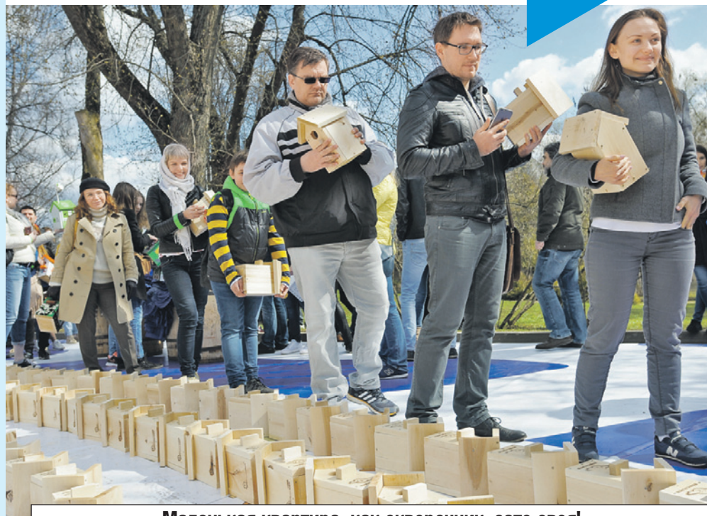
Маленькая квартира, как скворечник, зато своя! Таких низких ставок по кредитам на жилье еще не было, и народ ринулся решать квартирнй вопрос.

Самый ходовой прогноз про рынок жилья в последние месяцы коронавируса и самоизоляции - вот-вот цены рухнут. Но пока этого не происходит, и даже, напротив, вопреки прогнозам о падении реальных доходов населения у нас начался чуть ли не квартирнй бум. Все «почему?» и «что дальше?» «КП» задала экспертам.