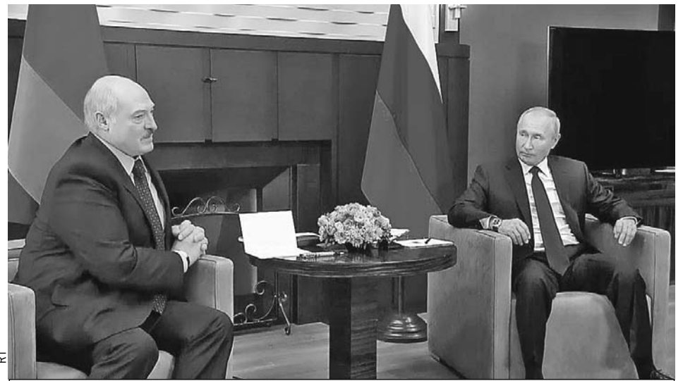
Александр Лукашенко пообещал Владимиру Путину лично рассказать, что на самом деле происходит в Белоруссии.

говорами. Для начала он поздравил белорусского коллегу с победой на выборах еще раз - теперь лично.