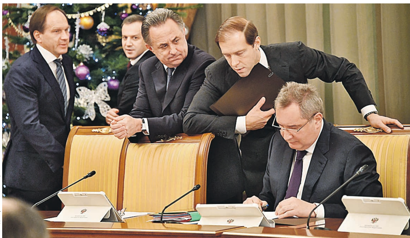
Еще в декабре, сидя под елочкой, эти высокие чиновники были полны приятных новогодних дум. А в середине весны прогнозы насчет каждого очень разные. Министр по делам Северного Кавказа Лев Кузнецов (крайний слева) пока в безопасной карьерной зоне, вице-премьером Аркадию Дворковичу (второй слева) и Дмитрию Рогозину (крайний справа) многие прочат отставку, судьба еще одного вице-преьера, Виталия Мутко (третьего слева), определится после чемпионата мира по футболу, а вот министру торговли и промышленности Денису Мантурову (второй справа), наоборот, прогнозируют повышение до вице-преьера.