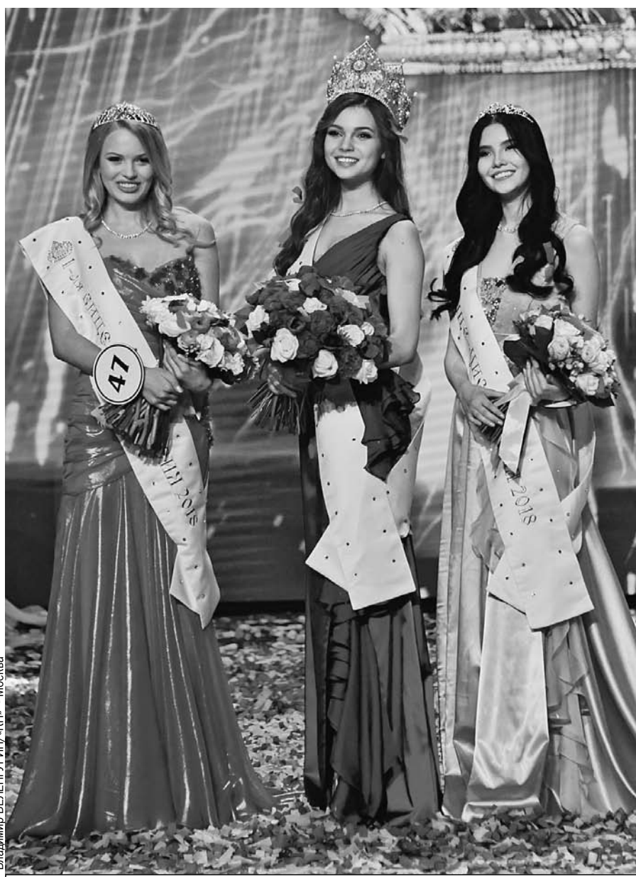
Владимир БЕЛЕГУРИН/«КП» - Москва