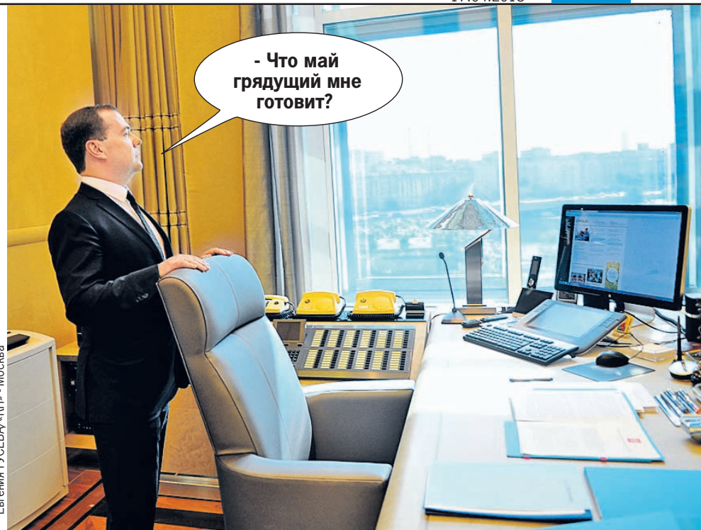
Шансы, что Дмитрий Медведев сохранит за собой премьерское кресло, сейчас примерно 50 на 50.

Кричевский: - Задачи стоят по повышению роста экономики, притом что те, кто останется, и те, кто придет, не имеют представления, как это в современных условиях делать. Это основная проблема нашей власти. Слава тебе господи, у нас начали работать социальные лифты для людей. Пусть со скрипом, пусть во многом с имитацией, но - тем не менее - это маленький шаг вперед. Но у нас напрочь отсутствуют социальные лифты для идей. Мы не можем разобрататься с тем, что наворотили в предыдущие годы. Мы не можем понять, что повышение пенсионного возраста