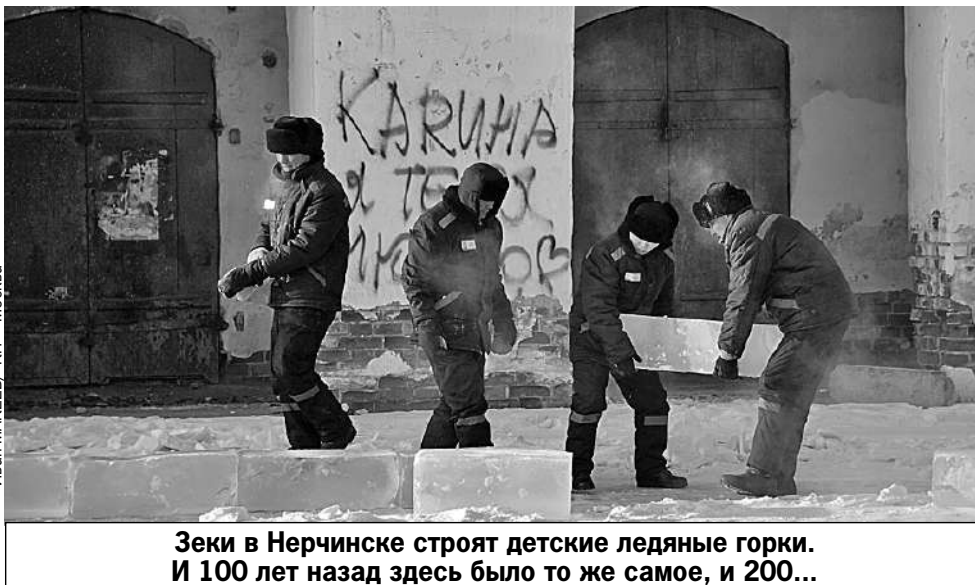
Зеки в Нерчинске строят детские ледяные горки. И 100 лет назад здесь было то же самое, и 200...

в кругосветку, принципиально не пользуясь автотранспортом. Шли на слонах, верблюдах, велосипедах. Попали сюда, как назло, зимой. У Могочи минус 40, велосипеды рассыпались, неделю сидели в палатке. Я эвакуировал их на автобусе, что, по их сценарию, было запрещено. Девы взяли клятву - никому не рассказывать... - Может, и вам на такси? - хитро подмигивает. - Никому не скажу... Минус 35. В первые 15 минут - легкий танец. «Медляк». Потом начинается дискотека. Рок. Металл. Брейк-данс.