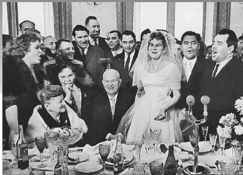
На свадьбе Валентины Терешковой и Андрияна Николаева гуляли Никита Хрущев и Юрий Гагарин .

После официальной части Валентина и Андриян продолжили праздник в профессиональном кругу в Центре подготовки космонавтов, там уже гуляли допоздна. Вместе они прожили 18 лет. У них родилась дочь, потом появились и внуки.