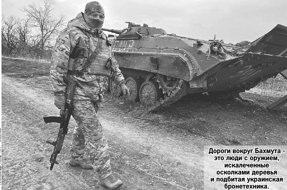
Александр КОЦУ-«КП» - Москва

Вместе с парнями из отряда легендарного командира «Ратибора» (Герой России, кавалер орденов Мужества и Красной Звезды) выдвигаемся в сторону Артемовска. Часть пути проходит по трассе на Славянск. В 2014 году я ездил по ней на прокатной машине с киевскими номерами. Сейчас трассу, конечно,