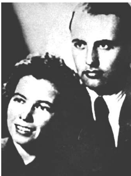
Михаил и Раиса Горбачевы праздновали в столовой.