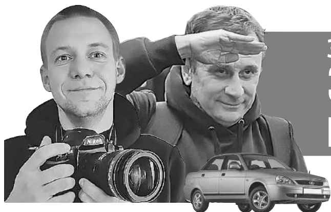
Владимир ВОРСОБИН (текст)

Читайте на сайте KP.RU все путевые заметки нашей экспедиции (там же - видео, которое мы снимали в пути).