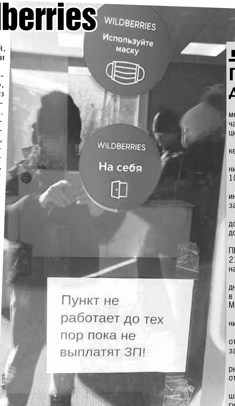
«Штрафы такие огромные, что мы не можем платить зарплату сотрудникам!» - рассказали нам сотрудники пунктов выдачи заказов. И ушли бастовать.

Основательница и генеральный директор компании Wildberries - самая богатая женщина России Татьяна Бакальчук . По данным Forbes, ее состояние - $2,1 млрд. В декабре 2021 г. было $13 млрд.