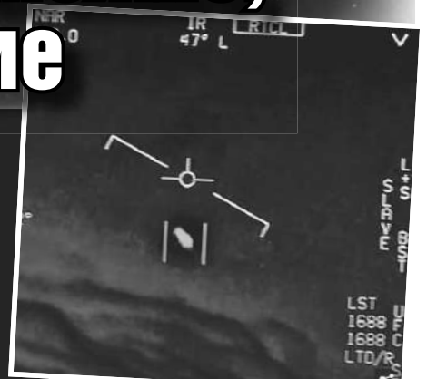
Не исключено, что в инфракрасные прицелы военных летчиков попали дроны, выпущенные представителями внеземной цивилизации.

Киркпатрик тоже не лыком шит: до назначения в AARO занимал должность главного научного сотрудника в Центре ракетной и космической разведки Управления военной разведки.