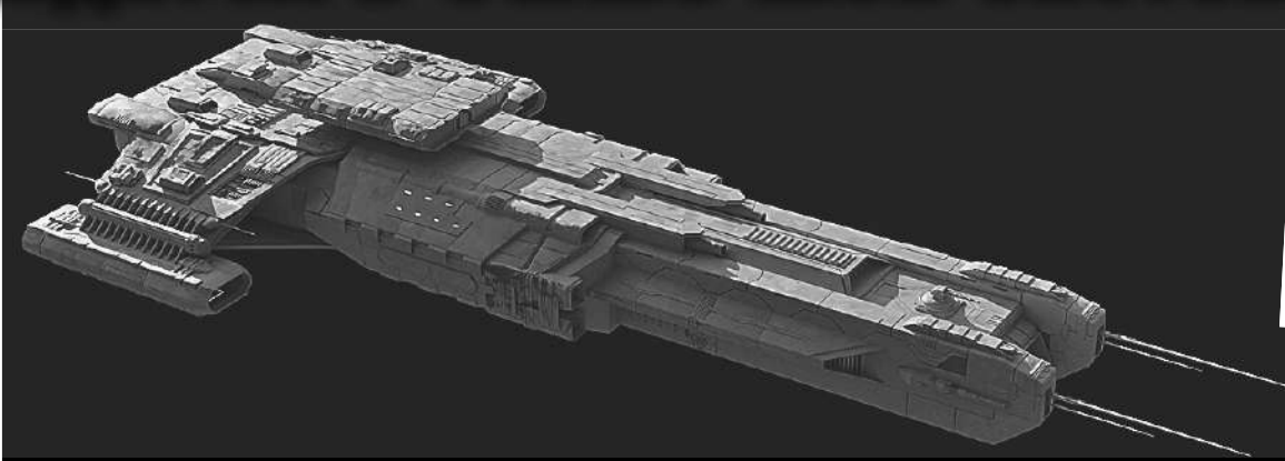
Сигарообразный астероид Оумуамуа длиной 400 метров мог быть межзвездным кораблем. Так он выглядит в представлении художника.

Свежее откровение содержится в обширном докладе, который Киркпатрик подготовил совместно с Абрахамом Лёбом, который работает в Гарвард-Смитсоновском центре астрофизики, возглавляет кафедру астрономии в Гарвардском университете и состоит членом президентского совета по науке и технологиям США.