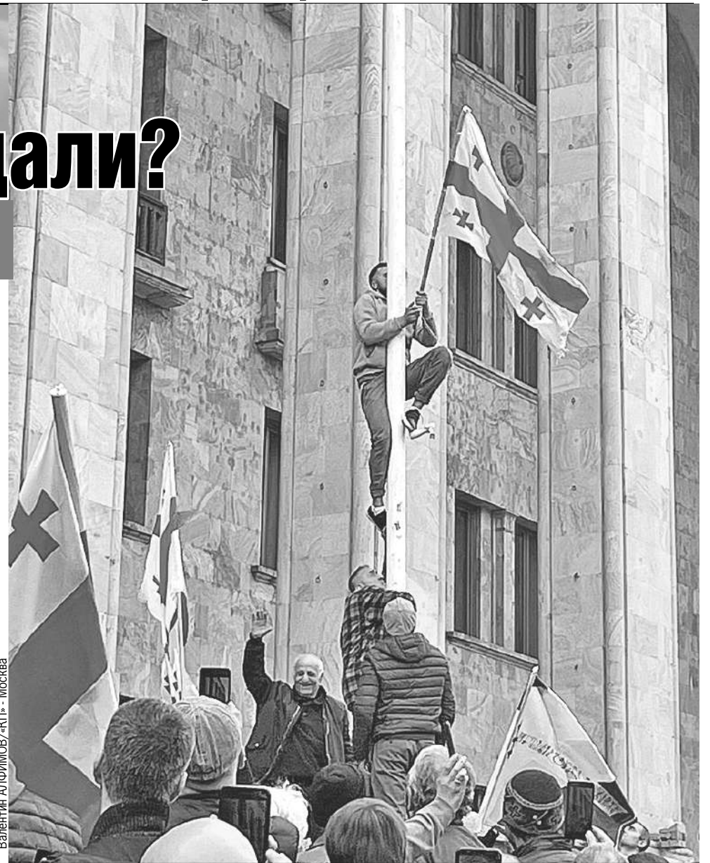
Вместо флага ЕС перед парламентом в Тбилиси подняли флаг Грузии.

- Против чего митингуем? - обратился я к соседу чуть моложе.