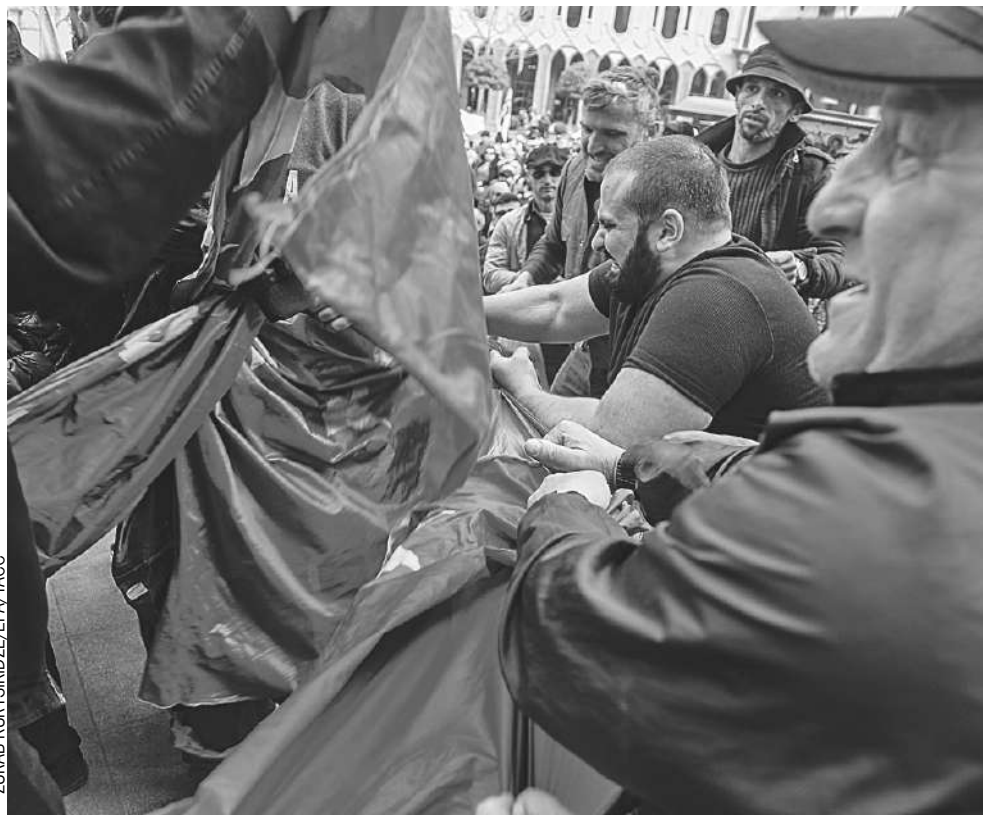
А сорванный флаг Евросоюза грузины порвали на куски и сожгли.

Чуть позже полиция отчиталась: возбуждено дело об административном правонарушении по факту надругательства над флагом ЕС. А спикер парламента Грузии Шалва Папуашвили заявил, что «радикализм порождает радикализм». «Когда ломали окна парламента (на митингах 7 - 8 марта. - Авт.), почему они не думали о Европе?» - отметил он.