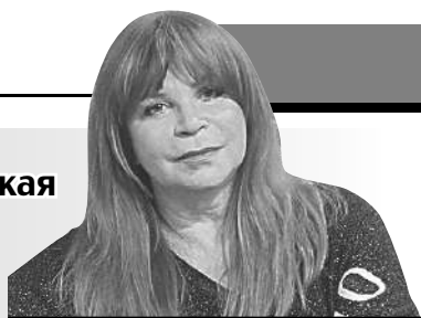
Наталья Бестемьянова - желанный гость на Радио «КП» (FM.KP.RU).

Легендарная советская фигуристка, олимпийская чемпионка в танцах на льду подводит с «КП» итоги сезона.