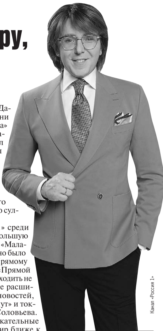
Канал «Россия 1»

Новая программа гуру житейских ток-шоу будет называться просто «Малахов».