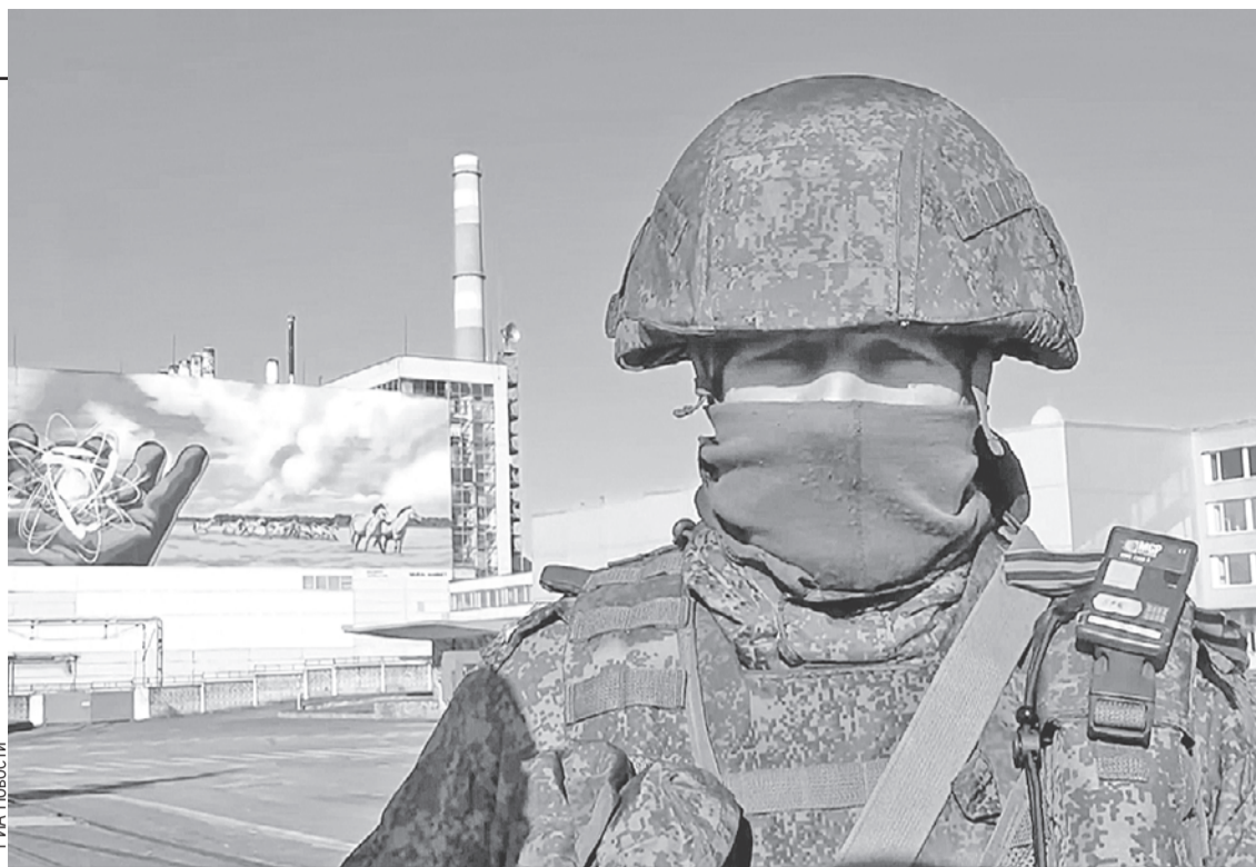
Боец ВДВ РФ несет дежурство на территории Чернобыльской АЭС, взятой под контроль 24 февраля. Безопасность энергоблоков и саркофага обеспечивается совместно с украинским батальоном охраны.

«Сейчас в Киеве хаос. Бесконтрольно раздали оружие, тероборона стреляет по всем подряд, им мерещатся «российские диверсанты». Официальная пропаганда призывает жителей прыгать под танки, кидать «коктейли Молотова» в российскую бронетехнику. Мыслящие киевляне считают, что это нужно режиму Зеленского для того, чтобы потом об-