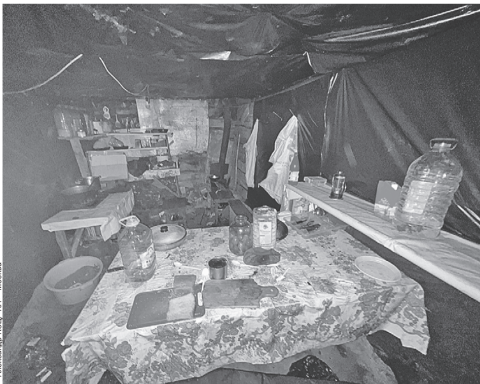
Александр КОЦ/«КП» - Москва

За бруствером лежит окоченевшее тело одного правосека. В поле - еще одно. Украинцы покидали позиции так быстро, что не успели забрать с собой погибших, бросив их на раскисшей земле.