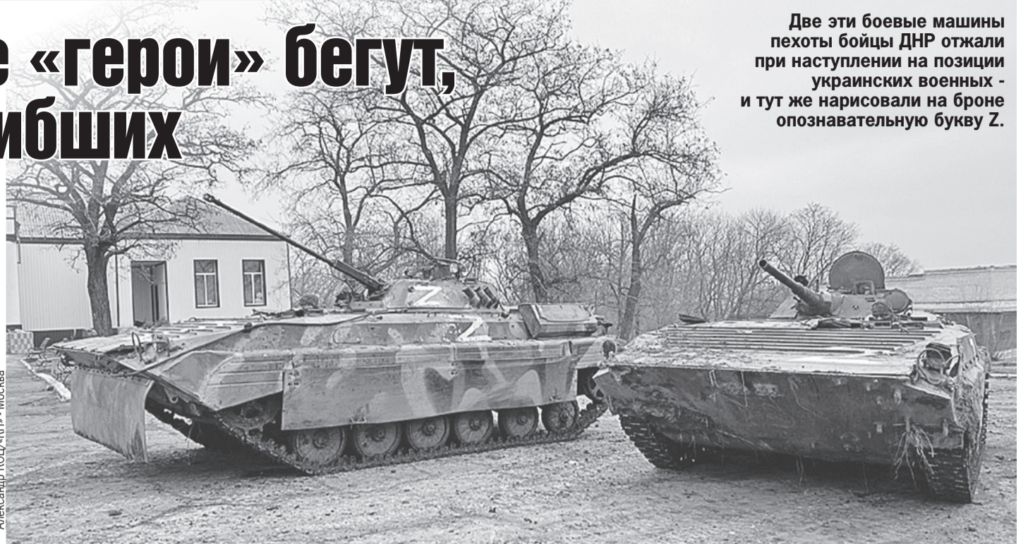
Александр КОЦ/«КП» - Москва

- Ага, час назад в бою две БМП у них отжали. Снова «военторг» заработал.