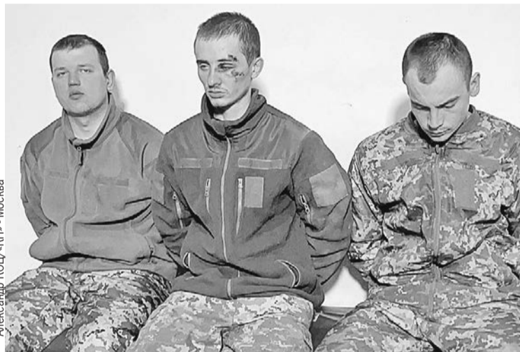
Три этих бойца, сдавшихся в плен в Донбассе, уверяют, что пошли в армию из-за безденежья.

- Жену уволили с работы, я остался без работы. Двое детей. Средств к существованию не было. Пошел в военкомат. Заводы повырезали, станки, машины на вторчермете. Семью содержать надо, решил подписать контракт.