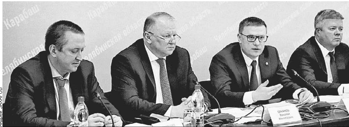
Полпред президента в УФО Николай Цуканов (второй слева) и губернатор Челябинской области Алексей Текслер (третий слева) договорились вместе отстаивать интересы уральских моногородов в Москве.

лодые люди и лучшие кадры. Как сообщил полпред президента в УФО Николай Цуканов, согласно опросам, 24% жителей моногородов готовы сменить место жительства, если проблемы территории не будут решаться. Недовольство вызывает состояние медицины, социальной сферы, качество оказания услуг ЖКХ, комфорт городской среды и другие вопросы.