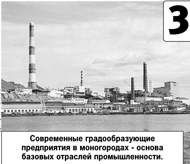
Современные градообразующие предприятия в моногородах - основа базовых отраслей промышленности.

- Мы видим яркий пример социальной ответственности бизнеса. Хотелось бы, чтобы в других городах подобные примеры были такими же яркими, - заявил Николай Цуканов. - Но бизнес не может полностью взять на себя затраты в развитии городов.