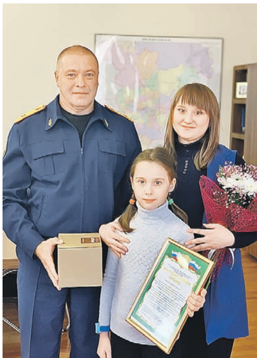
Мужественная продавщица (на фото - справа) получила медаль от Следственного комитета, а ее дочь мамой очень гордится!