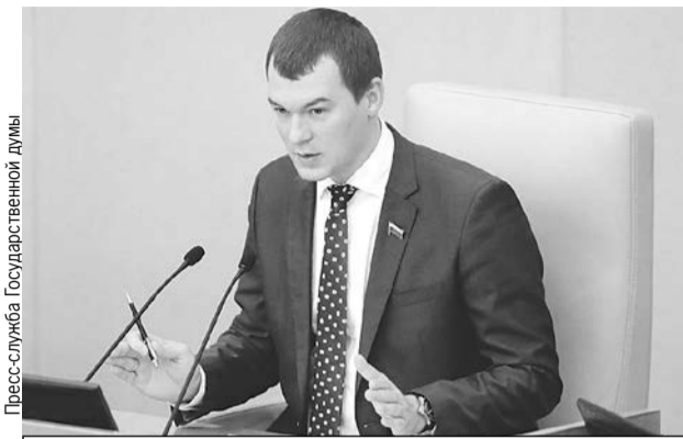
Михаил Дегтярев: «Конкурс дает равные шансы всем сделать карьеру».

Кто бы ты ни был - коммунист, западник или центрист, тебя выбирает народ, и ты обязан