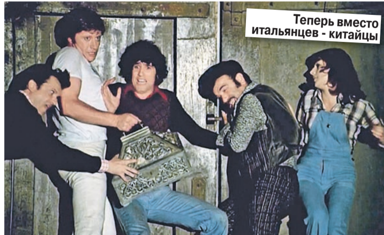
КАДР ИЗ ФИЛЬМА «НЕВЕРОЯТНЫЕ ПРИКЛЮЧЕНИЯ ИТАЛЬЯНЦЕВ В РОССИИ»

В-третьих, это не совсем про кино. Это больше про политику. Потому что идея переснять «Невероятные при-