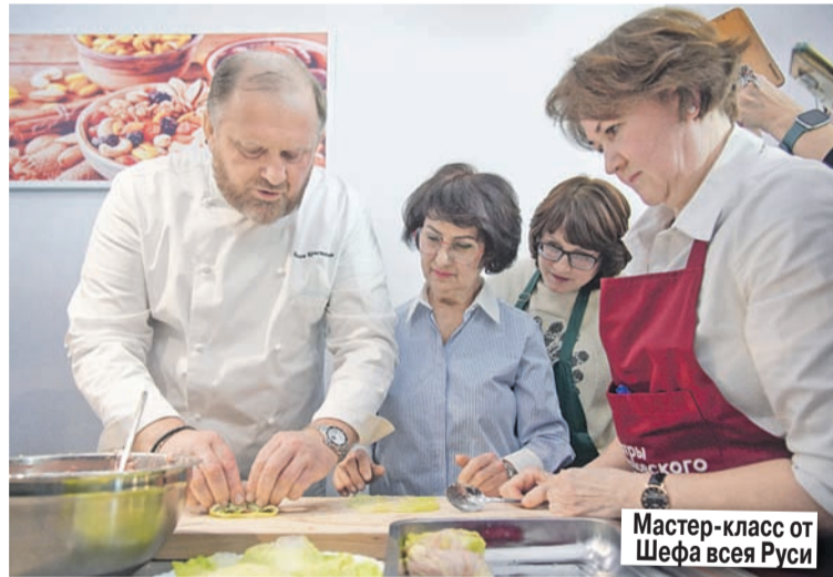
Мастер-класс от Шефа всея Руси

- Поверь, если бы ты была на моем месте, тоже бы разошлась! Но постепенно я ста-