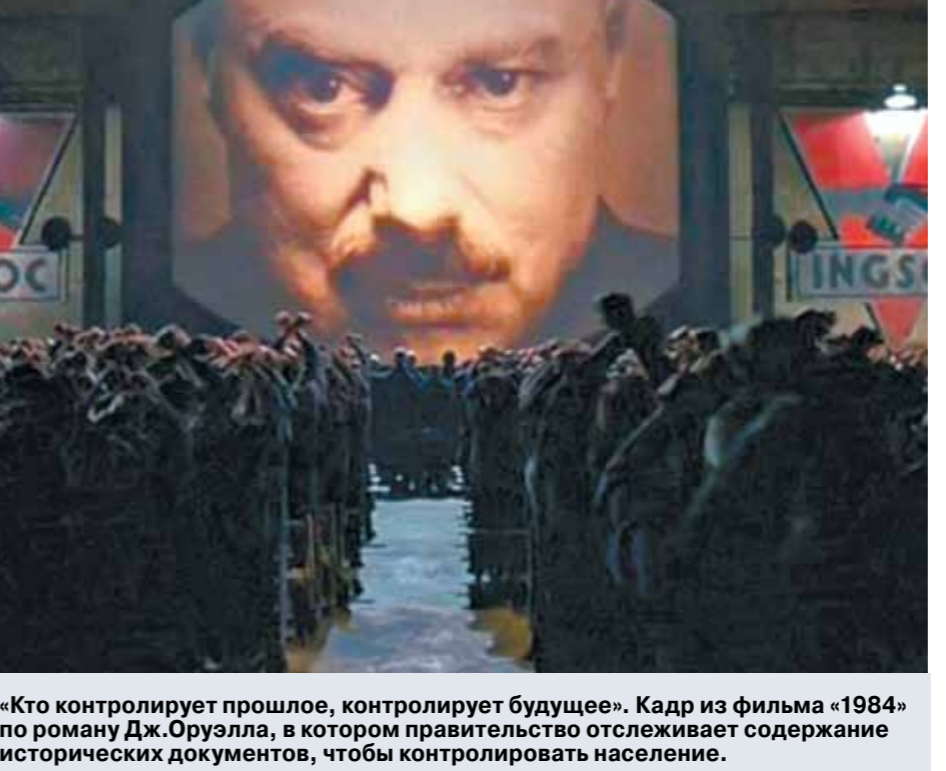
«Кто контролирует прошлое, контролирует будущее». Кадр из фильма «1984» по роману Дж.Оруэлла, в котором правительство отслеживает содержание исторических документов, чтобы контролировать население.

Он подчеркнул, что власти России осаждают от «оборонки» ощутимой отдачей по экономике