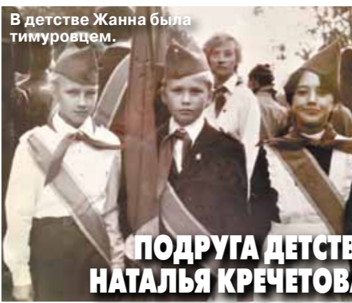
В детстве Жанна была тимуровцем.

Больше года назад новость о болезни Жанны Фриске... как гром среди ясного неба. С кем угодно, но с внешне благополучной, счастливой Жанной этого не могло случиться.