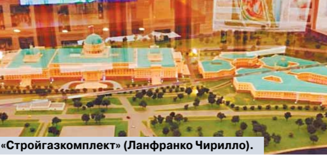
«Стройгазкомплект» (Ланфанко Чирилло).