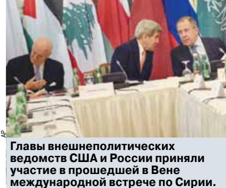
Главы внешнеполитических ведомств США и России приняли участие в прошедшей в Вене международной встрече по Сирии.

На переговорах в Вене, посвященных сирийскому кризису, российские дипломаты передали своим международным партнерам список сирийских оппозиционных групп, которые готовы к сотрудничеству с Россией.