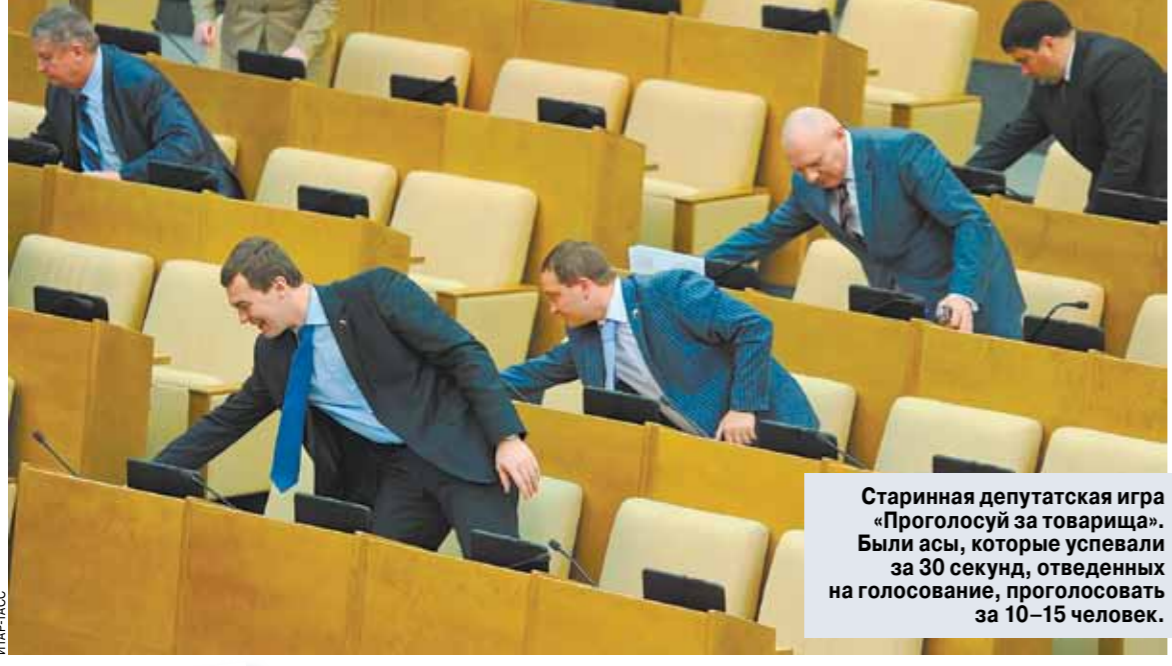
Старинная депутатская игра «Проголосуй за товарища»

Более 20 лет депутатов хотят заставить ходить на заседания. Получится ли на этот раз?