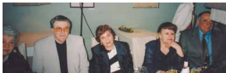
Дружба крепкая не сломается... С Александром Ширвиндтом.