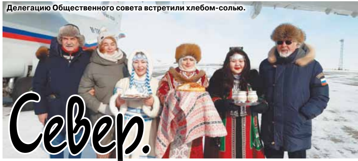
Делегация Общественного совета встретили хлеб-солью.