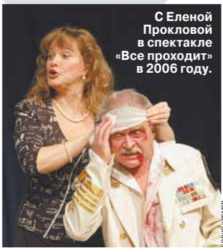
С Еленой Прокловой в спектакле «Все проходит» в 2006 году.

футбола Эдуард Стрельцов. Вася Шукшин в то время ночевал на вокзале, и я ему сказал: «Вась, приходи. Я тебе раскладушку дам». В чулане на сундуке стелил полушубок, а когда родители уезжали на дачу, которую маме дали на электростанции, куда-то раскладушка подевалась. Если бы те, кто на ней лежал, оставили автографы, то ей бы цены не было.