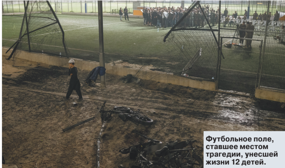
Футбольное поле, ставшее местом трагедии, унесшей жизни 12 детей.

Если верить министру иностранных дел Израиля Ираэлю Кацу, то, вероятно, так оно и будет.