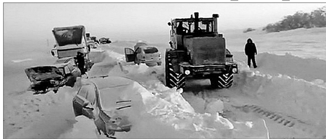
На трассе Оренбург—Орск.

И вновь главным ньюсмейкером новогодних каникул стало министерство чрезвычайных ситуаций России. Чиновники пожарно-спасательного министерства излучают оптимизм по поводу результатов своей деятельности.