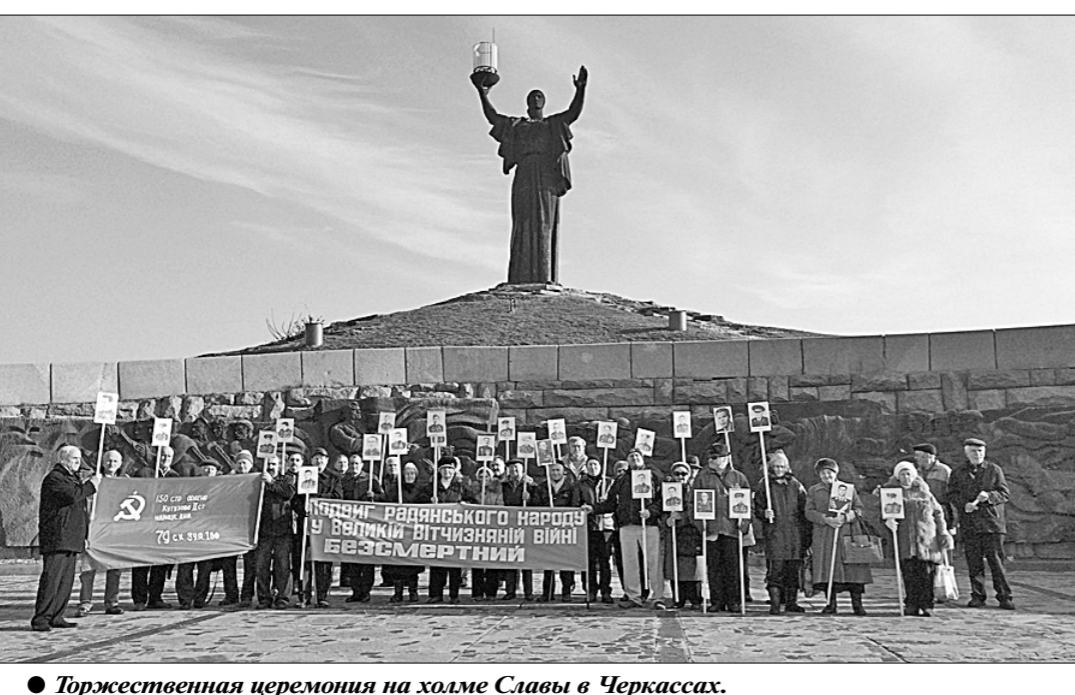
Торжественная церемония на холме Славы в Черкассах.

Он напомнил, что годы Великой Отечественной войны явились суровым испытанием для всего советского народа. И тогда Украина приняла на себя жесточайший, человеконенавистнический удар германского вермахта. «Неспособное мужество, горячий патриотизм советских солдат и офицеров стали теми непреступными бастионами, о которые разбилась вражеская полчища, — подчеркнул первый секретарь ЦК КПУ. — Никакие пытки и муки, никакие зверства и издевательства фашистских палачей, их буржуазно-националистических пособников и полицая не сумели сломить волю нашего народа. Народа, который от мала до велика бесстрашно сражался на фронте и на оккупированной территории, предпочитая лучше погибнуть, чем стать рабом».