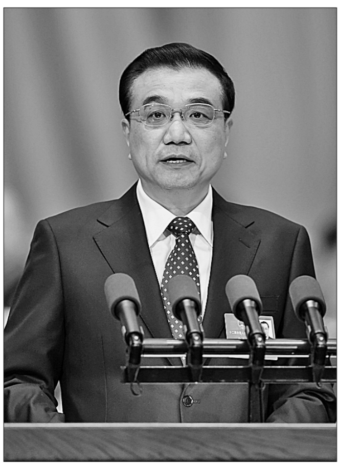
5 марта в Доме народных собраний в Пекине открылась 4-я сессия ВСНП 12-го созыва. Премьер Госсовета КНР Ли Кэцян выступает с докладом о работе правительства.