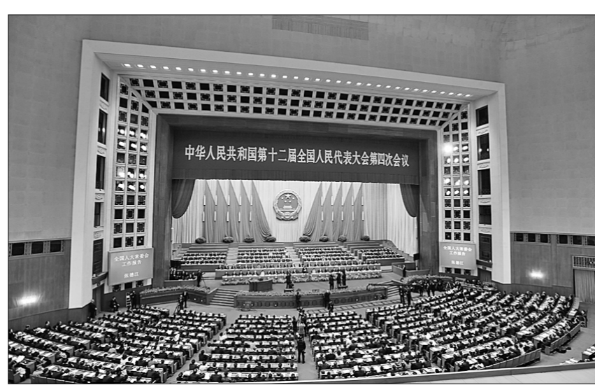
16 марта в Доме народных собраний в Пекине прошла церемония закрытия 4-й сессии ВСНП 12-го созыва. Фото: корреспондент газеты «Жэньминь жибао» он-лайн» ЮЙ КАЙ.

В последнее время иностранные журналисты на пресс-конференциях МИД КНР постоянно задают вопросы о развитии сотрудничества Китая с соседними странами в области строительства высокоскоростных железнодорожных магистралей. В частности, их интересует подробность, связанные с трудностями в реализации этих проектов.