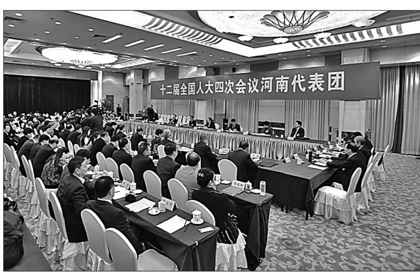
7 марта прошло заседание представителей делегации провинции Хэнань в ходе 4-й сессии ВСНП 12-го созыва.