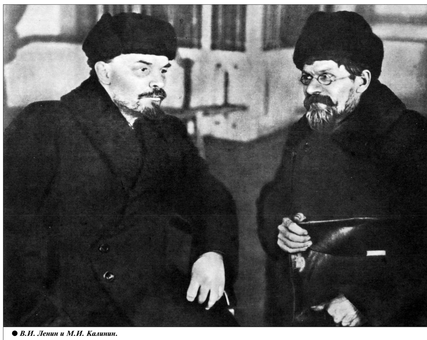
● В.И. Ленин и М.И. Калинин.

Генидий АЛЕКСАНДРОВ. Историк-исследователь. г. Санкт-Петербург.