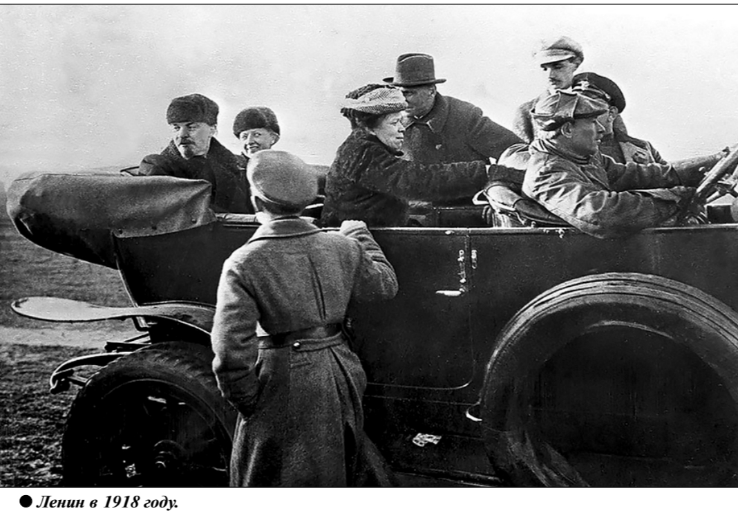
Ленин в 1918 году.

Так совпало, что, когда следствие о покушении уже близилось к концу, германские войска, нарушив перемирие, взяли Псков и двинулись на Петроград. Кольбы же революции оказались на осадном положении. Публикуется знаменитое ленинское воззвание «Социалистическое Отечество в опасности!» и вот тогда участники покушения попросились на