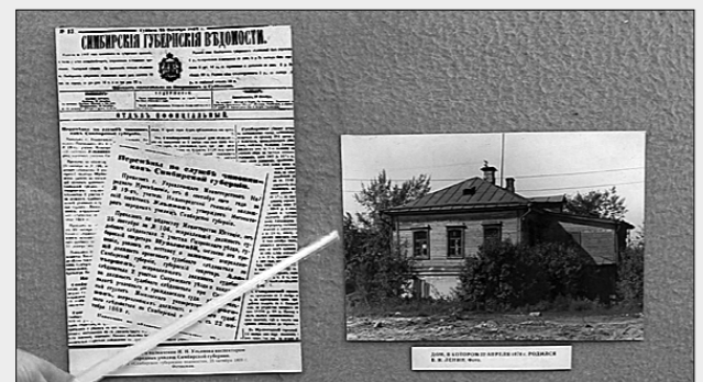
Премьера специального репортажа на телеканале «Красная Линия» состоится в понедельник, 22 января, в 22.15.