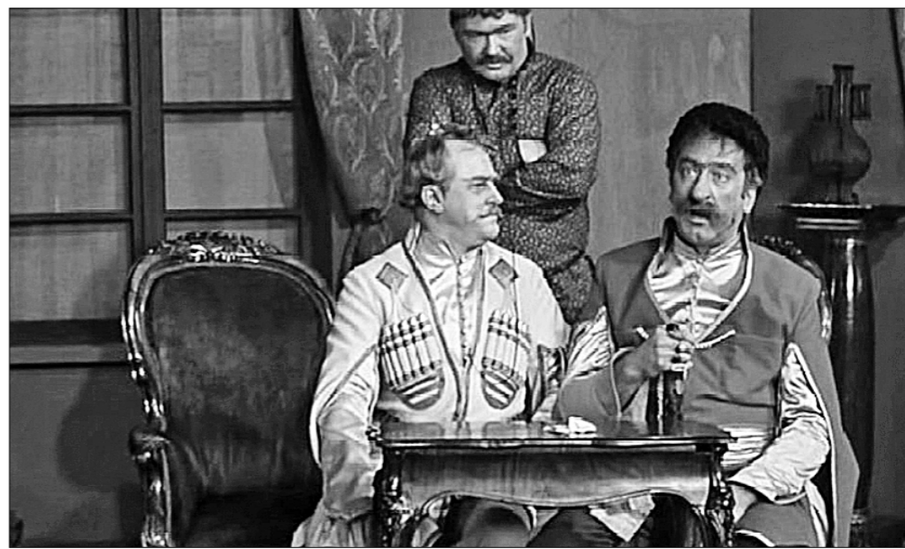
● Кадры из телеспектакля «Ханума».

Русская литература — одно из главных богатств нашего народа. Читая Чехова, Пушкина, Толстого, Горького, можно найти ответы на самые актуальные вопросы сегодняшнего дня и задуматься о вечных проблемах человеческого существования. Каждое воскресенье в рубрике «Классный час» телеканал «Красная Линия» представляет кинопоказку по произведениям русских и советских классиков. «Каждый жить мечтает, как в раю, каждый ищет выгоду свою — выгодно купить, выгодно продать, чтоб побольше взять и поменьше дать...» Знакомая проблема, не правда ли? Это слова из классического спектакля «Ханума» в постановке Георгия Товстоногова. «Ханума» — весёлая история о никогда не унывающей и предприимчивой свахе из Тбилиси — стала одним из самых популярных спектаклей Большого драматического театра. Постановка выдержала около 300 представлений, а спустя несколько лет после премьеры была сделана телевизионная версия спектакля, благодаря чему мы можем спустя сорок лет насладиться замечательной игрой актёров и великолепной режиссёрской работой.