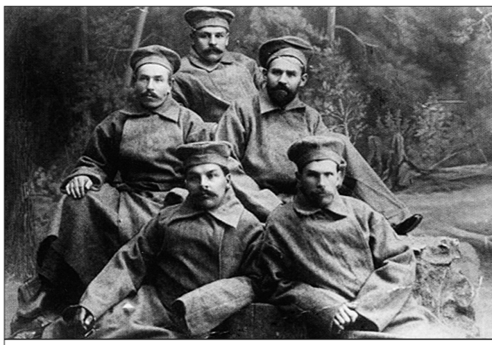
● Арестованные большевики — депутаты IV царской Думы.

Кроме того, существует давний миф о том, что само слово «парламентаризм» в лексиконе В.И. Ленина и большевистской партии было однозначно браным. Причём ретивые остальные раздувают подобную чушь как раз те, которые долгие вре-