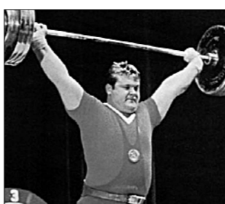
— 80 лет назад родился Л.И. Заветский (1938—2016) — советский тяжелоатлет, заслуженный мастер спорта СССР. Неоднократный олимпийский чемпион, чемпион мира, Европы и СССР.

ного деятеля науки и техники РСФСР, одного из первооткрывателей Норильского рудного района. В 1930—1932 гг. вместе с Г.А. Ушаковым провёл первое географическое и геологическое обследование Северной Земли.