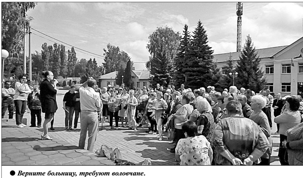
● Верните больницу, требуют воловчане.

Депутаты-коммунисты Липецкого областного Совета депутатов встретились с жителями самого отдалённого района — Воловского. Было решено провести митинг, чтобы обсудить проблемы медицинского обслуживания в селе Волово, где «оптимизировали» местную больницу.