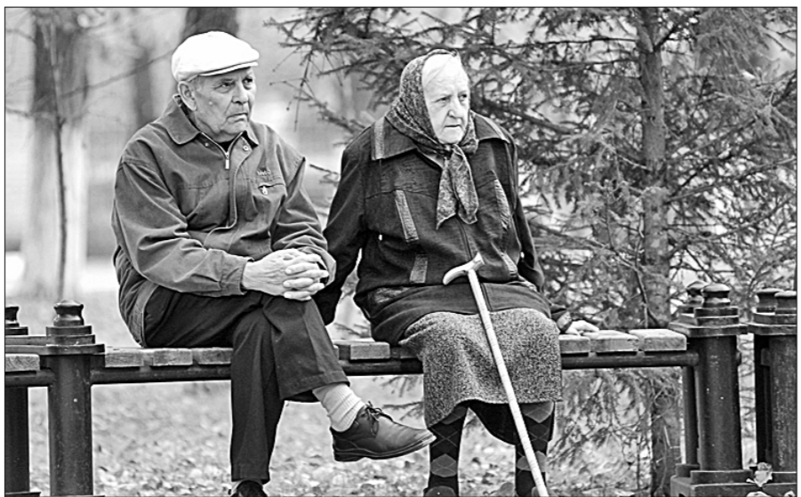
По уровню жизни российским пенсионерам уступают только их ровесники из Индии, Греции и Бразилии.

раза жизни граждан — это даёт около 60% успеха. Как этого добиться в стране, где 20 млн человек живут ниже черты бедности, пьют и колотятся из-за отсутствия видения перспектив в России, экономикой которой затянута в болото застоя, не объясняется.