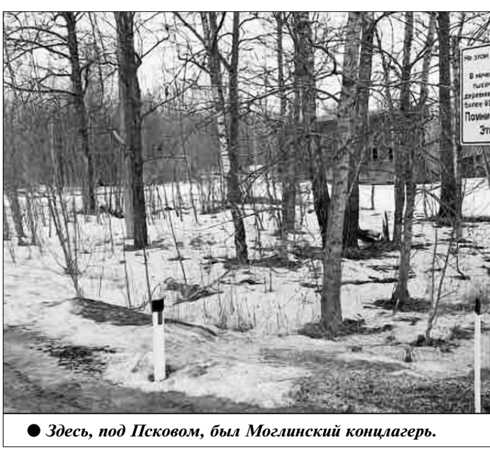
Здесь, под Псковом, был Моглинский концлагерь.