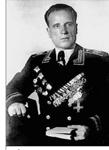
Главный маршал авиации А.Е. Голованов и его книга.