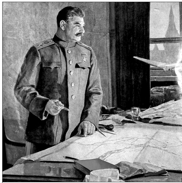
Руководитель Коммунистической партии и Советского государства И.В. Сталин стал вождём Великой Победы.

Дорогая редакция «Правды»! Декабрь 2019 года в сотрудничестве с моей родной газетой получился у меня, как никогда, «урожайным».