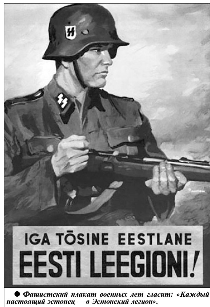
Фашистский плакат военных лет гласит: «Каждый настоящий эстонец — в Эстонский легион».

Событие, состоявшееся в Пскове в конце 2019 года, по своей значимости выходит далеко за пределы нашего региона. Управлением ФСБ по Псковской области снят гриф «секретно» с документов, которые ошеломляют подробностями зверств эстонских карателей на Псковщине в 1941—1944 годах.