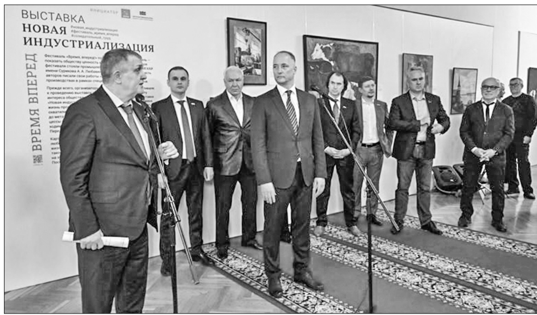
Выставка «Новая индустриализация» в Госдуме РФ.

3 апреля в Госдуме РФ состоялась торжественная церемония открытия художественной выставки «Новая индустриализация». Открыл её первый заместитель председателя фракции КПРФ в Госдуме Н.В. Коломеец.