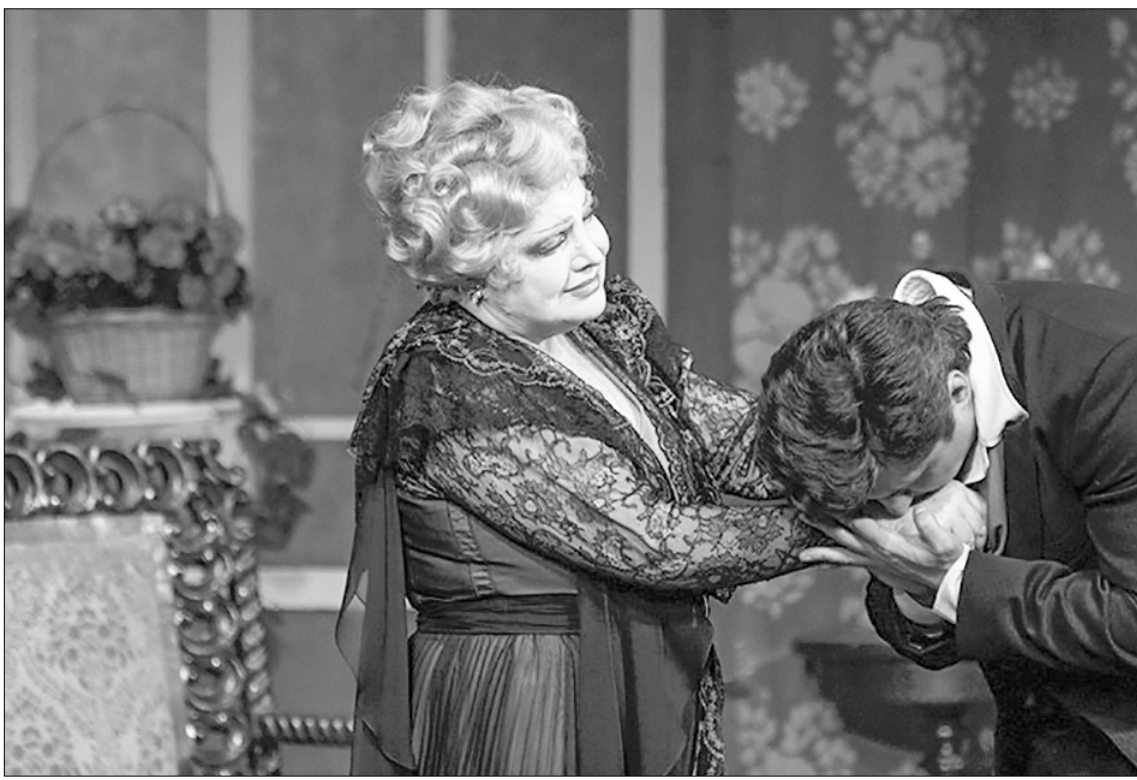
Народная артистка СССР Т.В. Доронина в спектакле «Без вины виноватые».

И действительно! Насколько ясно мы видим и глубоко понимаем сегодня то, чем одал целовечество этот отечественный гений, творец нашего национального театра? Более 150 лет пьесы русского драматурга А.Н. Островского украшают сцены мира. В его произведениях заложено гигантское многообразие типажей русского характера, открыты лучшие национальные черты, уловлена жажда наша ощущать в себе историческую связь с деятельностью человека Пушкинской эпохи.