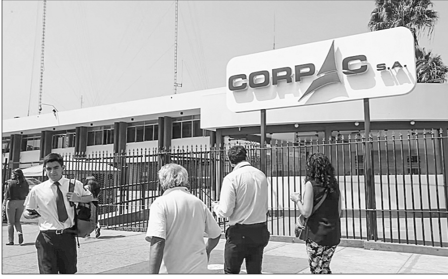
опубликованном заявлении профсоюза Sineasor.

6 ноября Национальный профсоюз авиационных работников корпорации Sogras (Sineasor) объявил о проведении 48-часовой забастовки в Перу. Рабочая организация представляет интересы 150 сотрудников, которые потребовали выплаты обещанных бонусов. К стачке также присоединился Объединённый профсоюз авиадиспетчеров (SUCTA). Протестные акции планировались с 13 по 14 ноября, но в последний момент руководство Sogras пошло на соглашение, а забастовка была приостановлена.